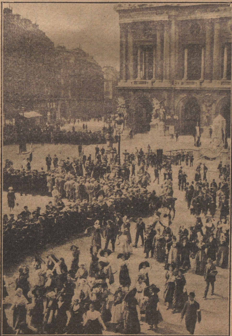
Fiesta celebrada en París, en honor de las Delegaciones alsacianas, que asistieron a la reciente manifestación de homenaje a Juana de Aro.