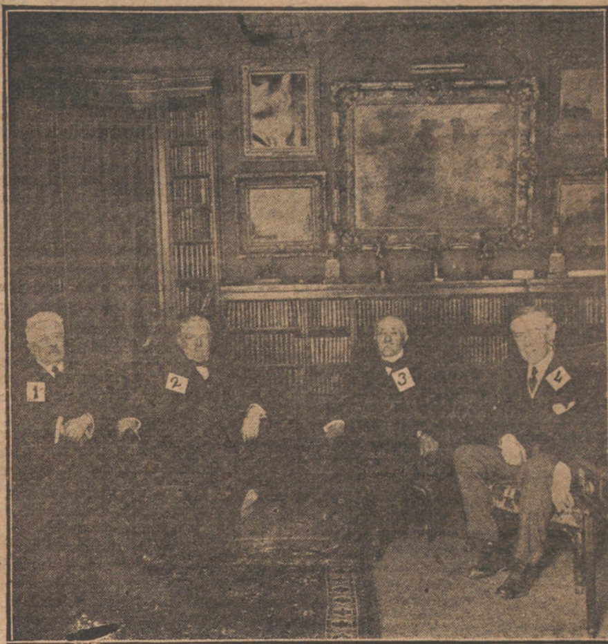
EL CONSEJO DE LOS CUATRO.—Rolando (1), Lloyd George (2), Clemenceau (3) y Wilson (4), reunidos en el despacho del Presidente de los Estados Unidos, para deliberar acerca de las contraproposiciones de los alemanes.

La unión de conservadores y mauristas es imposible, porque les separa el abismo de un pasado lleno de frases despectivas del Sr. Maura, y porque, además, la opinión la vería como un acto incorrecto, midiendo a todos por igual, declarando que la política española había perdido definitivamente la vergüenza y la dignidad. El Sr. La Cierva trabaja con insistencia por la unión, porque, para su concepción como hombre de gobierno, estos reparos significan una futilidad en su mentalidad de cacique. La unión de mauristas y conservadores sería la última vergüenza por que el Sr. La Cierva haría pasar al Sr. Maura, presentándole ante el país unido a los mismos hombres a quienes insultó con las frases más punzantes y más despectivas. Esta vergüenza dolorosa, que terminaría definitivamente con la figura del Sr. Maura, debe evitarse por compasión hacia un hombre ilustre, que España quería conservar como modelo de integridad política.