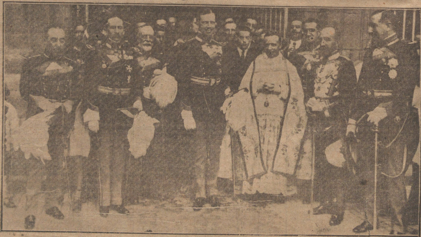
Su Alteza el Infante Don Fernando, saliendo de la solemne fiesta religiosa, celebrada esta mañana por los Caballeros de San Juan de Malta.