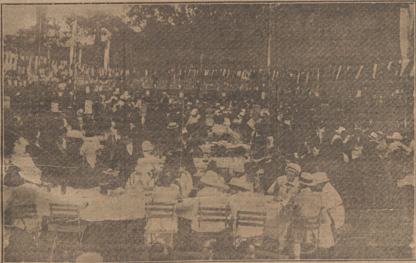
Un detalle de la jiva campestre, organizada por el Club Deportivo de San Sebastián, a la que concurrió toda la aristocracia vascuense.

Claro que no pedimos que se reúnan los directores de los periódicos—¡Dios los libre de esa reunión!—, ni que se eleven solicitudes al Gobierno, ni siquiera que se suprima la información parlamentaria. De pedir algo, pedíamos que en las futuras escuelas de periodistas se enseñara una asignatura que podía titularse: «Concepto que debe tener el periodista de su propio decoro y de sus obligaciones para con el público.»