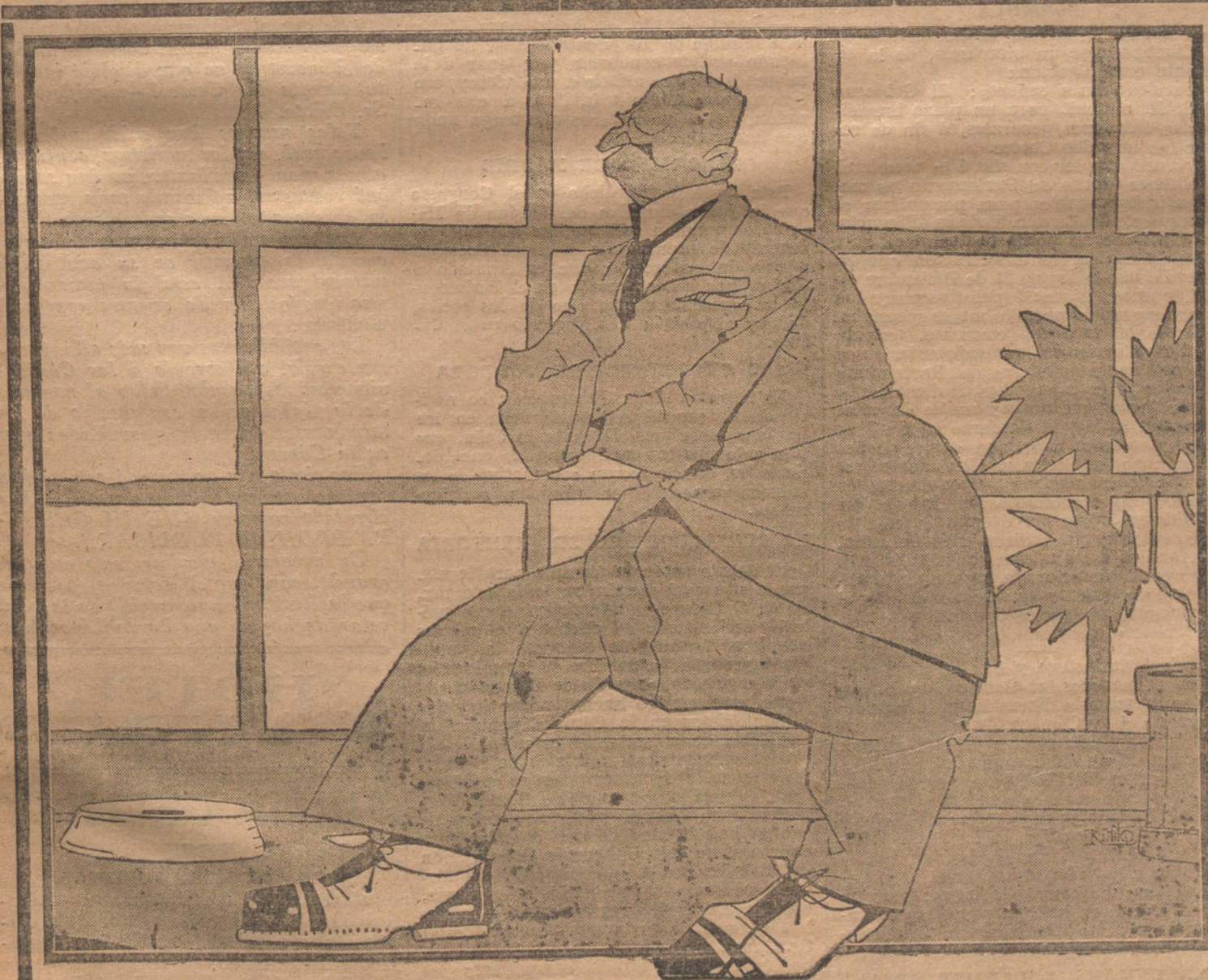
EL PACTO DE LAS IZQUIERDAS

Cuando los periodistas fueron a la residencia del conde de Romanones, sólo pudieron enterarse de que éste había dado orden terminantemente a la servidumbre de decir que no estaba para nadie.