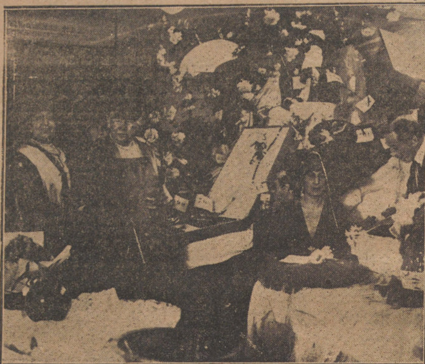
Su Majestad la Reina Victoria y Su Alteza la Infanta Isabel, en la fiesta benéfica, celebrada en el local social de la Obra, para el mejoramiento de la clase obrera.