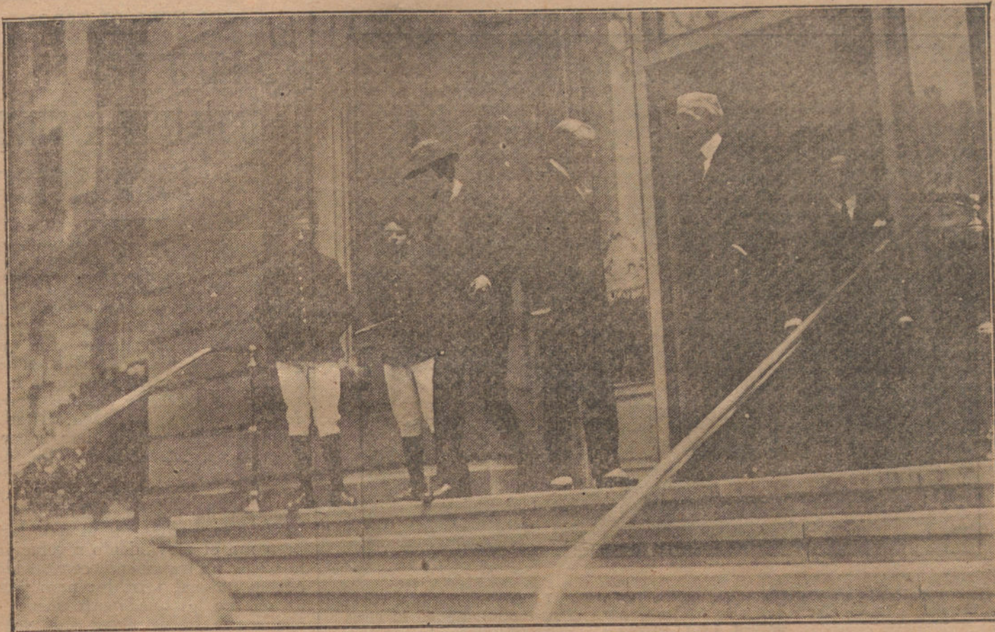
EL VIAJE DEL REY A SAN SEBASTIAN.—Su Majestad con el gobernador civil y el marqués de Viana, saliendo del Hotel Maria Cristina, poco después de su llegada a la capital donostiarra.