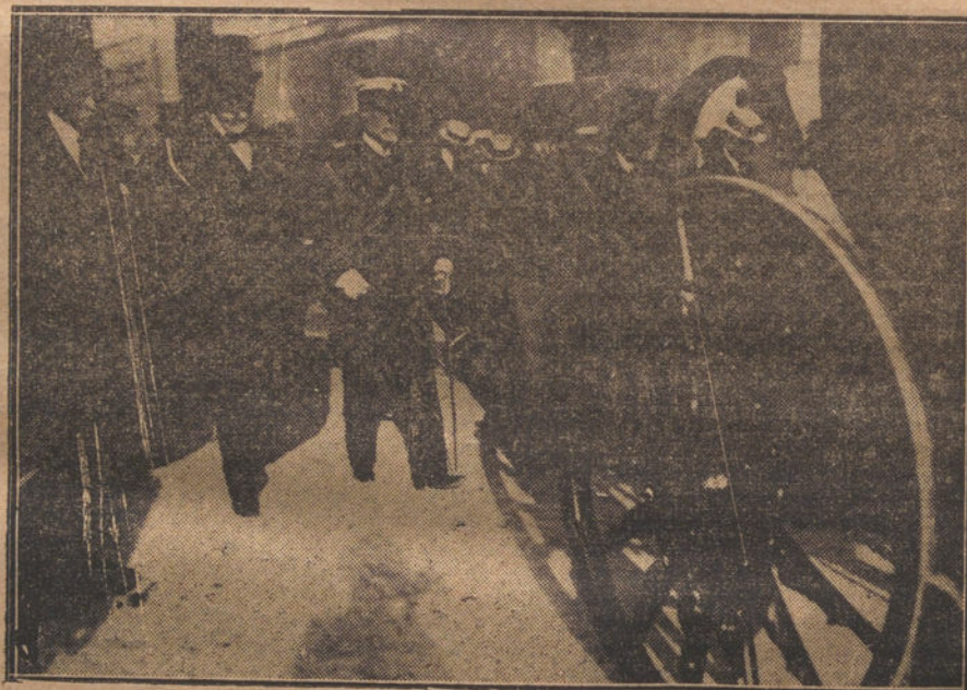
Presidencia del entierro del ilustre político D. Javier Ugarte.

La satisfacción fué inmensa, y se pusieron colgaduras en muchas casas. El Crédit Lyonnais fué iluminado.