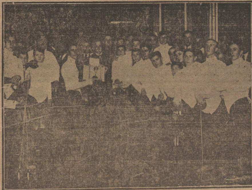
Reparto de premios a los alumnos de las clases de egrima del Instituto, acto verificado ayer en la Universidad Central, bajo la presidencia del rector, señor Carracedo.

Minutos antes de la una terminó la reunión, en la que, según manifestaron al salir los primeros, los Sres. Alvarez y marqués de Alhucemas, se había ratificado, por los reunidos, un amplio voto de confianza al conde de Romanones para que sea éste quien, en nombre de todas las minorías, apoye la proposición de censura contra el Gobierno, por la prórroga anticonstitucional del presupuesto.