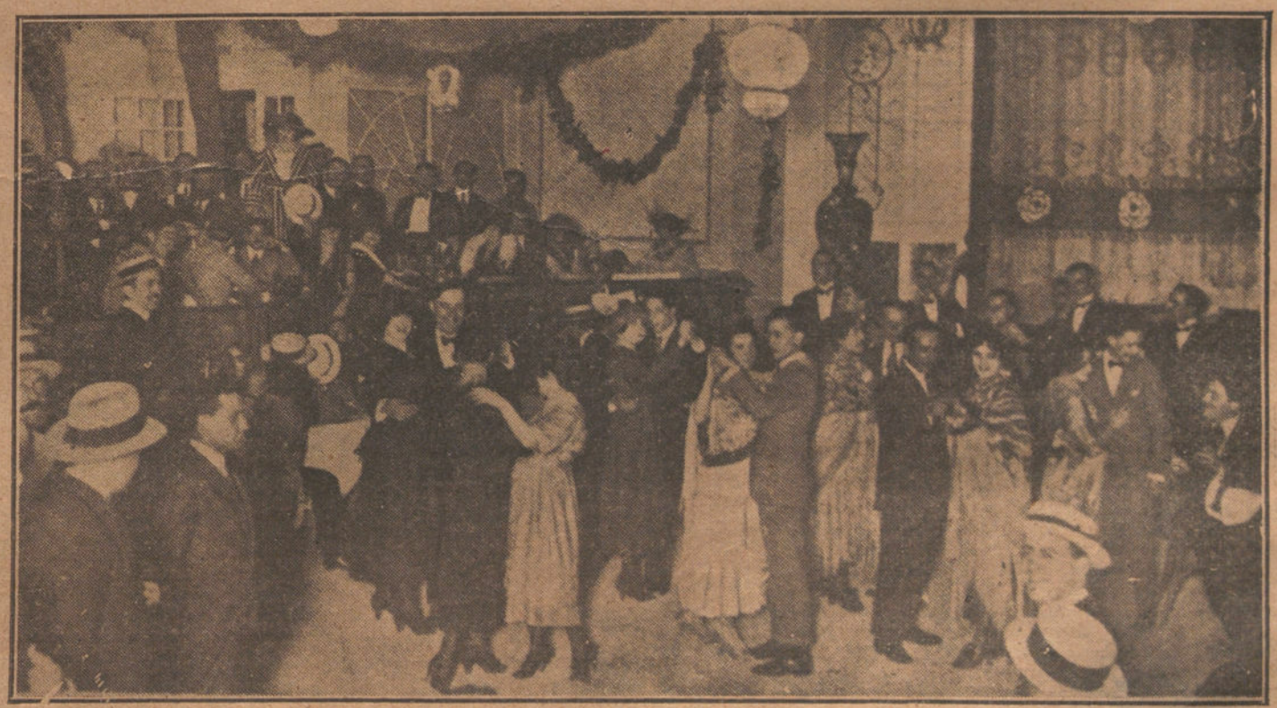
IDEAL ROSALES.—Un rincón del parque de recreo, en noche de verano.