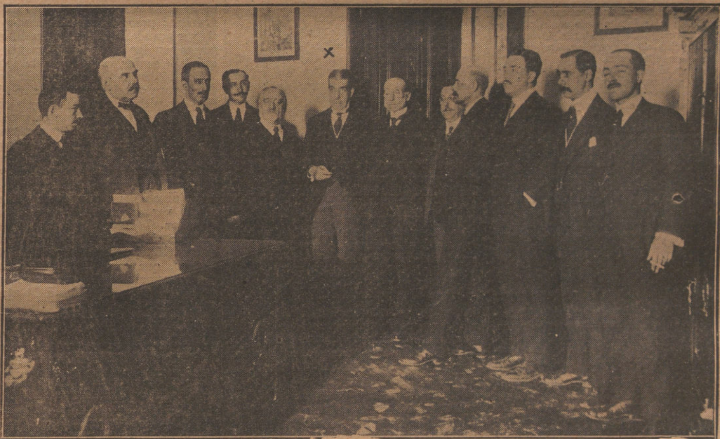
El ilustre ex ministro D. Francisco Bergamín (x), después de tomar posesión de la presidencia de la Real Academia de Jurisprudencia y Legislación, cargo para el que fué elegido recientemente por unanimidad.

toral africano, Tánger y Tetuán anulaban por completo á Ceuta, que seguiría torpemente reclusa en su señorial existencia de vejatorio inútil.