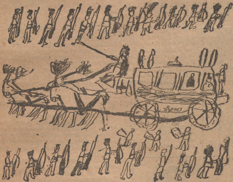
LA APERTURA DE LAS CORTES, por Menolito Avello (seis años).