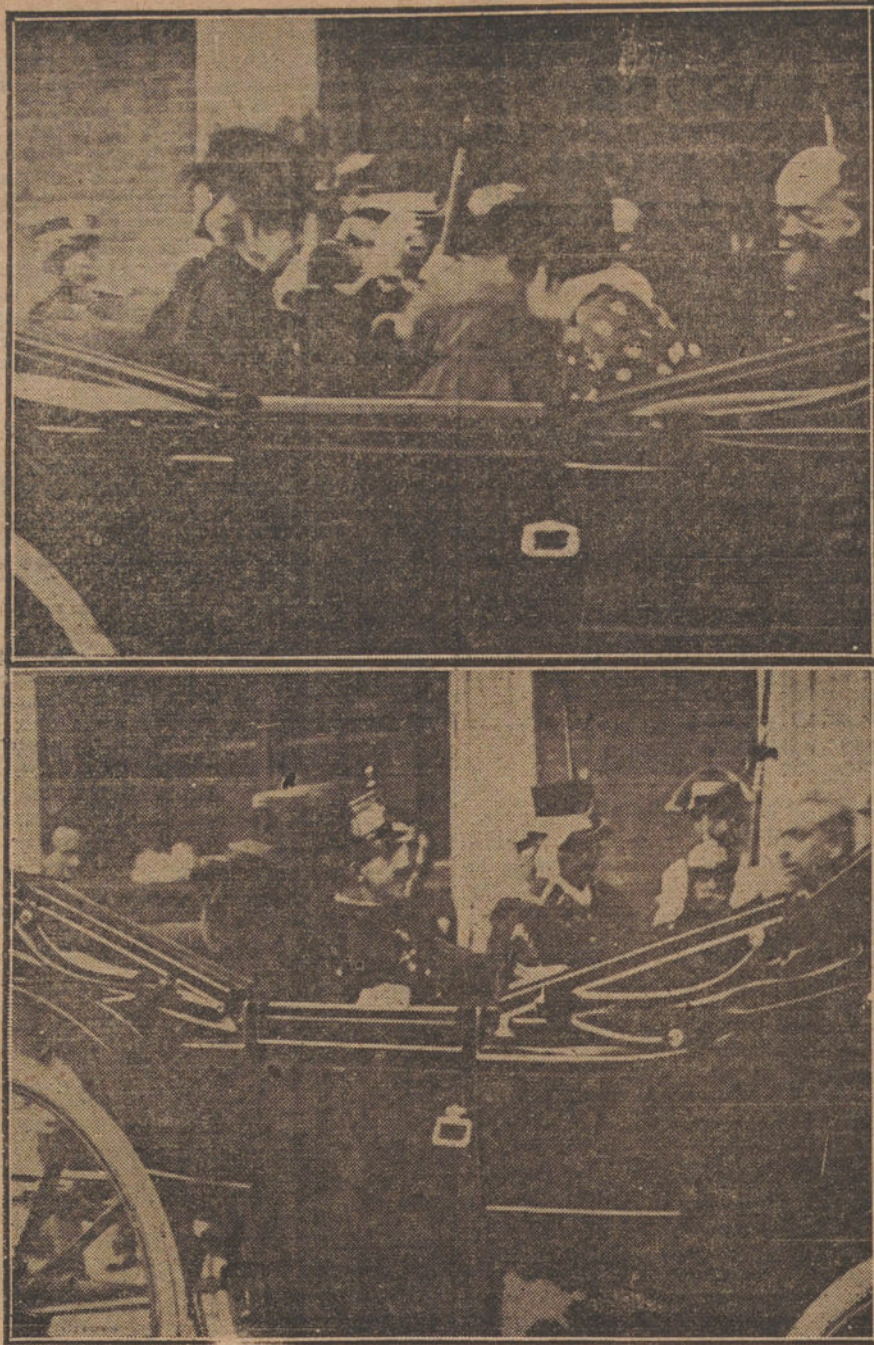
EL VERANEO DE LA FAMILIA REAL.—Su Majestad la Reina Cristina, dirigiéndose a la estación para marchar a San Sebastián.—Debajo: Su Majestad la Reina Victoria, que anoche marchó a Santander.

«No olvidemos que ha sido el Imperio británico el que ha ganado esta guerra. Sin entrar en detalles, todos sabemos que nuestros amigos los rusos nos abandonaron; que los italianos no han hecho gran cosa; los franceses hicieron el máximo, pero en los comienzos. Durante los dos últimos años ha sido la vieja Inglaterra la que ha soportado el grueso de la lucha. Espero que todos se den cuenta exacta de esto, y que se haga todo lo posible por el bienestar de los que combatieron y sufrieron.»—Radio.