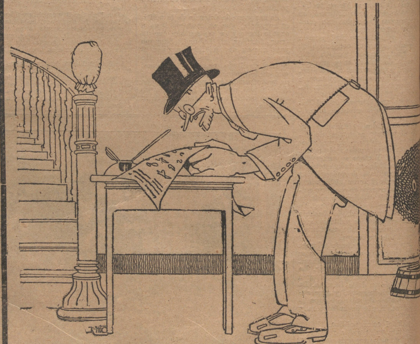
El paciente pasó la noche con tranquilidad. Sigue terminantemente prohibido hablarle... de Matamala.

La presidencia mantuvo el orden que no era reglamentario discutir y con tal motivo, rectificó el Sr. Gasparri y hablaron otros diputados con guiente alboroto de los ministros protestas de las minorías que se raban atropelladas en su derecho del asunto.