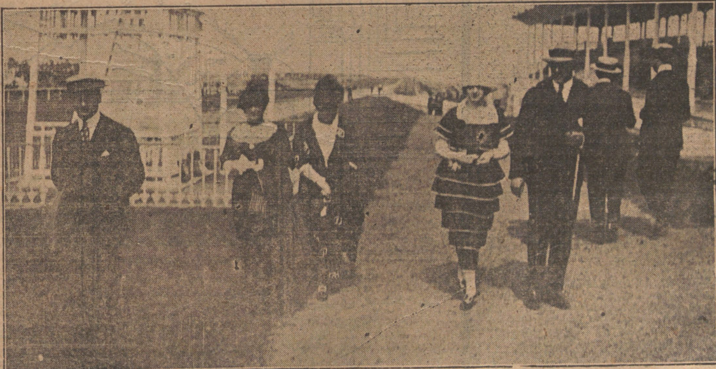
EL VERANO EN SAN SEBASTIAN.—Un detalle del estand, durante la primera sesión de las carreras de caballos.

Como el Ayuntamiento aprobó la concesión de terrenos para este fin, se aprovechará en seguida esta coyuntura para que sea pronto un hecho la creación de la Universidad.»