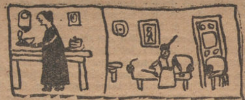
MI COCINERA, CON EL DESAYUNO, y MI MAMA, EN LA CONSULTA, por José Domínguez (ocho años).

Los premios podrán ser recogidos en nuestra Redacción, Jardines, 4, mañana, domingo, de doce de la mañana a una de la tarde, previa identificación de los agraciados.