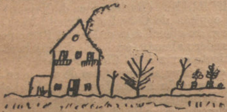
UNA CASA DE PUEBLO, por Lola Doque.

Plato de huevos con leche. —Pan rallado muy tostado, una escudilla de leche, cuatro onzas de azúcar, cuatro huevos frescos bien batidos, y todo junto se pone en cuajaderas untadas de aceite frito y con humbre abajo y arriba. Sobre el batido, azúcar y canela.