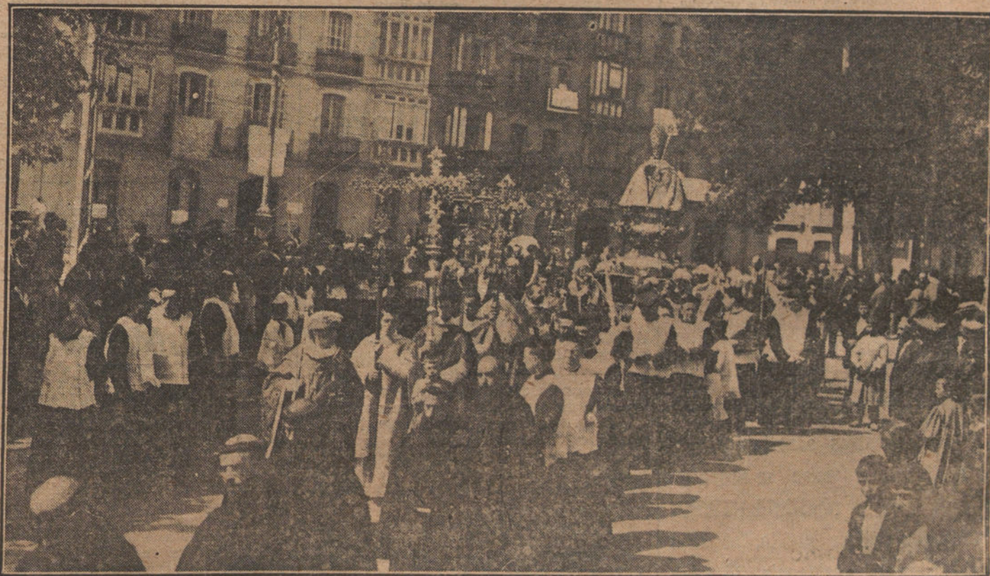
LAS FIESTAS DE PAMPLONA.—Un detalle de la típica procesión de San Fermín.

Al recibir esta mañana a los periodistas el ministro de Hacienda, les facilitó los datos de recaudación del impuesto de Derechos reales, que acusan un aumento progresivo de importancia.