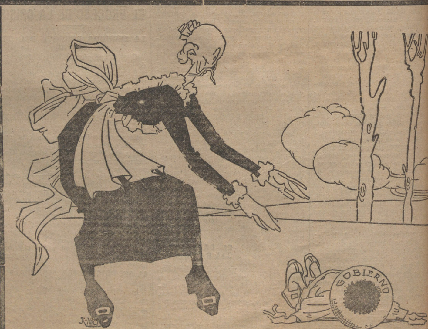
—¡Pobrecito mío! ¡Un momento que lo he dejado solo, y qué batacezo!