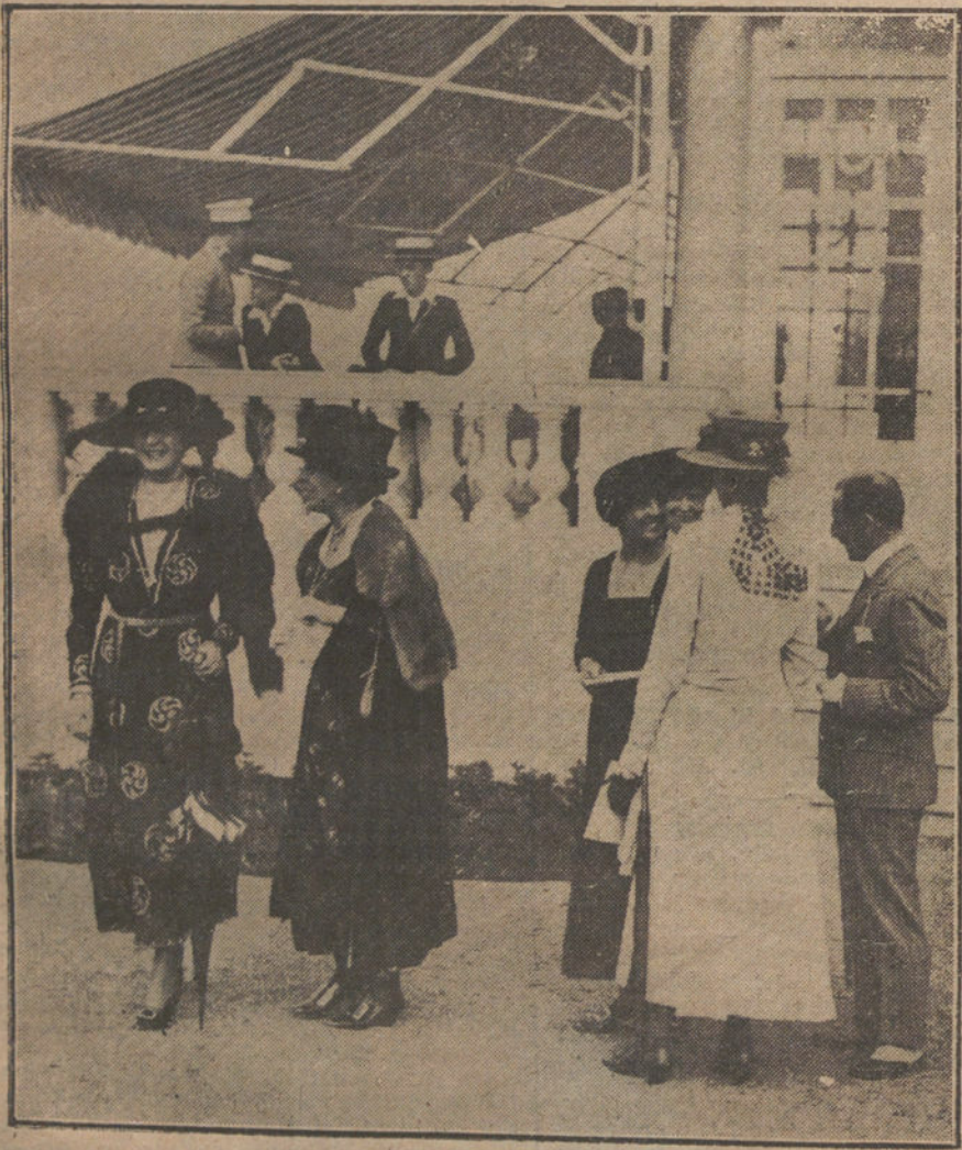
EL VERANO EN SANTANDER.—S. M. la Reina Doña Victoria en el Hipódromo de Bellas Vistas, durante las carreras de caballos.

—¡Esto se va! ¡Esto se va!—afirmaba el tío Resaca.