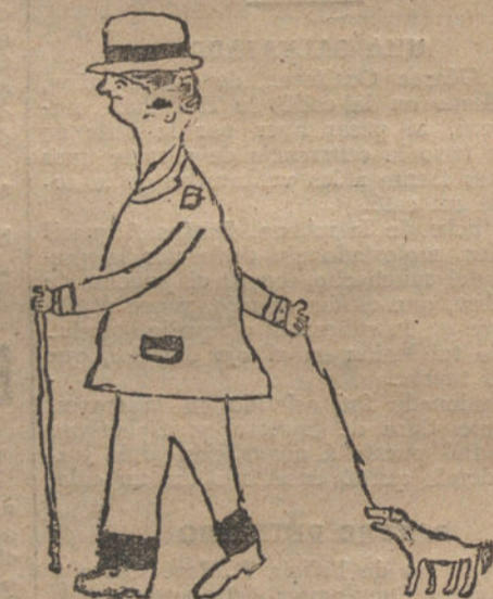
MI PAPA CUANDO VA DE PASEO, por José Domínguez.

—El burrico seré yo... ¡pero como, según el catecismo, todos semos hermanos!... V. S. (Ansuárez Tintero.)