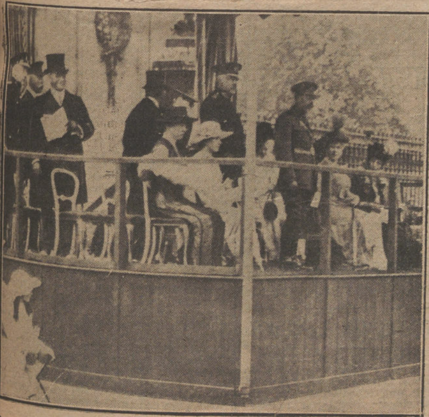
LA VUELTA DE LA GUERRA.—Los Reyes de Inglaterra presenciando el desfile de los regimientos repatriados por las calles de Londres.

Resumió el acto el Sr. Tío, y al final se dieron vivas a Rusia y a la libertad.