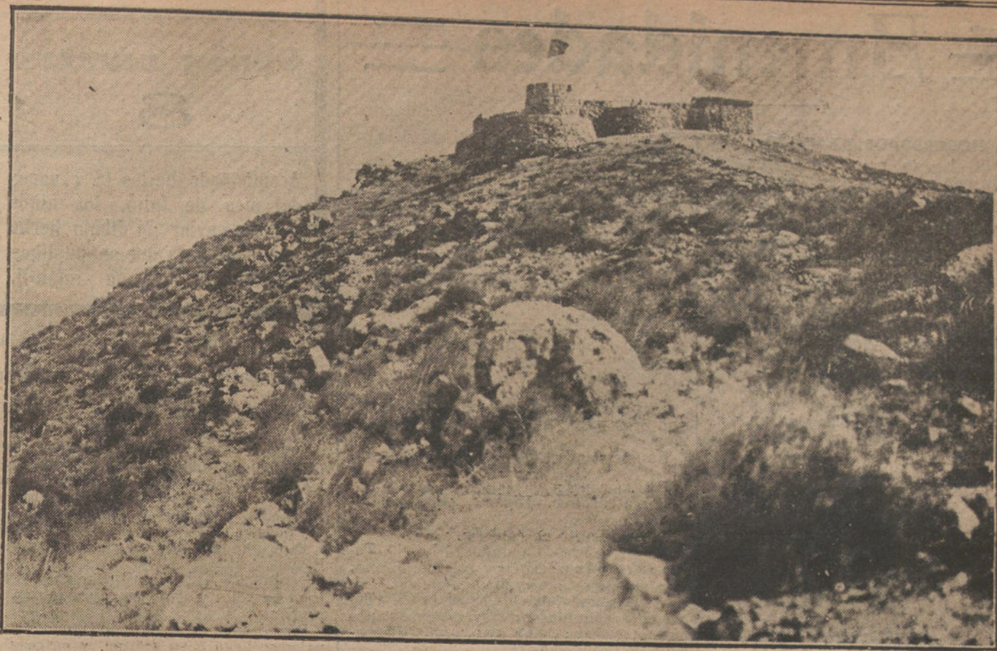
NUESTRAS TROPAS EN AFRICA.—Posición de Kaus Ziacha, situada cerca del río Muluya, en Beni Said, que ha sido ocupada recientemente por nuestras tropas.

La que fue—¡hace diez años!—orgullosa casa solar que presidía la amagada vega, mostrábase ahora enjaulada de albayalde, convertida en fungente edificio-fábrica de un producto químico. Apresaba al valle