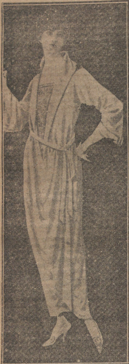
Sencilla bata en satén «souplé», color verde claro.