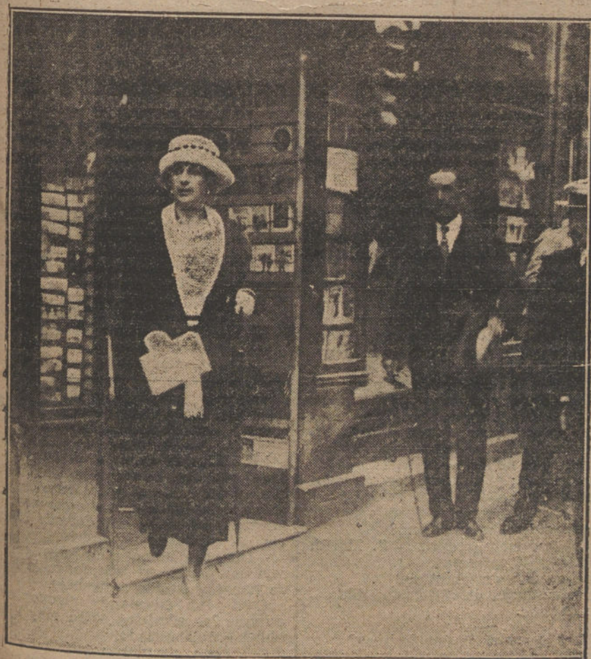
EL VERANEO EN SANTANDER.—Su Majestad la Reina Victoria, saliendo de la librería de Entrecanales, después de adquirir varias fotografías y postales de nuevo.

Las pérdidas se calculan en más de 200 millones de piastros.—Hallet.