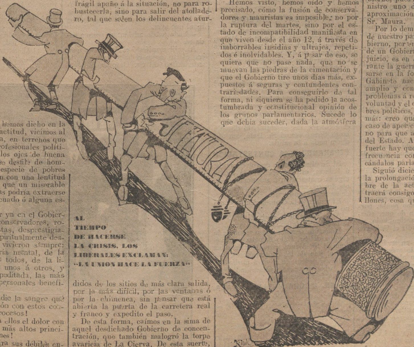
(Caricatura K. Hito.)

No creo factible — añadió — la unión de conservadores y mauristas bajo una jefatura única. Únicamente en el caso de que el Sr. Maura hubiese presentado o presentase a las Cortes una serie de proyectos de verdadera reconstitución nacional, podría realizarse esa unión. En ese caso, yo me ofrecería como amanuense a cualquier