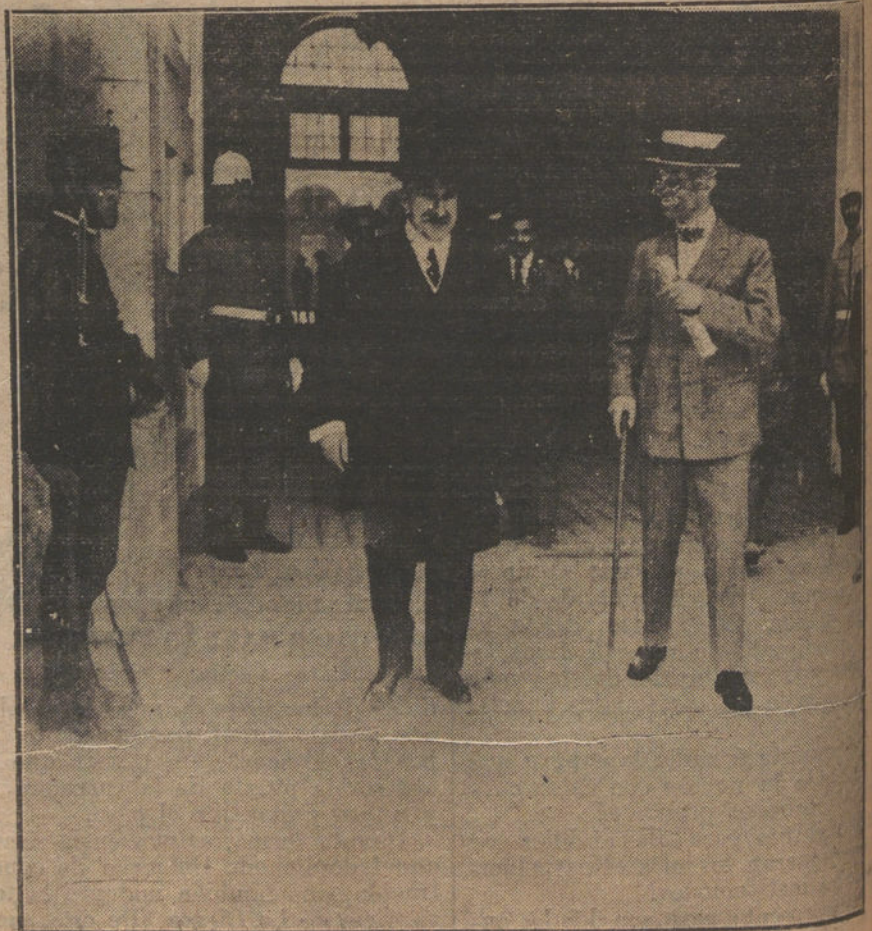
El Sr. Sánchez de Toca, al salir esta mañana de Palacio, después de haber estado con Su Majestad.

Nuestro apoyo—prosiguió—ha sido decidido y constante, y de éste he continuado disfrutando el Gobierno Sr. Maura, si, como yo entiendo, continúa al frente del Gabinete. Como en la discusión del acta de la sesión había habido arrebatos que se lamentar; pero que seguramente no habría ocurrido si los conservadores hubieran tenido el oportuno acuerdo que el Gobierno lo hacía con el Gabinete. En frente de la teoría presentada por el Sr. Maura, se