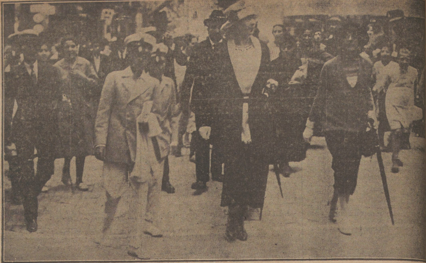
EL VERANEO EN SANTANDER.—Su Majestad la Reina Victoria, con el Príncipe de Asturias y el Infante Don Jaime, paseando a pie por las calles de la población.

Fue curado en la Casa de Socorro, pasando a su domicilio.