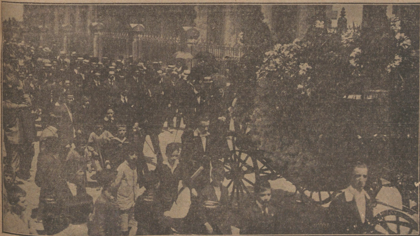
ENTIERRO DEL AVIADOR FRANCES HOPPE, VICTIMA DE LA CATASTROFE DE SAN SEBASTIAN.—La fúnebre comitiva, desfilando por las calles de la población.

—¡Tus injurias!—contestó desdenosamente Tchê-Tang, abriendo la puerta frente a los rayos del sol.