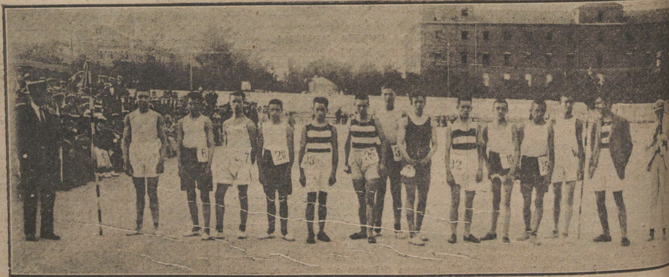
FIESTA DEPORTIVA EN CHAMBERI.—Grupo de corredores, que tomaron parte en la carrera de 2.000 metros.

Otras muchas convocatorias y notificaciones acordadas en tales reuniones, serían demasiado largas para trasladar a estas columnas, con lo copiado hay bastante para formar un juicio sobre este interesante asunto.