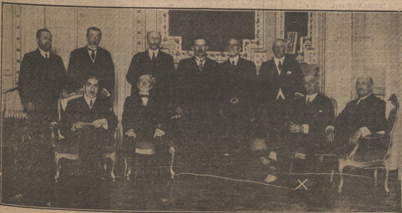
Los nuevos ministros reunidos antes de comenzar el primer Consejo. En la fotografía aparece el marqués de Mochales (x), retratado por última vez.

Después realizaron acrobacias aéreas y simulaban un ataque.