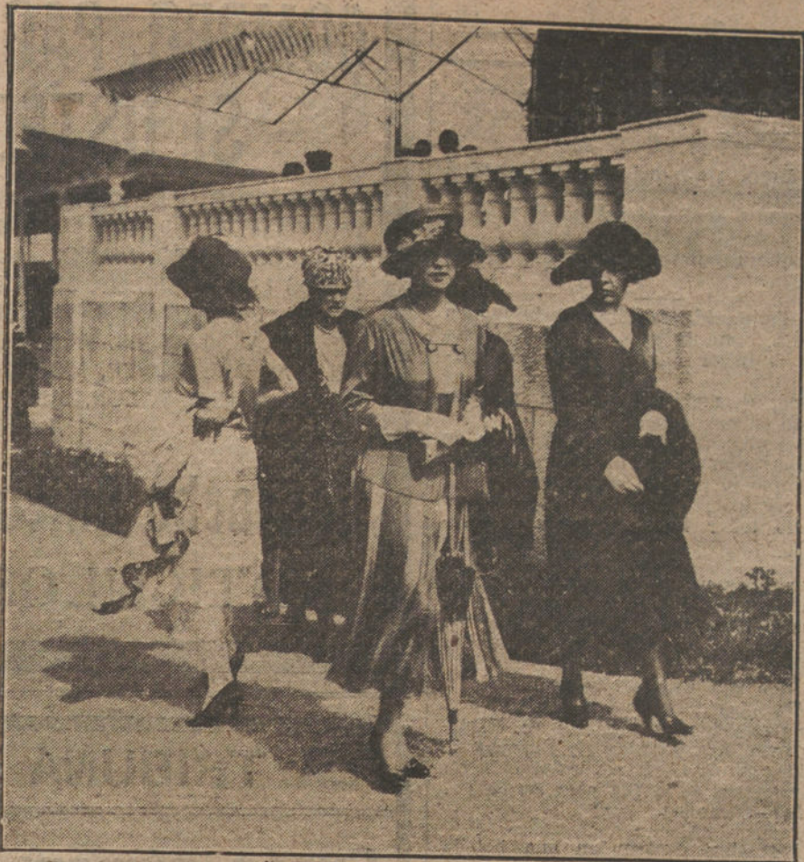
EL VERANO EN SANTANDER. Grupo de elegantes paseando por el «stand» del Hipódromo de Bella Vista, durante las carreras de caballos.

Las sillas de hierro que tanta importancia tenían en esa parte que era el «salón» del Prado, hoy están también más arrinconadas, se destacan ya como en un gran almacén vacío; pero así las ve, siguien. Son esas sillas que hicieron los pantalones, que se agarran á nuestra americana cuando nos vamos á levantar, que á veces se abren y se desarticulan. Sólo unas cuantas ancianas se sientan aún en ellas, maneñándolas como sillas de tijera de iglesia, y se establecen en ellas como en las de su gabinete. Ya se desechan pocos billetes de sillas, y esos billetes son ya distintos á aquellos de entonces, que recuerdo que tenían detrás el anuncio de las máquinas «Singer» con un grabado en que figuraba una señorita de mangas de jamón sentada á la máquina.