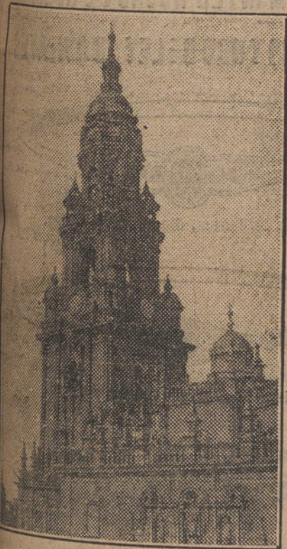
La torre de la Trinidad, en Santiago de Compostela.

En una población, como Santiago, donde la ciencia química está tan des- arrollada y donde tanto abundan los buenos laboratorios, tener fama de competente en tales materias es ya un gran triunfo.