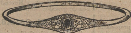
Núm. 3.—Cuatro brillantes, diamantes y zafiro. Pesetas 275.