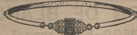
Núm. 5.—Diez brillantes, diamantes y zafiro. Pesetas 350.