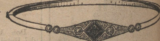
Núm. 4.—Seis brillantes, diamantes y zafiro. Pesetas 300.