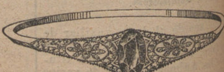
Núm. 8.—4 brillantes, diamantes y zafiro. Pesetas 425.