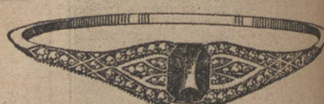
Núm. 6.—Seis brillantes, diamantes y zafiro. Pesetas 390.