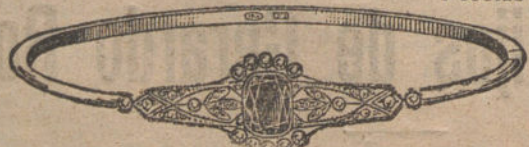
Núm. 7.—Catorce brillantes, diamantes y zafiro. Pesetas 400.