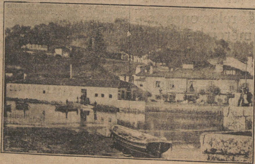
NOYA. Vista de la fábrica «La Noyesa».