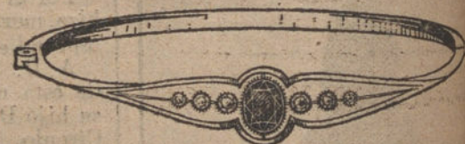
Núm. 2.—Ocho brillantes, diamantes y zafiro. Pesetas 230.