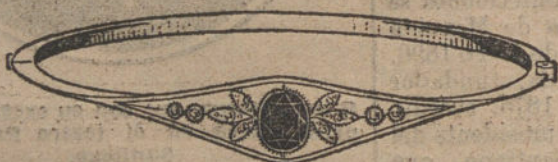
Núm. 1.—Cuatro brillantes, diamantes y zafiro. Pesetas 225.

CON BRILLANTES DE PRIMERA CALIDAD :: :: DIAMANTES ROSAS DE HOLANDA ZAFIROS FINOS GARANTIZADOS. MONTURAS DE PLATINO FINO Y ORO DE LEY 18 KILATES