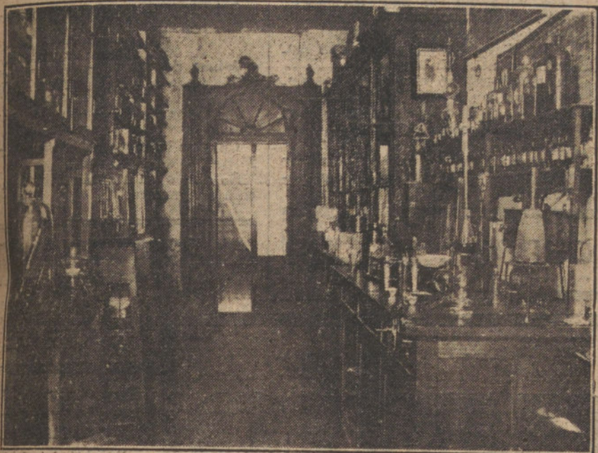
Laboratorio de los señores Bescansa é Hijo.

antiosa y en condiciones de compe- ar con los más afamados de España, que si alguna vez los igualan en pre- cio, nunca se les aproximan en estética y solidez. La silla torneada, de diversas for- mas, es otra de las especialidades de esta casa, sita en Gelmírez, II, y Canga, 9.