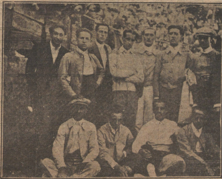
Grupo de jóvenes, que tomaron parte en la bacerrada benéfica, organizada por la colonia veraniega de El Escorial.