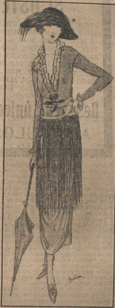
Elegante traje de seda pintada.

la única nota culminante es la grande y negra cazuela que humea, más ó menos sabrosa, á la caricia de la brisa... Y pasito á paso, penetré por fin en el cementerio de la Patriarcal de San Martín.