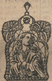
Núm. 8.—3 brillantes y diamantes, imagen de nácar. Ptas. 500.