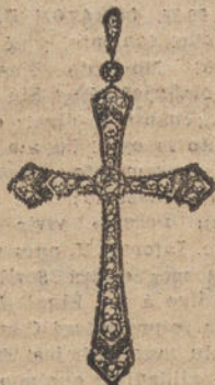
Núm. 6.—2 brillantes, diamantes y onix fino. Ptas. 275.