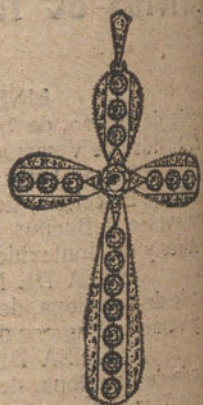
Núm. 17.—17 brillantes y diamantes. Ptas. 650.

Factura de garantía en todas las compras