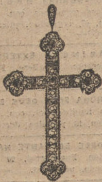
Núm. 4.—14 brillantes y diamantes y onix fino. Ptas. 450.