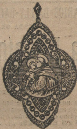
Núm. 14.—16 brillantes y diamantes, imagen de nácar. Ptas. 675.