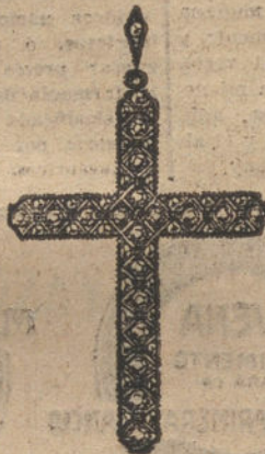
Núm. 11.—20 brillantes y diamantes. Ptas. 500.