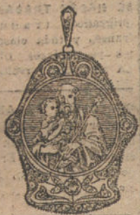
Núm. 1.—5 brillantes y diamantes, imagen de nácar. Ptas. 275.

MONTURAS DE PLATINO FINO Y ORO DE LEY 18 QUILATES CONTRASTADO