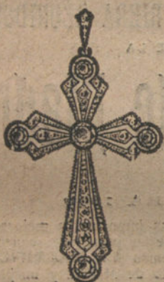
Núm. 13.—5 brillantes y diamantes. Ptas. 575.