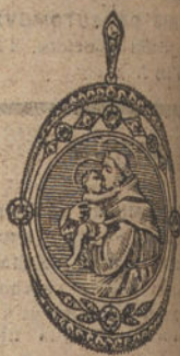
Núm. 7.—6 brillantes y diamantes, imagen de nácar. Ptas. 275.