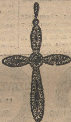
Núm. 9.—1 brillante, diamantes y onix fino. Ptas. 375.