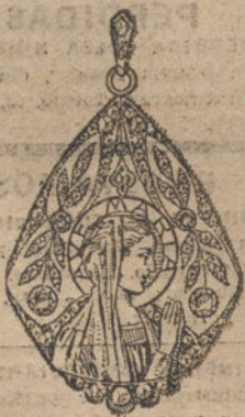
Núm. 3.—5 brillantes y diamantes, imagen de nácar. Ptas. 455.