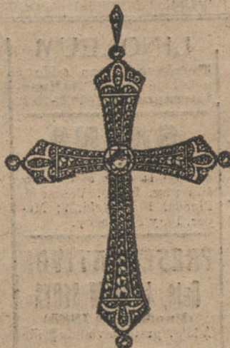
Núm. 15.—5 brillantes y diamantes. Ptas. 800.