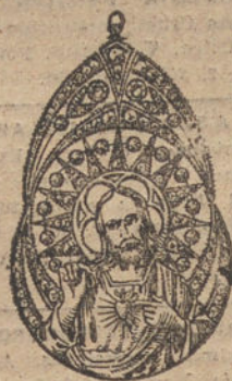
Núm. 5.—16 brillantes y diamantes, imagen de nácar. Ptas. 475.