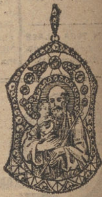
Núm. 12.—7 brillantes y diamantes, imagen de nácar. Ptas. 550.