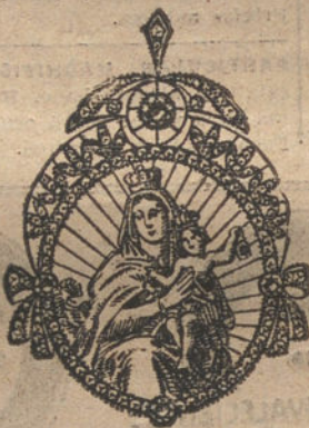
Núm. 10.—6 brillantes y diamantes, imagen de nácar. Ptas. 600.