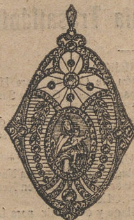
Núm. 16.—19 brillantes y diamantes, imagen de nácar. Ptas. 750.