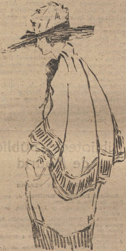
Abrijo cuello de verano, última creación parisina. (Dibujo de Ivan Iscar.)

Unos momentos me detuve para examinar á sus moradores, todos con caras sonrientes, dichosos, en aquel ambiente donde la vida flota con la esperanza de lo inacabable, tal es la profusión de niños, que, como abejas, agrúpanse en torno de las casucas de Vallehermoso. Allí todo tiene un hálito de sonriente, de feliz despreocupación por el futuro «mañana», que se espera sin entusiasmos ni ambiciones... Allí,