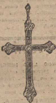
Núm. 2.—1 brillante, diamantes y onix fino. Ptas. 250.