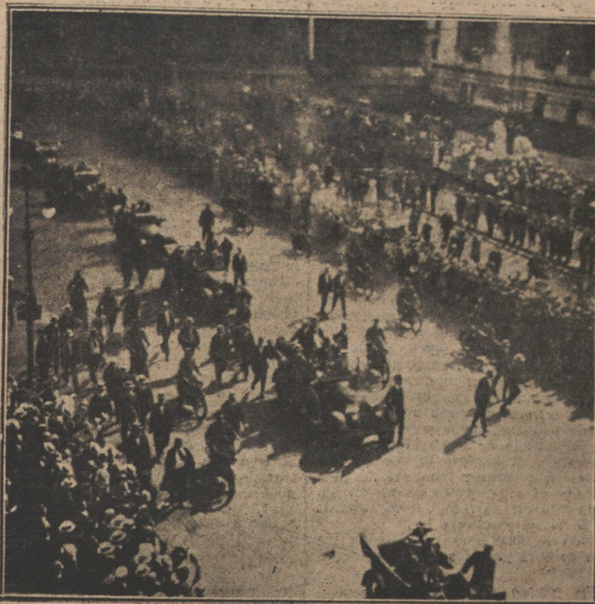
REGRESO DEL PRESIDENTE WILSON A LOS ESTADOS UNIDOS.—La comitiva a su entrada en Nueva York.

Sin apasionamiento, limpios de resabios partidistas, atentos únicamente al público interés, gobernaron un tiempo breve, y ahí está la obra de Fomento, por ejemplo, erigida por el Sr. Cambó, como lo más sólido y lo más inco-