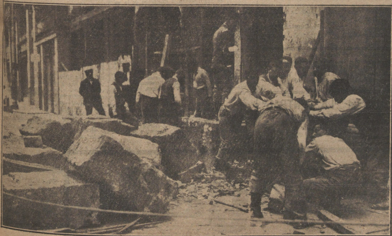
El Cuerpo de bomberos, derribando la valla de la calle de Cedaceros, asunto que había ocasionado al vecindario de Madrid.

Entre los firmantes figuran los nombres de los conocidos literatos Anatole France y Henri Barbusse.