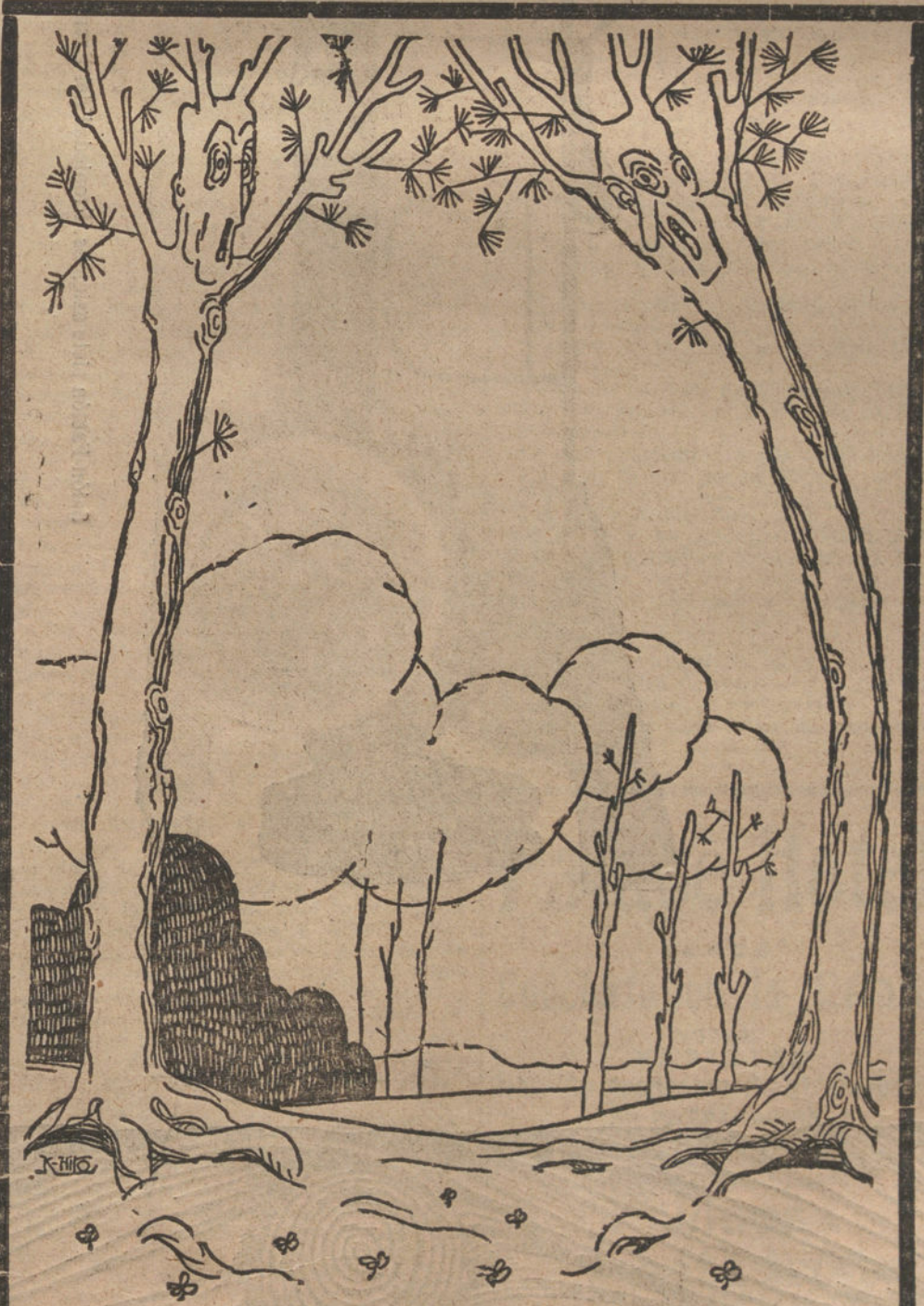
POR METERSE EN POLITICA

Tal es el índice de la primera parte; la segunda trata de la regeneración de ese tipo social español. Sin tiempo para tratar tan vastas cuestiones, sólo me ocurre aquí preguntar: ¿Pero es regenerable tipo tan repugnante, tan ruin, tan despreciable? Porque los españoles resultan, del estudio de la primera parte, que no hay por dónde cogerles. El español es un saco de malicias, un cuero henchido de vicios, que Dios echó en el peor rincón del mundo. No veo medio de hacer ni mediana tan mala ralea. Pero se me ocurre una cosa. No hay más que charlar diez minutos con el autor para quedar uno persuadido de que es un caballero a carta cabal. Es Rui-Mar, valiente, de finísimo trato, posee un corazón grande y rico de nobles sentimientos, tiene inteligencia despejada, imaginación florida, depa-