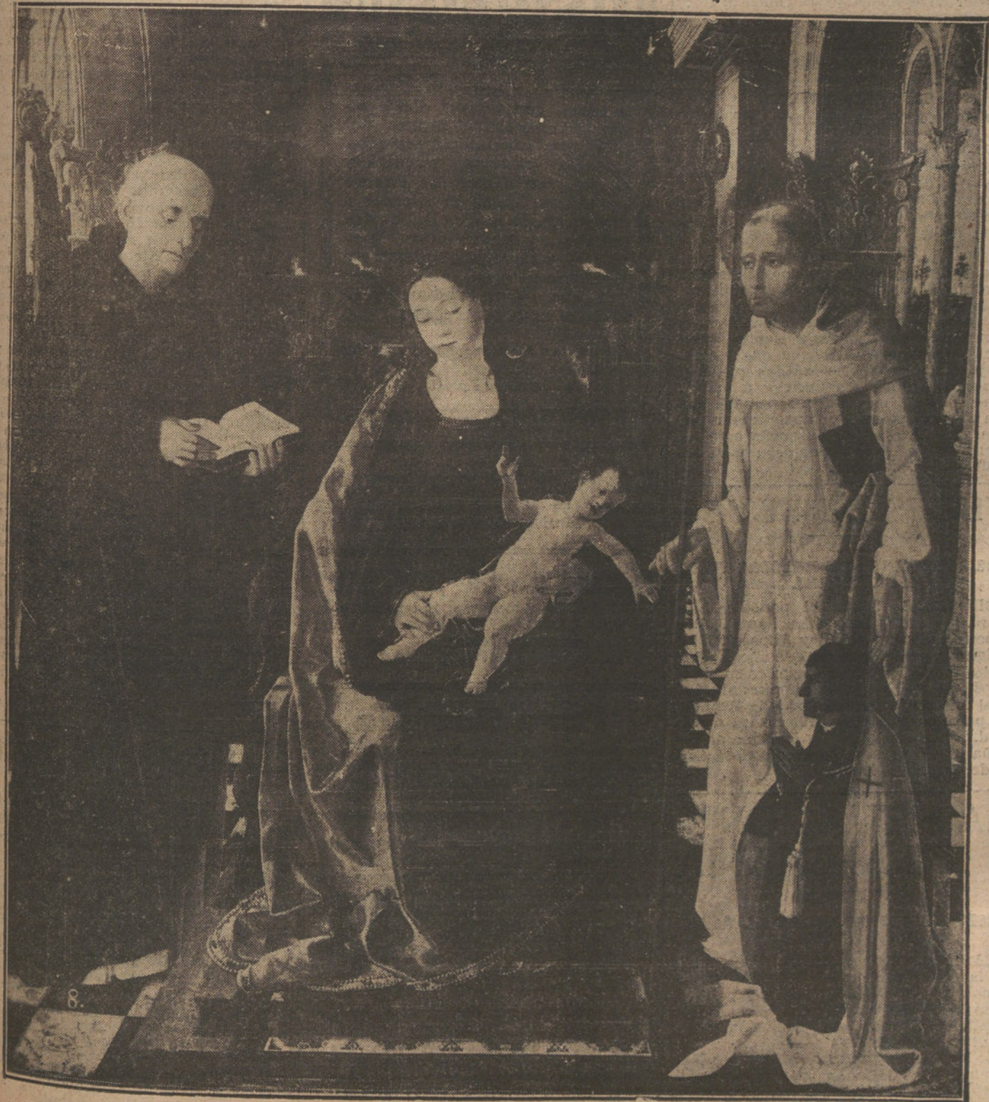
La famosa tabla atribuida á Rodrigo de Osona, que acaba de ser instalada en nuestro Museo Nacional.