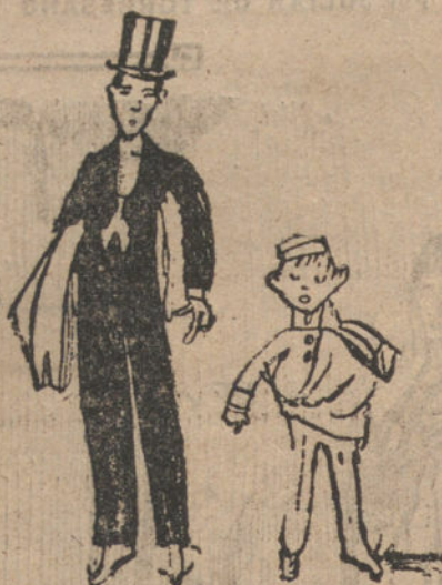
LLAPISERA Y EL BOTONES, por Joaquín Vázquez (doce años).

po bonito. Si durante su existencia des- pliegan una gran voluntad y una energía considerable, llegarán a ser di- chosos.