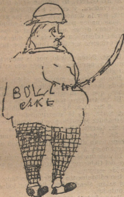
UN BOLCHEVIRI, por Manuel Bermúdez (seis años).

Las personas que nazcan en esta época del año tendrán, generalmente, un cuer-