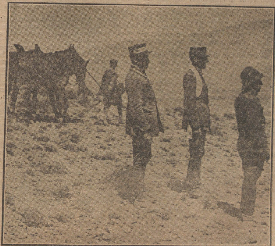
FRANCIA Y ESPAÑA EN AFRICA.—El general francés Aubert y el general es- pañol Aizpuru, presenciando el desfile de las tropas en la posición de Masi Uns. ga.

RIO JANEIRO. El Aero Club brasile- ño ha votado un premio de 60.000 pesos para unirlos al de 500.000 pesetas que vo- tó el Gobierno portugués para el primer aviador que haga la travesía aérea de Lisboa á Río Janeiro.