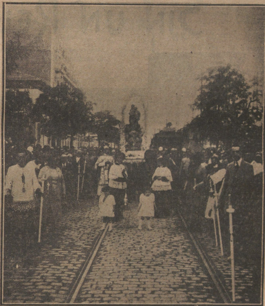
LOS FESTEJOS DE LOS CUATRO CAMINOS.—Procesión celebrada ayer tarde, con motivo de la verbena de Nuestra Señora de los Angeles.

dos de las vías digestivas, y entre ellos las infecciones colibacilares y eberthianas. También se han observado congestiones y hemorragias de los centros nerviosos.