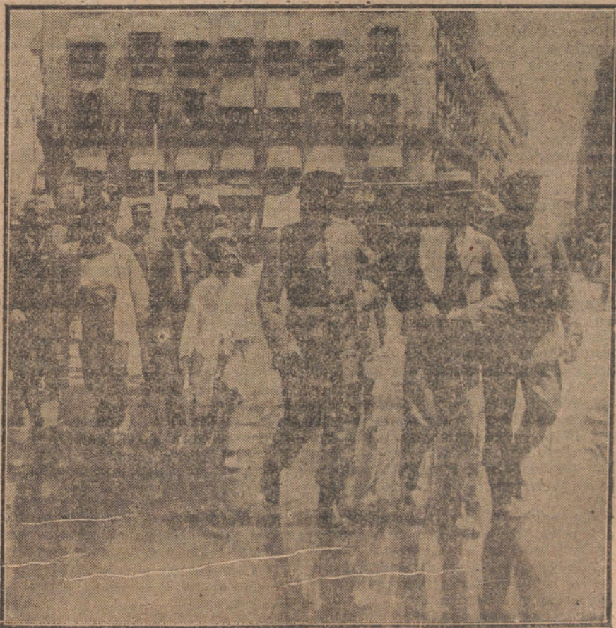
LA MANIFESTACION DE ESTA MAÑANA.—Detención de uno de los manifestantes durante el incidente ocurrido en la calle de Sevilla.

Primera. Hasta la votación definitiva, caso de poderse realizar seguidamente, ningún otro asunto será tratado durante las horas dedicadas al orden del día en cada sesión, a reserva de aumentarlas con prórrogas o sesiones extraordinarias.