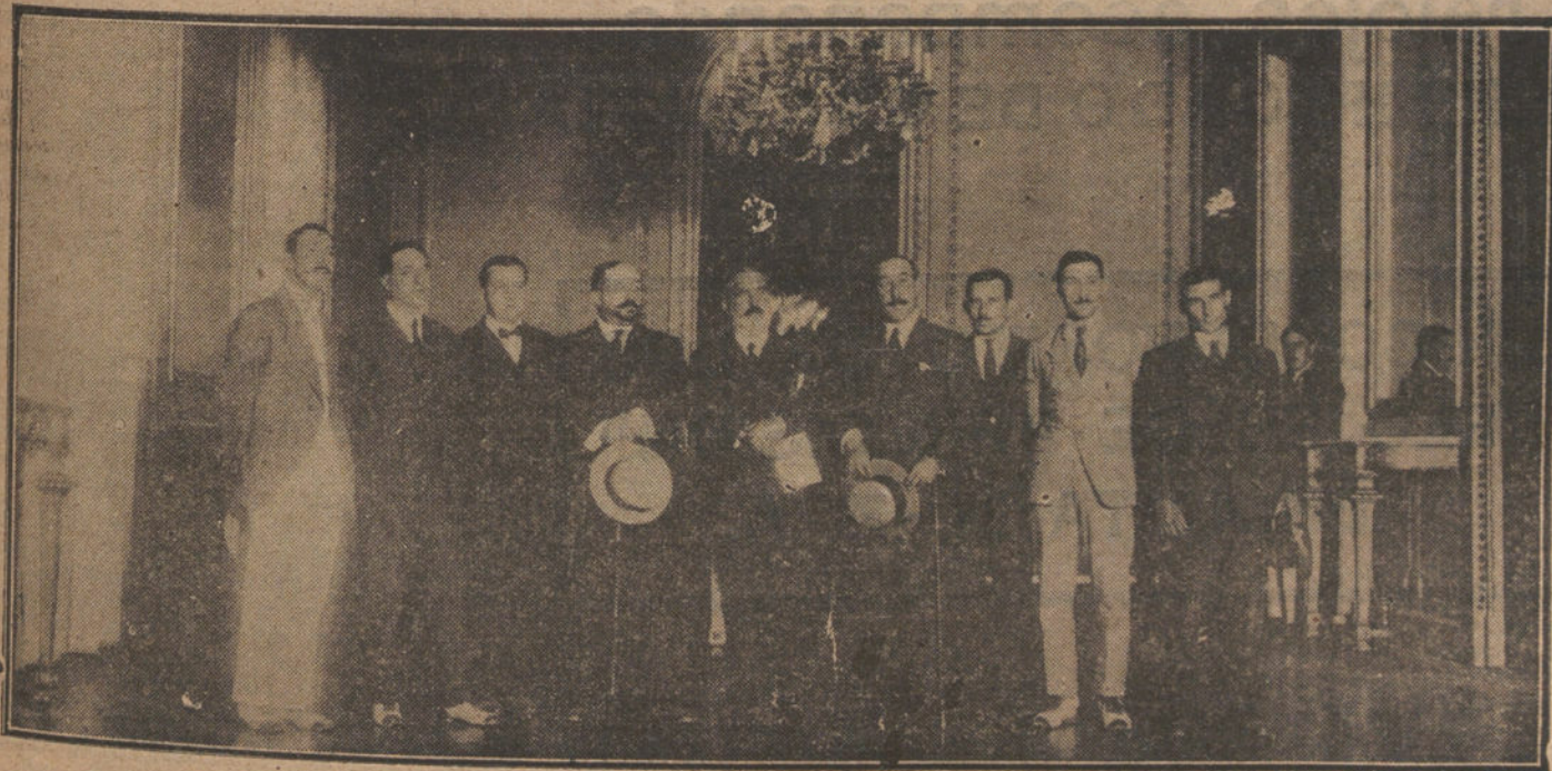
La Comisión de socialistas al hacer entrega al subsecretario de la Presidencia de la petición de indulto.

Lo triste es que no exista una pronda igualmente codiciable por izquierdas y de rechas.