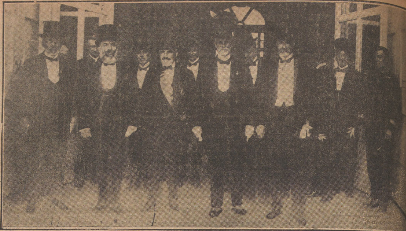
La Comisión de canadores, saliendo de Palacio, después de entregar á Su Majestad la contestación al Mensaje.

Estas manifestaciones, oídas por nosotros á una alta personalidad que ha tenido intervención directa en el esclarecimiento del hecho, nos induce á creer que se ha concedido una importancia al caso, que, en realidad, no tenía.