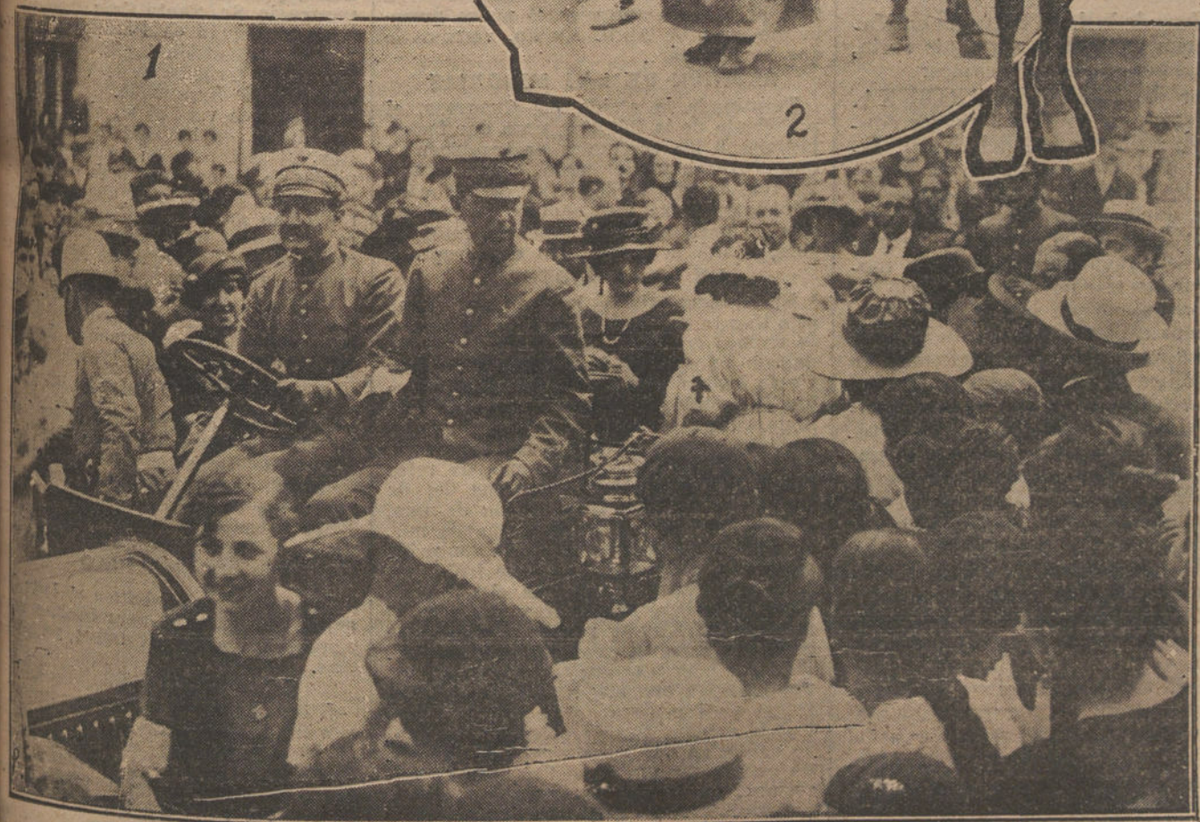
LA FIESTA DE LA FLOR EN SANTANDER.—Núm. 1: El automóvil de Su Majestad la Reina Victoria, rodeado de público. Núm. 2: Un detalle minorista de la fiesta.

presupuesto por que aboga el Sr. La Cierva solamente podría regir en el primer trimestre del año 1920, y la Intervención general de la Hacienda se encontraría con que tenía que ajustar cuentas con arreglo á un régimen de dozeavas partes y á otro de un trimestre de un nuevo presupuesto; para tener que aplicar otro nuevo régimen desde el mes de Abril en adelante.»