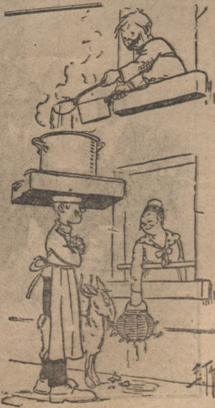
«El amor es ciego». (Del «Pele-Mé».)

a la influencia francesa: los búlgaros, los húngaros y los alemanes. Los dos primeros ya no son un factor importante; su territorio se va a reducir a las más pequeñas dimensiones posibles, y su situación económica ha de ser tal que no serán capaces de desarrollar las pocas fuerzas que les quedan.