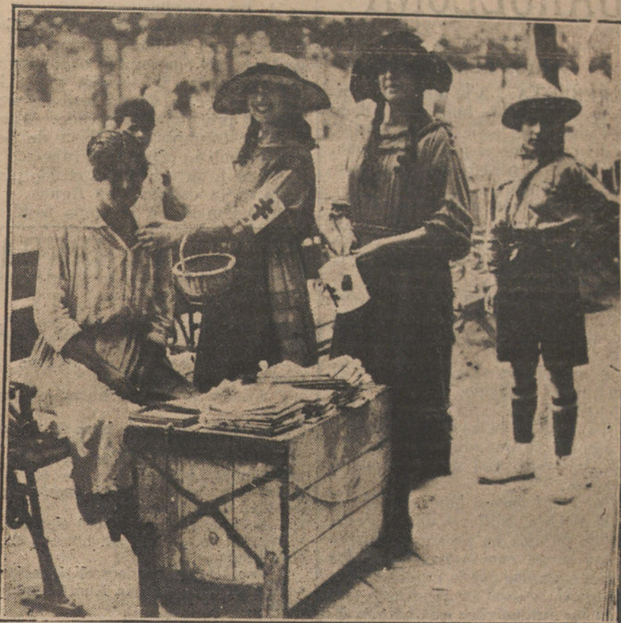
En la fiesta de la flor en Santander. — Dos bellas posuantes, colocando flores a una vendedora de periódicos.

No se puede negar al Gobierno una tregua para preparar su obra económica. No hacerlo así, equivaldría á crear una honda perturbación, ya que el