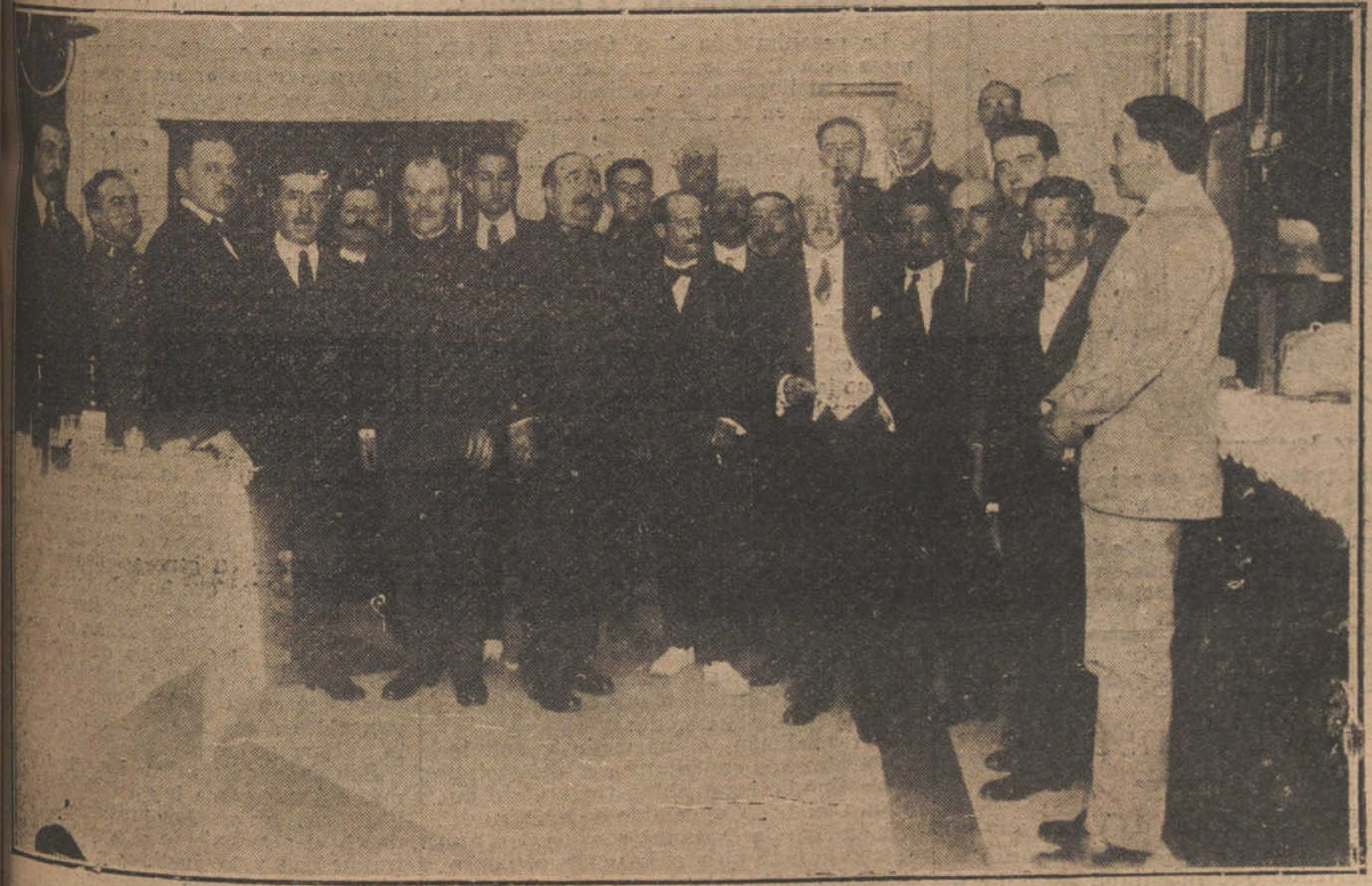
El ministro de la Guerra, después del almuerzo que ofreció ayer a los periodistas que hacen información en dicho departamento, al recibirlos por primera vez.

En la estación de Belver Vila se produjo un choque entre huelguistas y tropas del Ejército, cruzándose inmensos disparos y huyendo los primeros.