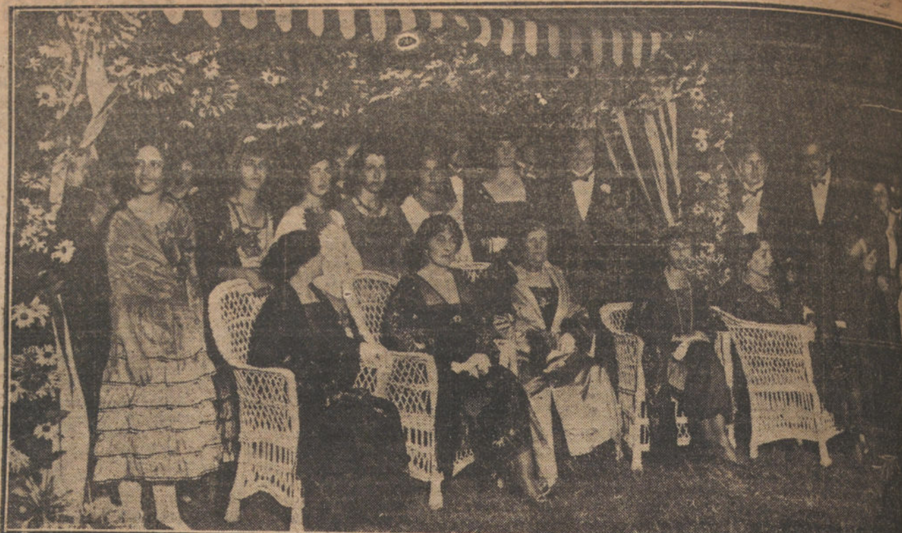
EL VERANO EN SANTANDER.—Verbena aristocrática celebrada en el campo de «tennis» á favor de la Gola La Reina Doña Victoria, con varias aristócratas concurrentes.

BRUSELAS. Han empezado los trabajos de restauración de las famosas esclusas de Neuport. Estas seis esclusas fueron las que permitieron en Octubre de 1914 extender la inundación delante de las tropas belgas, limitando de modo definitivo la marcha de los alemanes sobre Dinqueque. Los trabajos serán largos y considerables, porque es preciso, además de la reconstrucción de las esclusas, expulsar el agua, por medio de poderosas bombas, de las praderas del bajo Flandes, que han estado inundadas durante cuatro años.