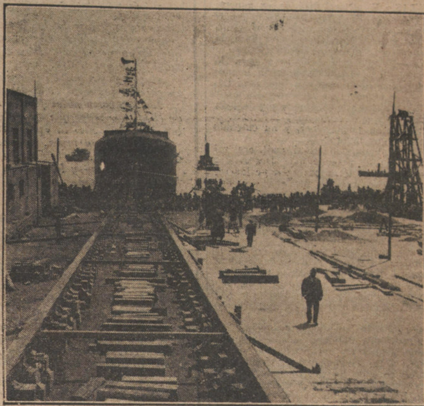
Vista parcial de los magníficos astilleros Cardona, en el instante de ser lanzado al agua el vapor «Odesa», una de las mejores y más importantes construcciones de la industria nacional.

Estos ejemplos los sacamos á la luz pública para que el país vea y conozca á los hombres que laboran en silencio y contribuyen al fomento de la riqueza nacional con su riqueza, con su voluntad, con su pericia, con su perseverancia y con su talento.