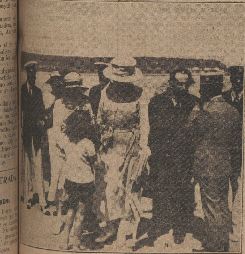
VERANO EN SANTANDER.—Una niña, entregando un ramo de flores a su abuela, a su llegada al Sanatorio antituberculoso de Pedrosa.

Se ha vuelto a publicar el periódico «A Batalla», órgano principal de los bolchevikistas portugueses.