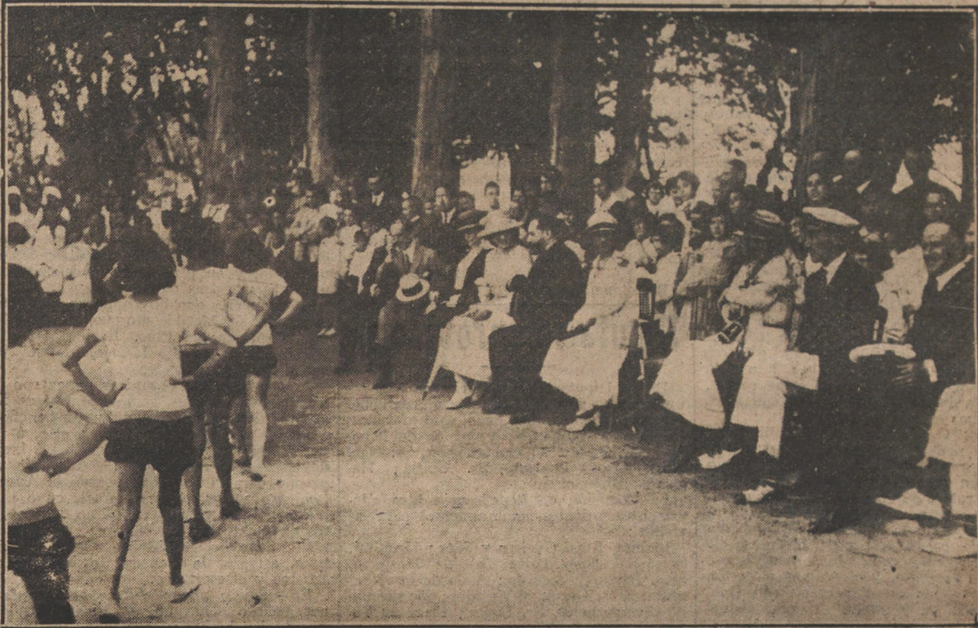
EL VERANEO EN SANTANDER.—Su Majestad la Reina Victoria presenciando los ejercicios de gimnasia rítmica, en el Sanatorio de Pedrosa.

Es inútil llamar a la cordura, porque el Parlamento no parece estar en su cabal juicio. De otra forma, todos hubieran dado cuenta de que el día 15 será imponente el trastorno causado a la Administración pública si no está