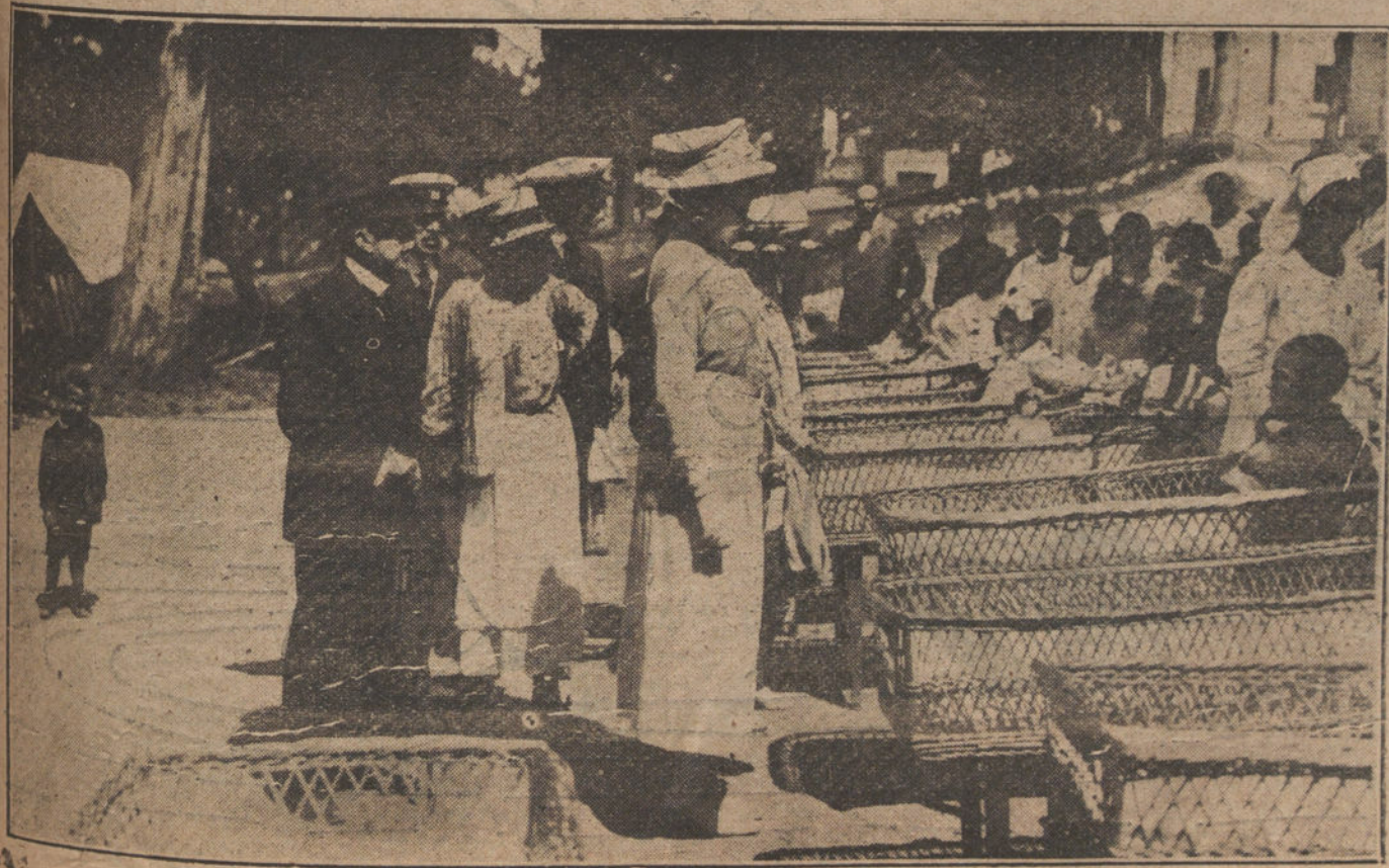
EL VERANEO EN SANTANDER.—Su Majestad la Reina Victoria, en el Sanatorio de Pedrosa, conversando con los enfermitos, al tiempo de tomar éstos los baños de sol.

Los efectos de estos organismos han sido muy felices y han provocado en la población una reacción que atemorizará, sin duda, a los comerciantes desaprensivos y contribuirá poderosamente a hacer desaparecer el alza artificial creada sobre los precios de los artículos de primera necesidad.—Radio.