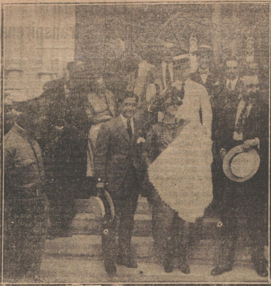
Bautizo de la primogenita del diestro Belmonte, verificado esta mañana en la iglesia de la Concepción.

LONDRES. A las once de la mañana celebrará una reunión, hoy, la llamada Triple Alianza, en Londres, en el cuartel general del Sindicato de ferroviarios—Railwaymen's Union.