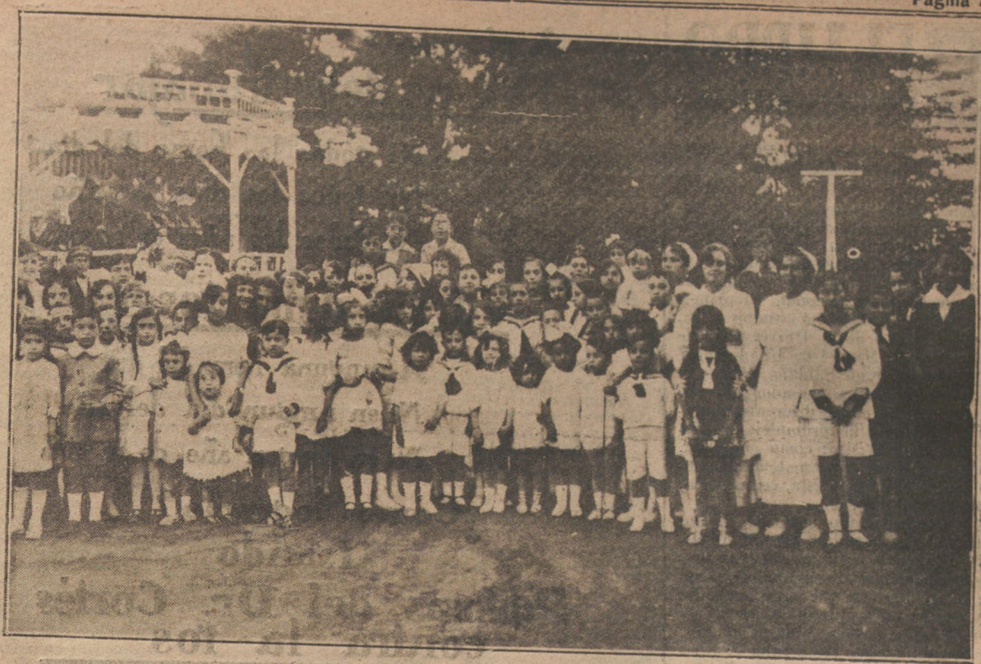
LAS FIESTAS DE EL ESCORIAL.—Un detalle del festival infantil, verificado en el Parque de Alfonso XIII