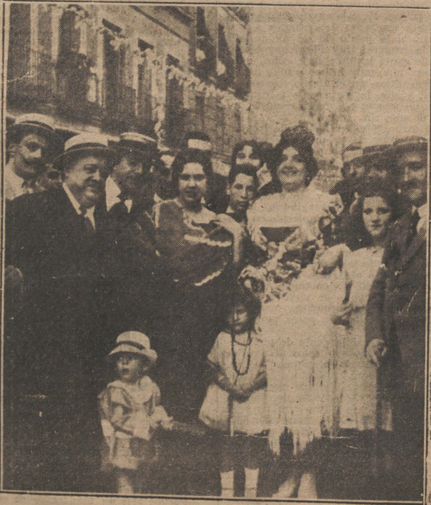
LA VERBENA DE SAN LORENZO.—Los dos primeros premios del concurso de mantones, verificado ayer.

Numerosos huelguistas vienen a decir, se voluntariamente, mediante la proteccion de los intereses obreros, pero sin pretensiones exageradas. En la cuestion de la reconstruccion dependemos de la Entente, y es necesario llegar a un previo acuerdo con Francia. Lo mejor seria una accion comun de los Sindicatos franceses y alemanes para obtener condiciones de trabajo apropiadas. La reconstruccion constituye un interes comun francoaleman y hasta europeo. Si los obreros alemanes lo comprenden, resultará de ello una aproximacion francoalemana.—Radio.