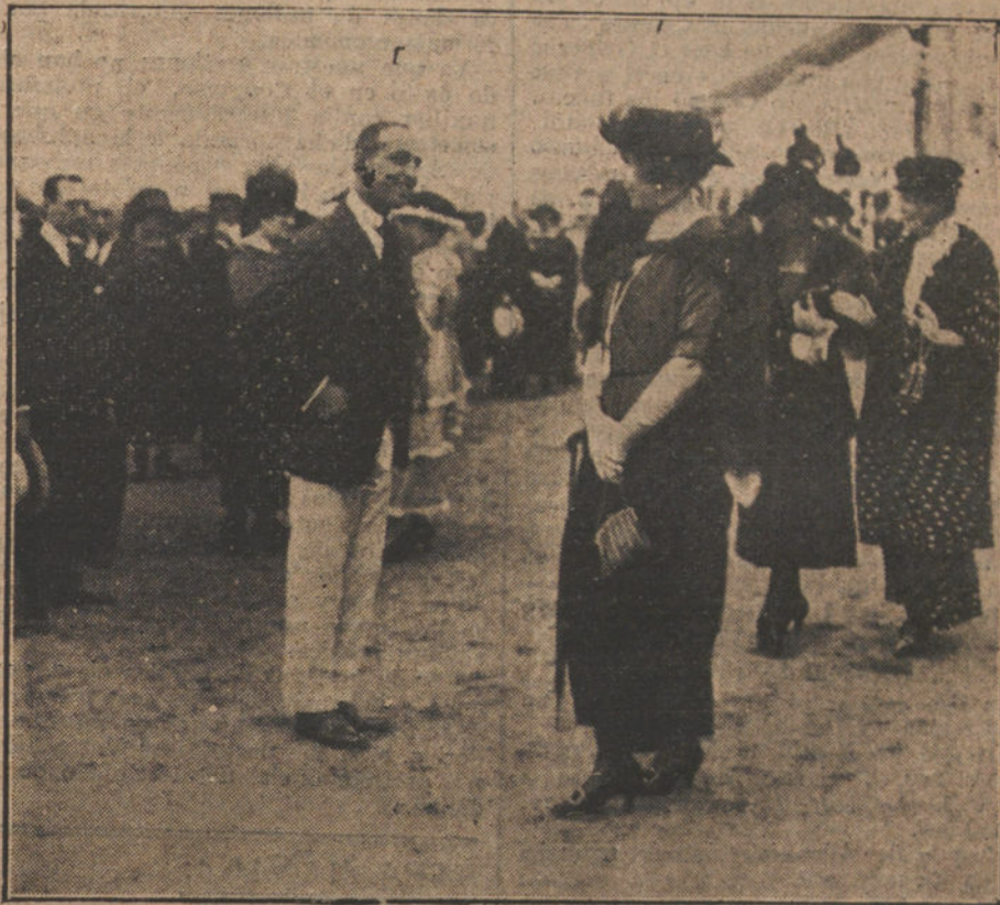
EL VERANE EN SANTANDER. Su Majestad la Reina Victoria, conversando con aristócratas santanderinos, durante las carreras de caballos, celebradas últimamente.

Una de tantas habilidades para vencer una situación difícil y devolvernos a las inquietudes de los meses pasados. Las izquierdas habrían contribuido momentáneamente a esa nueva perturbación, y el Gobierno actual habría hecho una