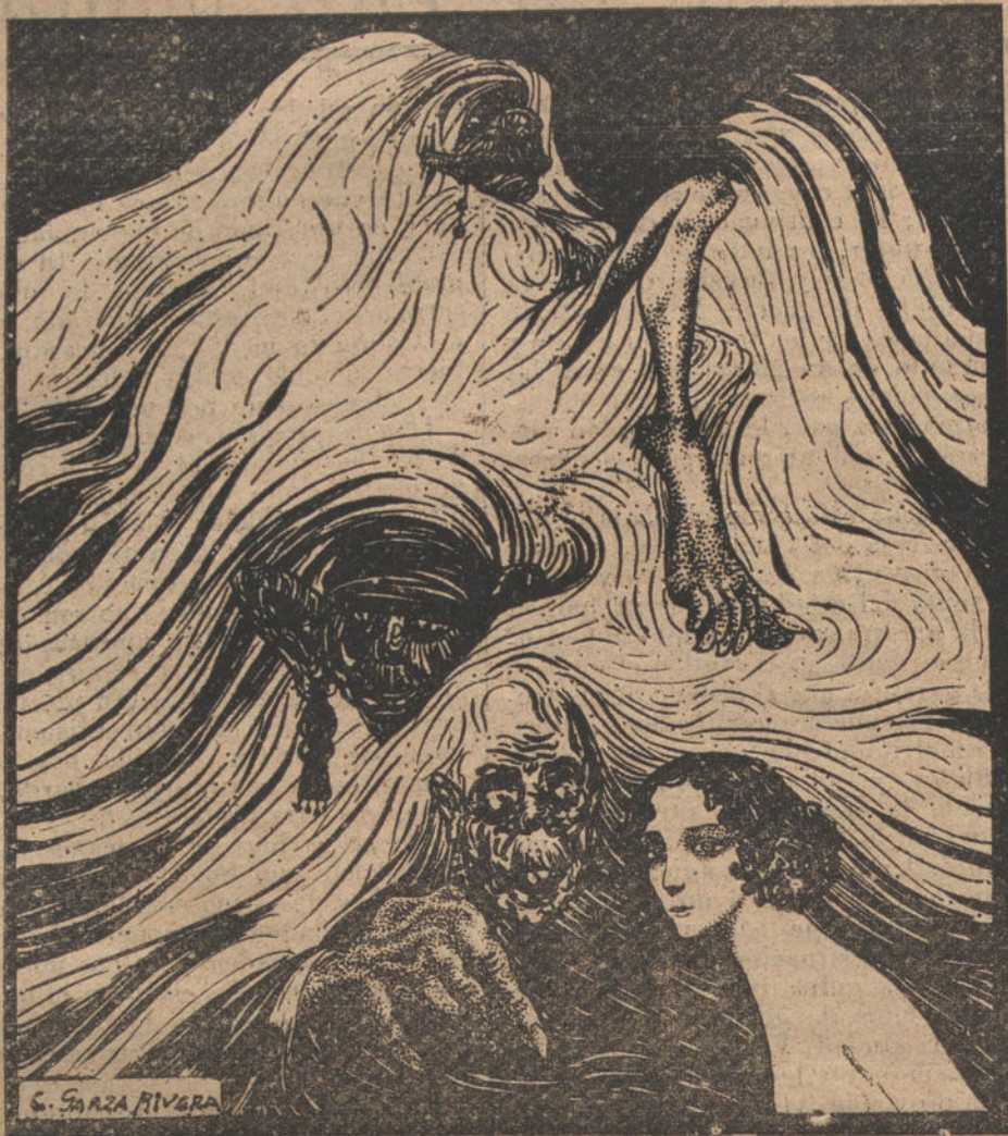
C. SAZZA RIVERA