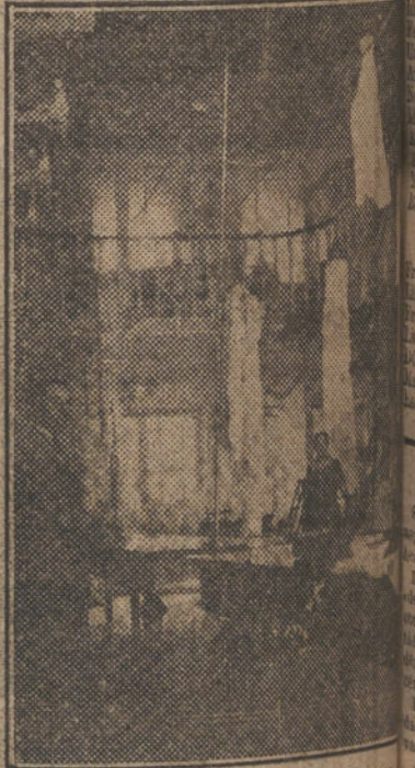
LA ESPUMA.—Un interior del establecimiento.