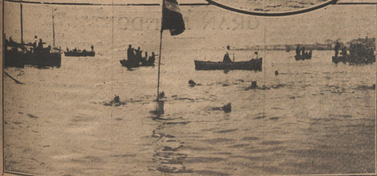
EL VERANE EN SANTANDER.—En el óvalo, grupo de nadadores, que han tomado parte en el concurso de natación. Dehíjo, los nadadores, en el momento de dar la vuelta a la boya.

mentable papel de celestina para preparar la «caída» del partido conservador.