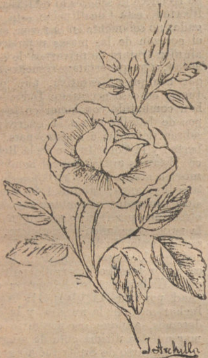
Por J. Archilla Hila (trece años).

Según las advertencias de la Magia Negra, deberán de confiar de los incendios y del agua caliente.