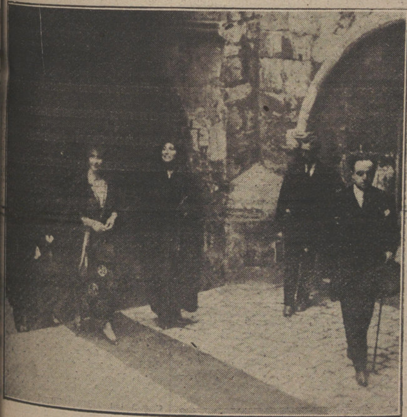
VERANO EN SANTANDER.—S. M. la Reina Victoria, acompañada de S. A. la Duquesa de Alba, al llegar á la catedral para oír la misa anual del Ropero de Santa Victoria.

El acierto de los pasados días es la mejor garantía de los días futuros. ¿Qué significa la fórmula económica sino un trabajo de habilidad, de inteligencia y de colaboración? Con que las nuevas leyes estén hechas en los mismos patrones parlamentarios, bastará para que el país tenga sus presupuestos en el próximo año, sin necesidad de cambios políticos ni Gobiernos de concentración, esa concentración apesada, que de tan manoseada y tan agitada repugna ya hasta á los propios partidarios de ella.