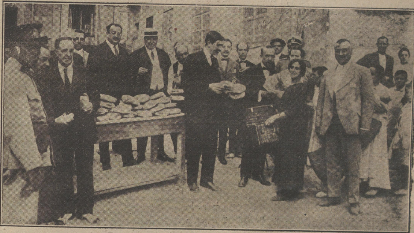
El alcalde de Madrid presidiendo el reparto de bonos á los pobres, verificado ayer con motivo de las fiestas de la Virgen de la Paloma.

emprender, era, ante todo, pacificar el país, normalizar la vida pública, desencanada y perturbada por la frenética vesania de los anteriores ministros; juntar las voluntades de los grupos parlamentarios, tan dispersas y antagónicas y hostiles que hacían imposible toda obra de concordia. Conseguir eso era bastante más difícil que sacar á flote la fórmula económica, porque equivalía á preparar el campo donde se habría de echar la simiente que fructificase en los próximos presupuestos. Se han acabado ya, no en España, sino en todo el mundo, los presupuestos sectarios, esos presupuestos que representaban la esencia política de un partido y con los cuales sólo el partido afín podía gobernar. Los presupuestos de ahora—repetimos que en todo el mundo—son leyes liberales, de una gran amplitud y de una elástica transigencia política. Y para eso, no hace falta, no es imprescindible esa mayoría compacta y rutinaria, del «sí» y el «no» al dictado, que quieren los periódicos cervistas, sino muchas mayorías convencionales, entresacadas de todos los grupos.