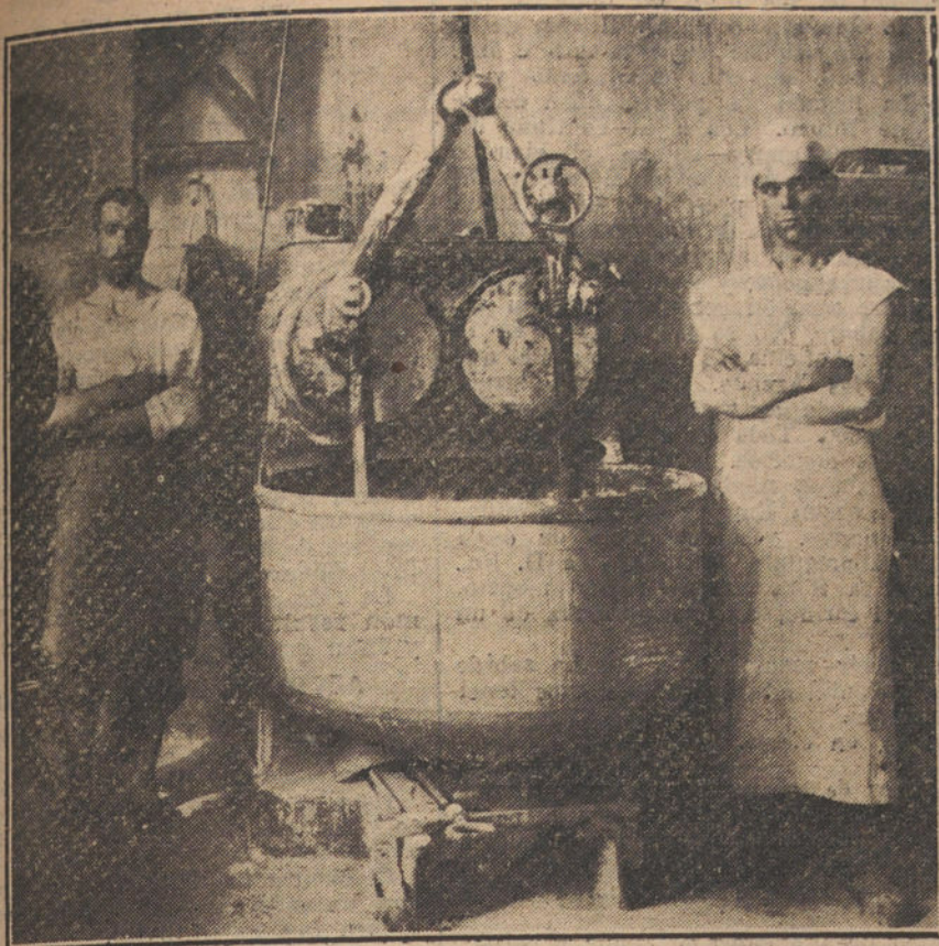
Moderna amasadora de pan de Viena, modelo suizo.

con los adelantos, sería necesario hacer grandes desembolsos, que no pueden hacerse, porque vivo de precario. Para establecer la jornada diurna, sería necesaria la instalación de cámaras frigoríficas para que el día antes se deje hecha la masa, y al siguiente no haya que hacer más que trasladarla de la cámara frigorífica a la de fermentación, para que inmediatamente que se inicie el punto pasar a cocer. Añadido que los dueños de la mayoría de los locales no consentirían la instalación de las cámaras. También se solucionarían empleando levaduras químicas para que las masas fermentaran con rapidez.