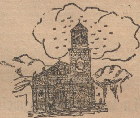
PARROQUIA DE MANCHA REAL (JAEN) Y VISTA DE LA CALLE MAESTRA, por Alfredo Torregrosa Valverde (trece años).

Cardos como ensalada.—Basta cocerlos dejándolos enfriar y aderezándolos con aceite y vinagre.