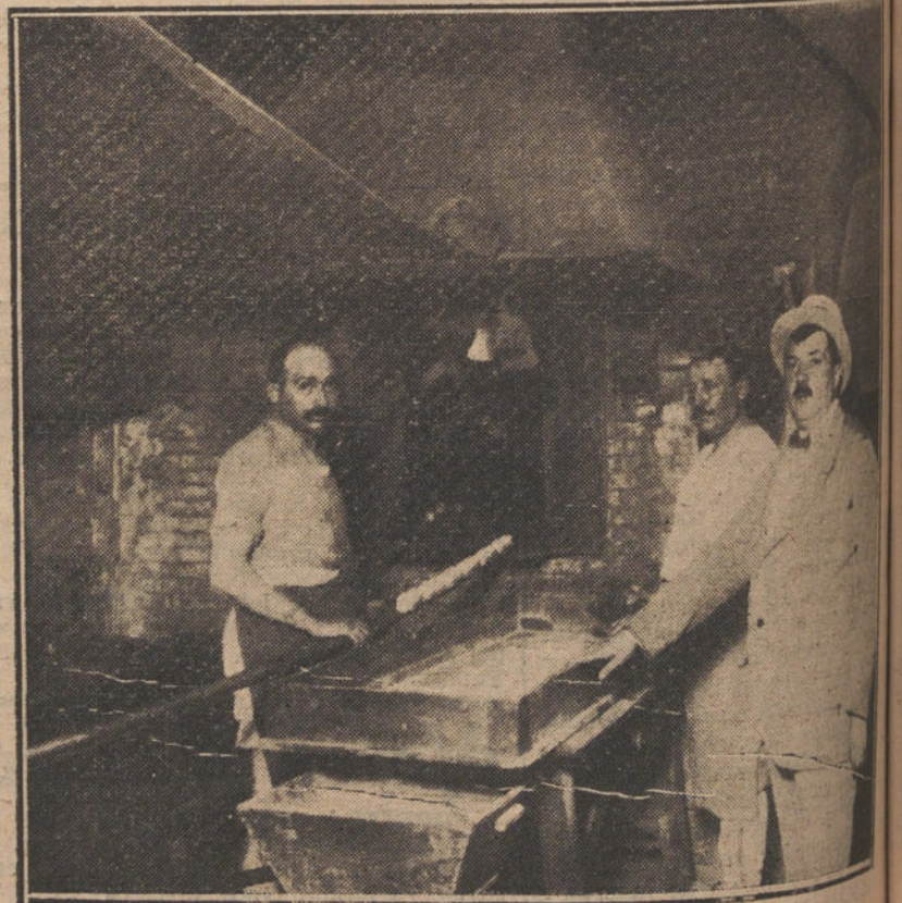
Obrero trabajando en la confección del pan francés.

—Pues muy sencillo. La industria panificadora española hay que reconocerla está atrasada, y para ponerla en