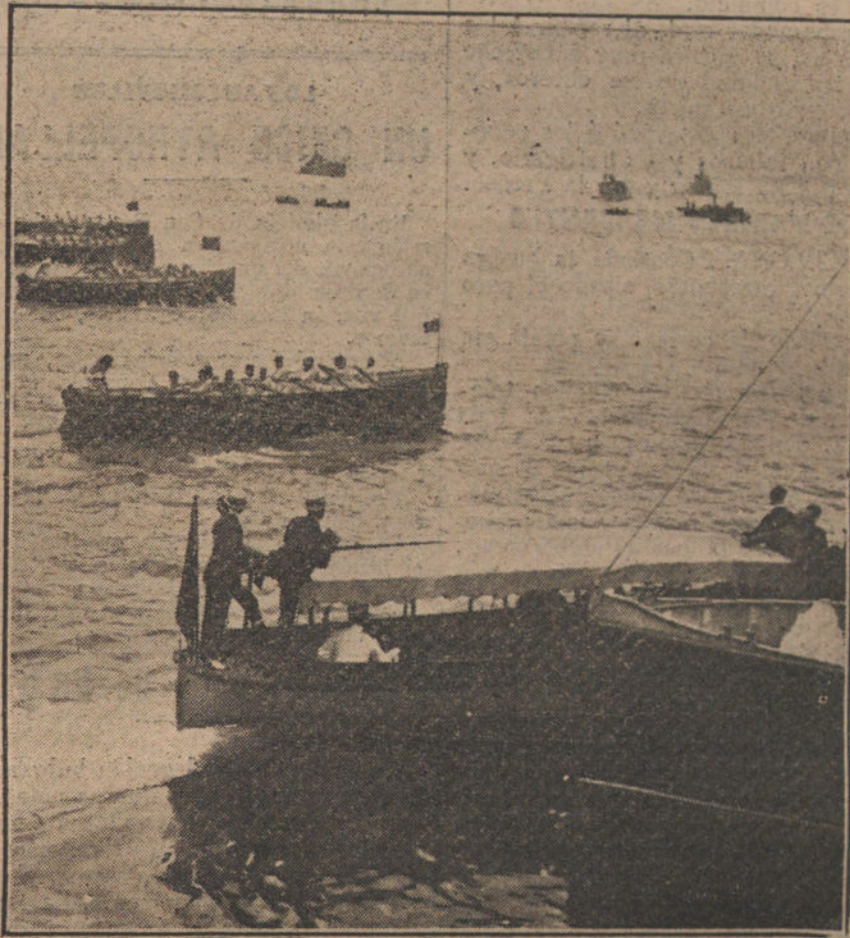
EL VERANO EN SANTANDER.—Regatas de botes, tripulados por marinos de la escuadra. Llegada á la meta del bote ganador.

BARCELONA. Amparándose en la carestía del trigo, los panaderos han