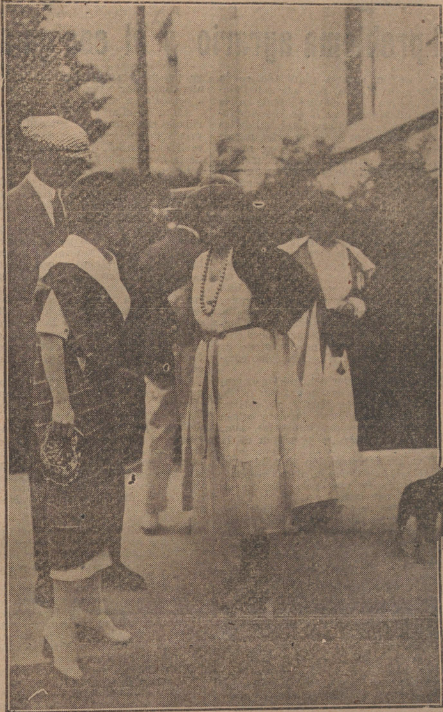
Nueva aplicación de la moda de no llevar medias.