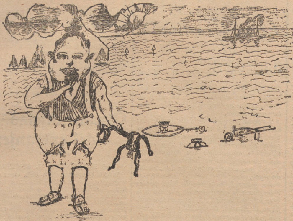
HOROSCOPOS DE AGOSTO