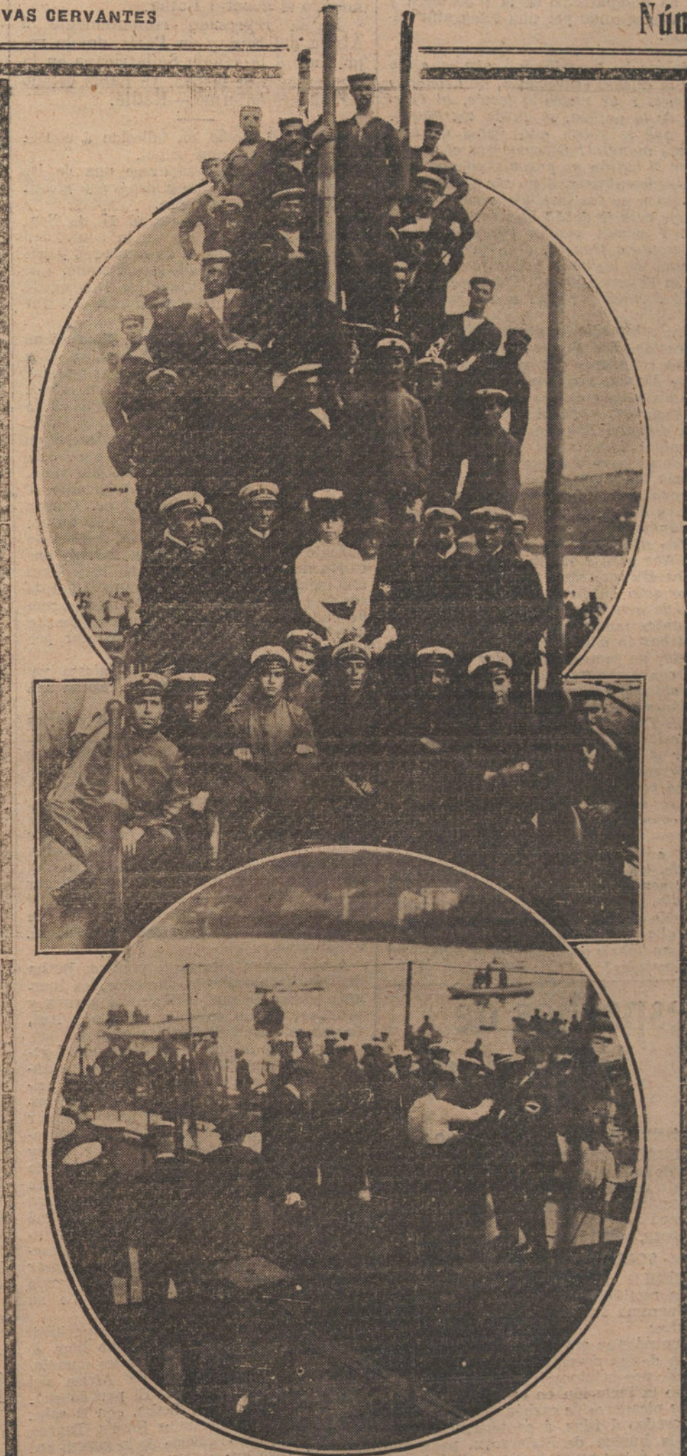
SU MAJESTAD LA REINA CRISTINA, DURANTE SU VISITA A LOS SUBMARINOS ESPAÑOLES, EN EL PUERTO DE SAN SEBASTIAN.—Su Majestad rodeada de la tripulación del submarino «A 2».—La Reina en el momento de entrar en el submarino «A 1», acompañada del comandante del mismo.

Para que el presupuesto tenga carácter nacional, no basta con que ese sea el deseo del Gobierno. El deseo necesita estar estimulado por la necesidad. Solo cuando un Gobierno se vea en el