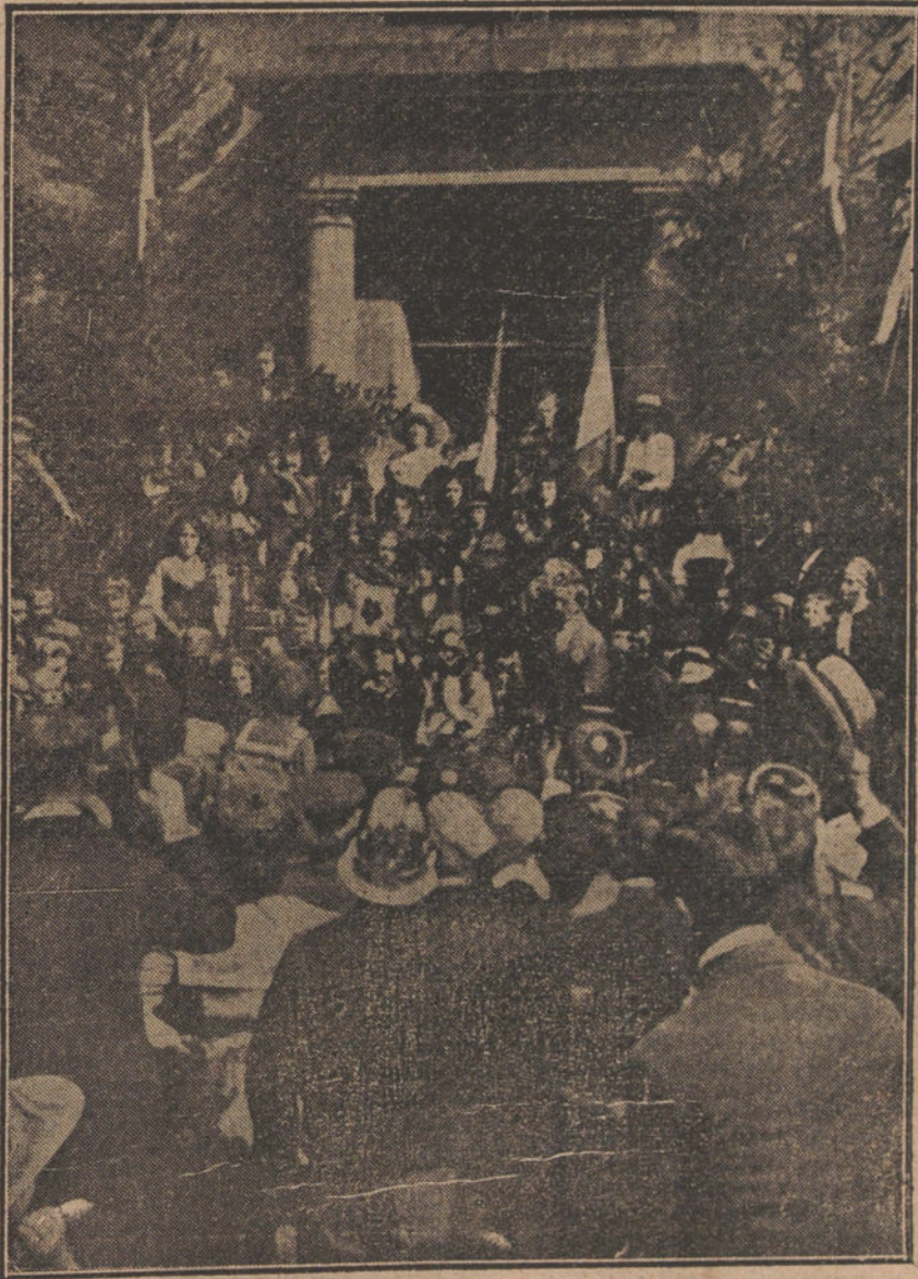
VIAJE DE POINCARE A ALSACIA.—El alcalde de Thann, enseñando á la multitud la cruz de la guerra, concedida á la ciudad por el Presidente de la República.

En la reunión acordaron, por último, expulsar de la Asociación á todos los nésquirols.