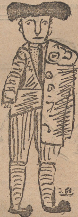
HALOT DE MI PUEBLO, por José Chico (trece años).

Se colocan las codornices en forma de corona, con la pechuga hacia arriba; se calienta bien la guarnición salsa, y se pone en el centro de las codornices.