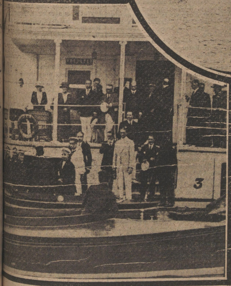
DE LA ESTANCIA DEL REY EN BILBAO.—Núm. 1: Su Majestad el Rey revisa las tropas de la guarnición.—Núm. 2: El crucero «Extremadura», a cuyos costados aparecen los submarinos de escuadrilla española.—Núm. 3: Su Majestad el Rey, al llegar al Sportin-Club, para presenciar las regatas, en las cuales tomó parte después, tripulando el balandro «K-O».