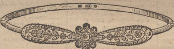
Núm. 9.—Once brillantes y diamantes.