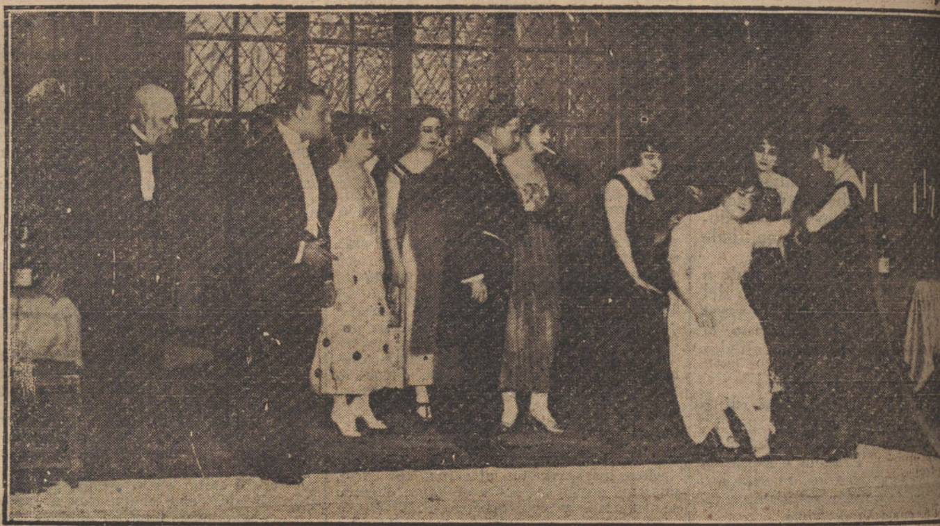
Una escena de la obra polifaceta «La máscara de los dientes blancos», con que anoche se inauguró la temporada del teatro Cómico.

«Contra la noticia publicada por la Federación Patronal, desmintiendo do de los patronos armadores, Asociaciones de capitanes y maquinistas navales, para llegar arreglo, nos ruegan estas entidades hagamos constar que es absurdo cierto que varios navieros visitan marinos en la Sociedad de marineros.