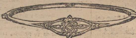
Núm. 1.—Un brillante y diamantes.

CON BRILLANTES DE PRIMERA CALIDAD :: :: DIAMANTES ROSAS DE HOLANDA MONTURAS DE PLATINO FINO Y ORO DE LEY 18 QUILATES CONTRASTADO