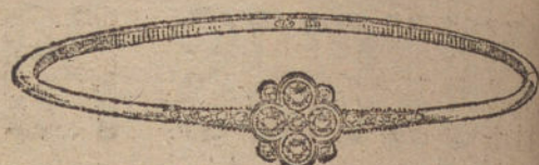
Núm. 4.—Cinco brillantes y diamantes.