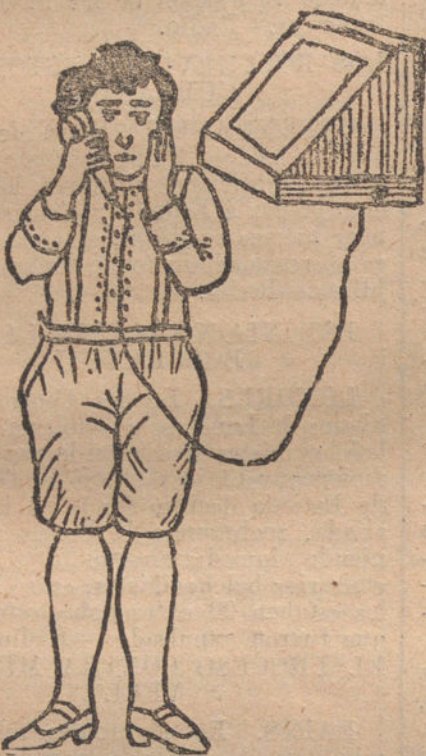
EL TELEFONO DE MI PAPA, por Manuel Chavante (diez años).

Arroz.—Se exprimen granos de racimos de uva bien maduros, y se cuece el zumo en un perol hasta que quede reducido a la cuarta parte. Se cuele y se vuelve a poner al fuego a que espese antes de guardarlo en los tarros.