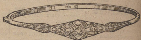
Núm. 8.—Siete brillantes y diamantes.