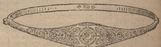
Núm. 10.—Cinco brillantes y diamantes.