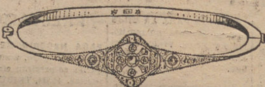
Núm. 5.—Siete brillantes y diamantes.