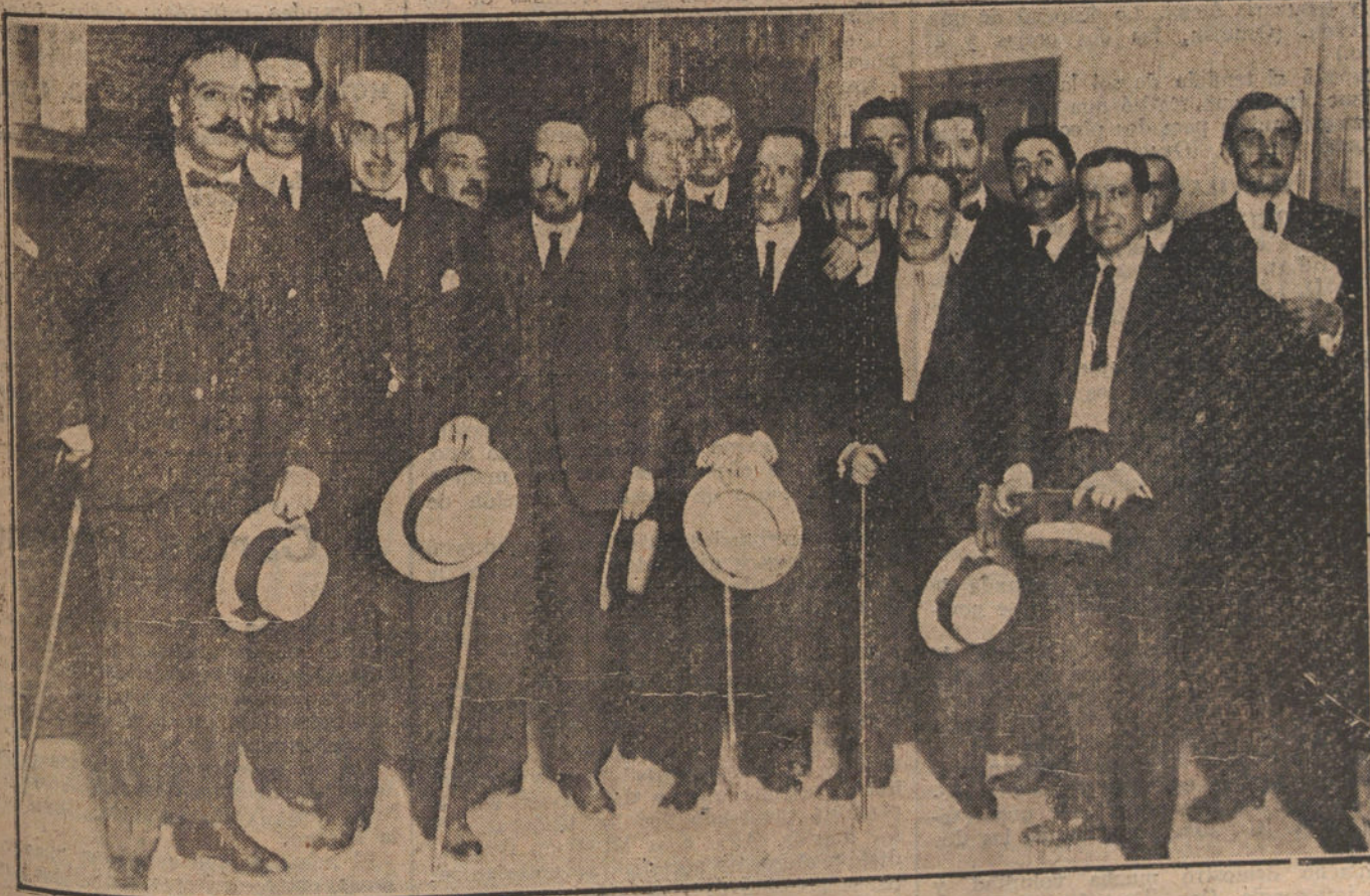
La Comisión de funcionarios de Hacienda, que estudia el acoplamiento de las plantillas, reunida ayer tarde en el ministerio para tomar acuerdos en relación con el actual conflicto.

NUMERO DEL TELEFONO DE LA REDACCION Y TALLERES DE «LA TRIBUNA», JARDINES, 4, 6 Y 8: 4.444.