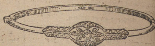
Núm. 2.—Un brillante y diamantes.