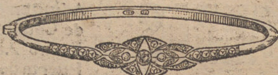
Núm. 3.—Un brillante y diamantes.