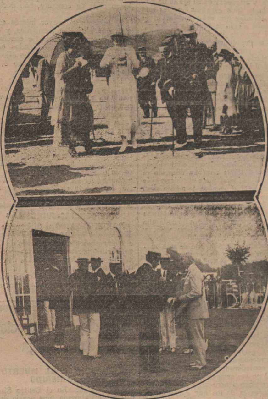
EL VERANO EN SAN SEBASTIAN.—Su Majestad la Reina Victoria, presenciando las carreras de caballos. Su Majestad el Rey en el Hipódromo, momentos antes de comenzar las carreras.

El estado moribundo de la ciudad no se ha curado bajo el imperio de la ley Marcial. No se curará tampoco con la subsistencia de la suspensión de garantías. Llegaremos a la pacificación de los espíritus con la función normal del derecho de ciudadanía. Aquí tenemos conflictos políticos, económicos y