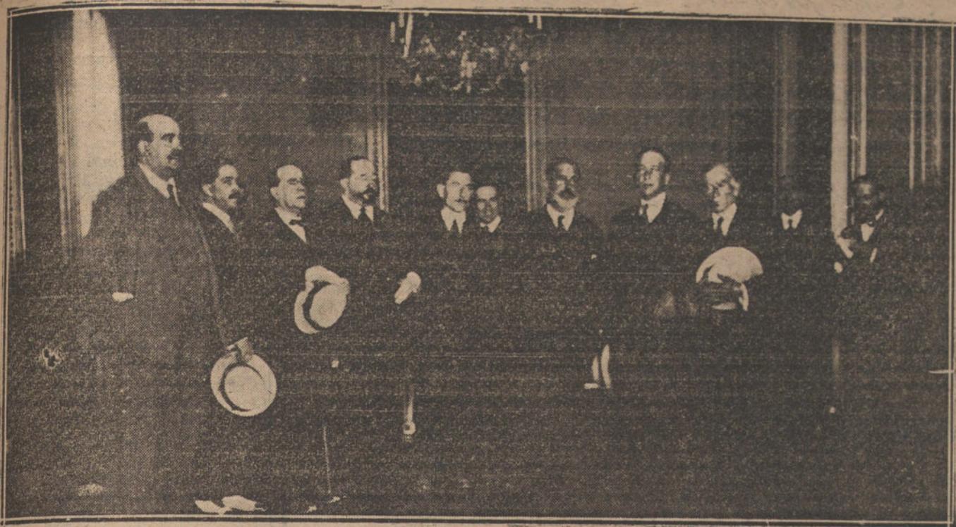
LA MANIFESTACION DE ESTA MAÑANA.—Comisión obrera, que entregó las conclusiones al subsecretario de la Presidencia.

Los billetes para esta función se despacharán en el Ideal Rosales, siendo su precio de cinco pesetas la butaca con entrada, y dos pesetas la entrada de paseo.