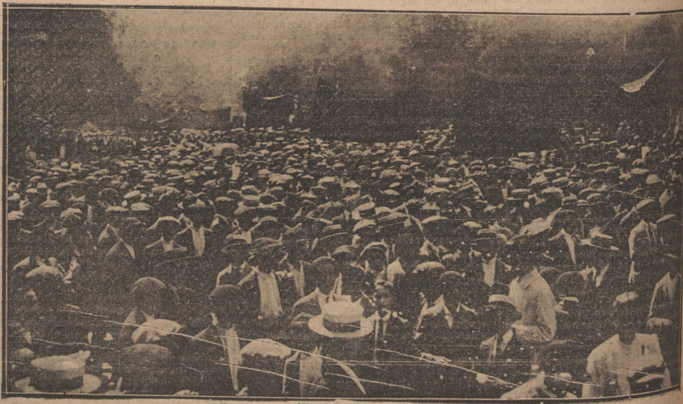
LA MANIFESTACION DE ESTA MAÑANA. — Paso de los manifestantes por Recoletos.