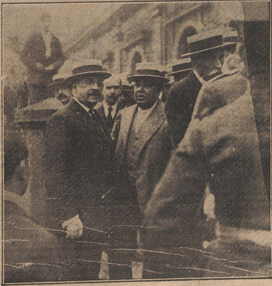
Llegada á Bilbao del ministro de Instrucción para asistir, en representación del Gobierno, á la apertura del Congreso.

«No es ésta la primera vez que tengo la satisfacción vivísima de sumarme personalmente á la obra benemérita de esta Asociación Española para el Progreso de las Ciencias; pero tiene el Congreso que este año celebráis una significación especial que aumenta mi complacencia al inaugurarlo. En los magnos problemas económicos que la guerra ha planteado al mundo, así como en los problemas sociales, exacerbados por el mismo acontecimiento, la ciencia ha de ser, sin duda, uno de los instrumentos principales con que la Providencia ha de acudir al remedio de estas grandes preocupaciones de la Humanidad á la hora presente. La