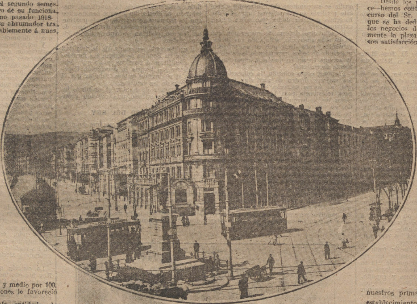
Hermoso edificio propiedad del Banco de Vizcaya.—Bilbao.

LAS NOTICIAS, AVISOS Y COMUNICACIONES NO ADMINISTRATIVAS DEBEN DIRIGIRSE A NUESTRA REDACCION, JARDINES, 4 AL 8