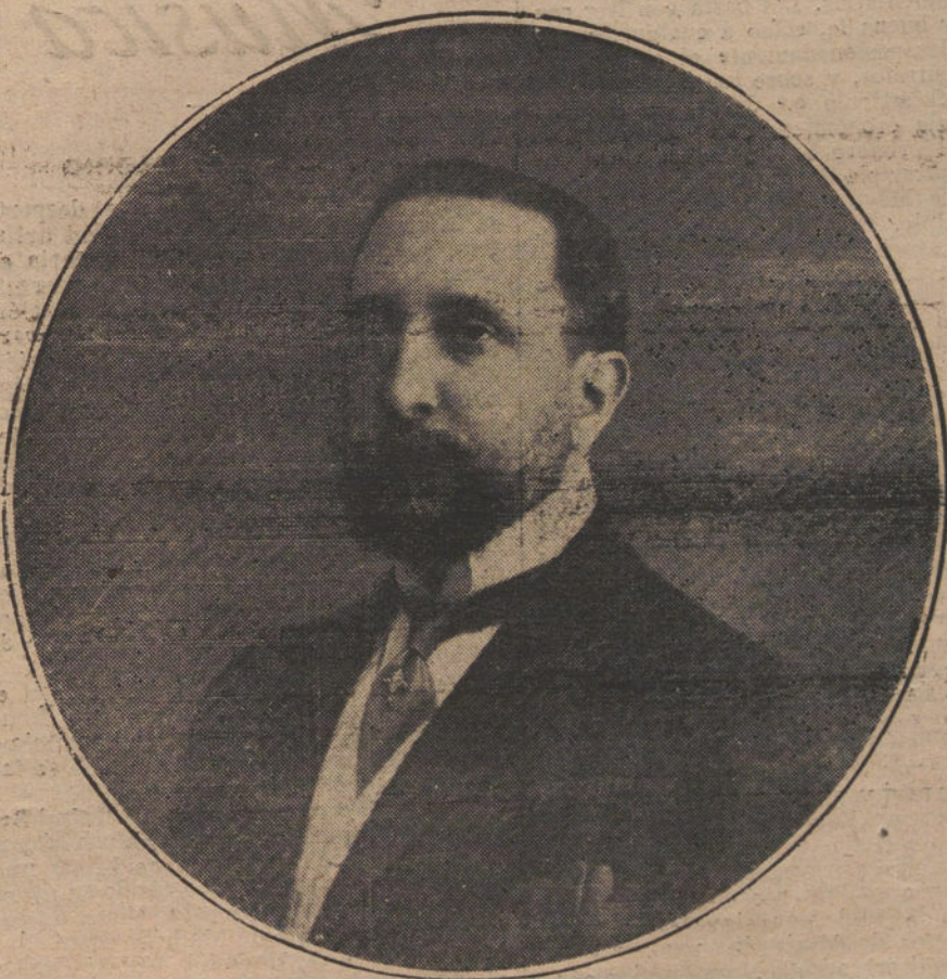
Don Julio Amado, gobernador de Barcelona, a cuyas acertadas gestiones se debe la solución de los conflictos sociales.

una producción ordenada y suficiente a la cantidad de riqueza imprescindi- ble a la vida de la nación.