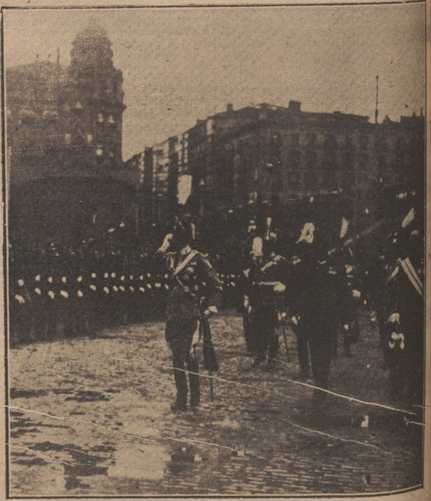
Su Majestad el Rey, revistando las tropas que le rindieron honores en el acto de la inauguración del Congreso de Ciencias.