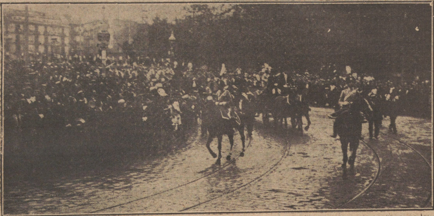
Sus Majestades los Reyes, dirigiéndose a la solemne inauguración del Congreso.

Bilbao en el día de hoy ha dado una nueva y cumplida prueba de progreso y civilización científica.