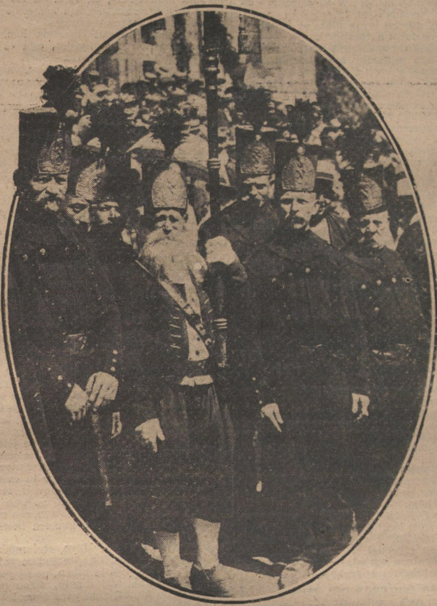
EL PRESIDENTE DE LA REPUBLICA FRANCESA EN LAS CIUDADES DE LA GUERRA.—La tradicional guardia de los mineros de Sainte-Marie-Aux-Mines, con sus respectivos trajes, esperando a Poincaré.

Es preciso estudiar el problema obrero, encanuzándole definitivamente hacia un mejoramiento material y mo- ral sin límite; pero condicionado por