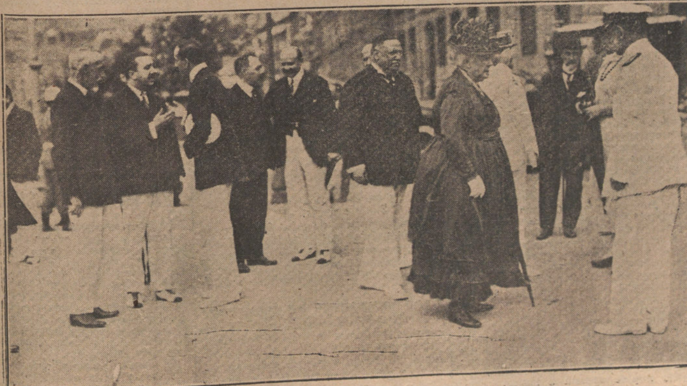
EL VERANEO DE LA FAMILIA REAL EN SAN SEBASTIAN.—Su Majestad el Rey y Su Alteza la Infanta Isabel, á su llegada al Club Náutico, para presenciar las regatas.