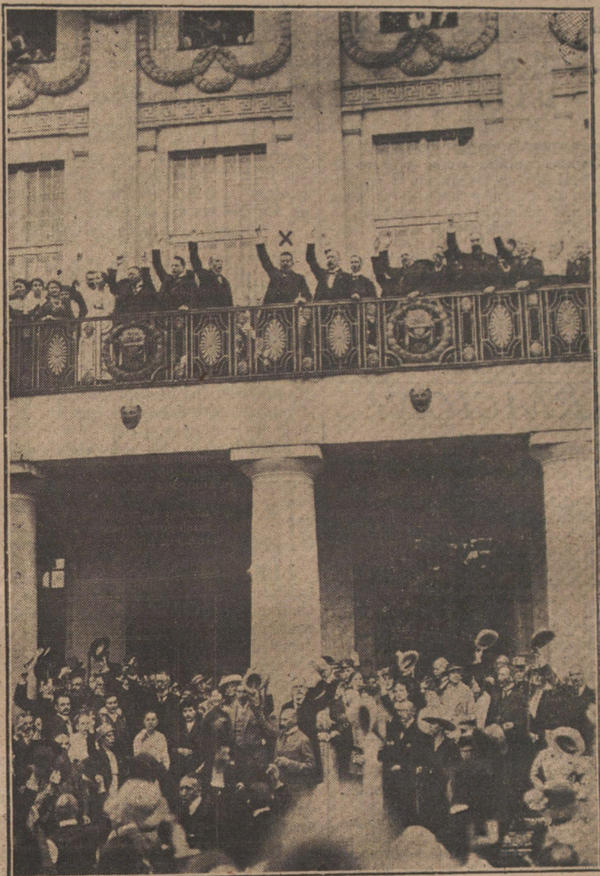
LA JURA DEL PRESIDENTE DE LA REPUBLICA ALEMANA. — Ebert (x), después del acto de la jura, saludando a la multitud.

Habría de disgustar eso a los patronos? Los patronos aspiraban a la normalidad. El «lock-out» fue consecuencia del «boycott». Pero no una venganza, ni una represalia, sino una medida de defensa imprescindible. Después