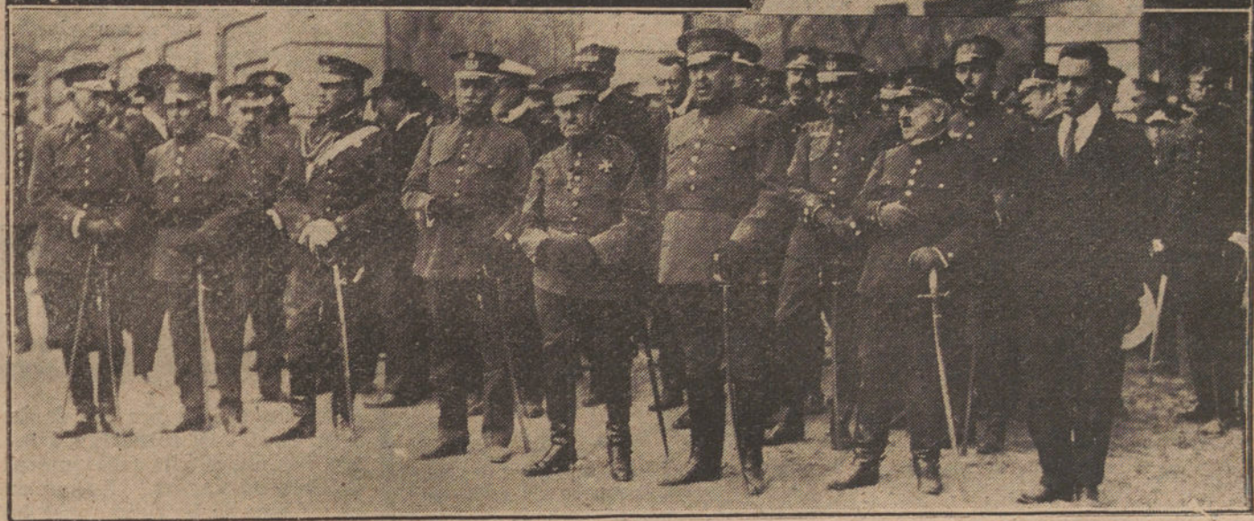
LA CATASTROFE DE AVIACION.—El entierro de las víctimas, verificado esta mañana en Carabanchel. Compañeros de los muertos, conduciendo a hombres los ferretos. Debajo, la presidencia del duelo.