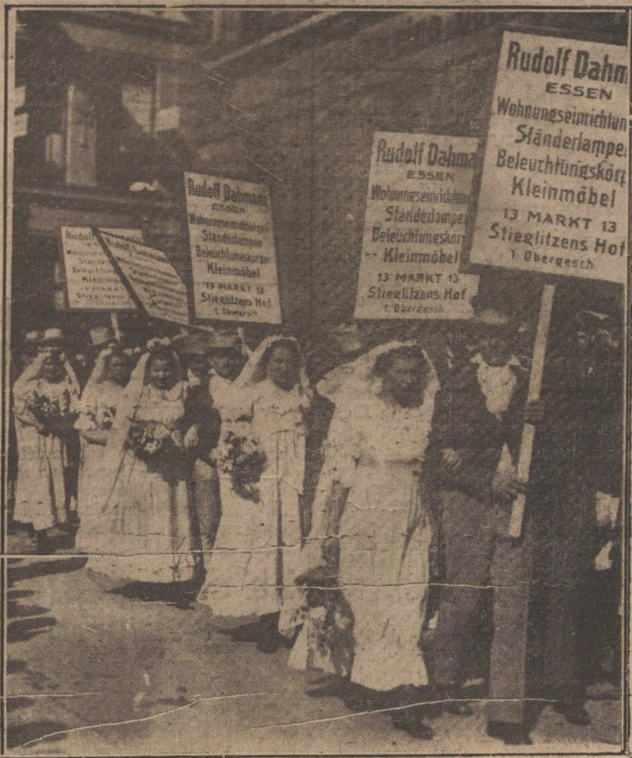
LA TRADICIONAL FERIA COMERCIAL DE LEIPZIG. — Parejas de novios que bailaban en la comitiva de la cabaigata.