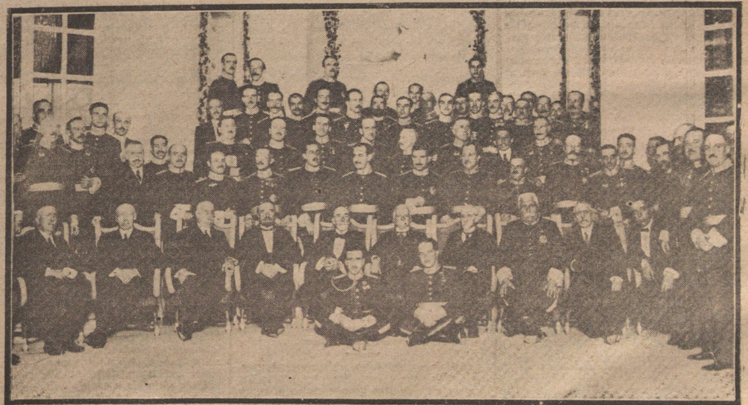
Concurrentes al banquete, celebrado anoche en el Ritz, por el Cuerpo de Estado Mayor, con motivo de la imposición de fajas á los nuevos capitanes.