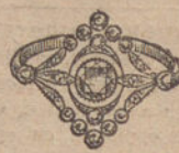
Núm. 6.—11 brillantes y diamantes. Ptas. 400.