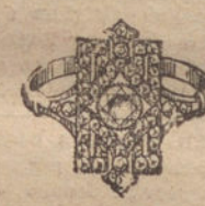
Núm. 13.—7 brillantes y diamantes. Ptas. 625.