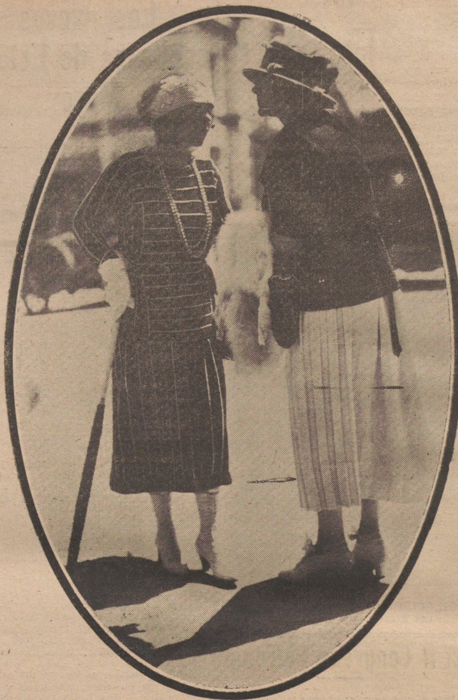
Modelos de traje de otoño, última creación.