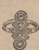
Núm. 1.—2 brillantes y diamantes. Ptas. 240.

CON BRILLANTES DE PRIMERA CALIDAD :: :: DIAMANTES ROSAS DE HOLANDA MONTURAS DE PLATINO FINO Y ORO DE LEY 18 QUILATES CONTRASTADO