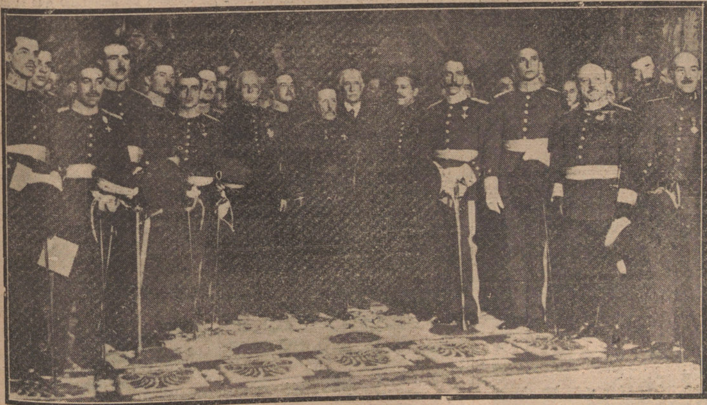
Imposición de fajas a los nuevos capitanes de Estado Mayor, acto verificado ayer en el Depósito de la Guerra, bajo la presidencia del general Weyler.

La función se ha cambiado, comenzando desde arriba; los gobernadores mandan, ordenan y disponen sin el debido conocimiento de lo que determinan; se ha creado un cargo fantástico: el de inspector de Seguridad, más propiamente llamado antes jefe superior de Policía, y este funcionario, con ho-