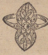
Núm. 2.—3 brillantes y diamantes. Ptas. 250.