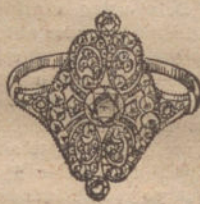
Núm. 14.—5 brillantes y diamantes. Ptas. 650.