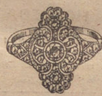
Núm. 12.—5 brillantes y diamantes. Ptas. 600.