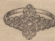
Núm. 8.—7 brillantes y diamantes. Ptas. 475.