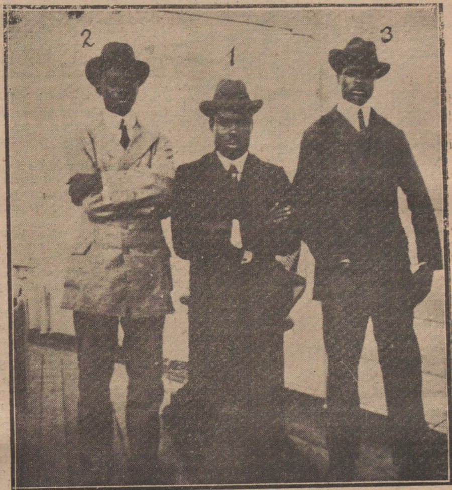
Atangaut (1), Rey de los pamués del Camerón, con su hijo, el Príncipe heredero (2), y su presidente del Consejo de ministros (3), a bordo del vapor «San Carlos», que les ha conducido a España.

Es inepta, la Policía por muchas razones. Quizá por ser mal pagada, por falta de conocimientos, por favoritismos de los que los mandan aquí, en la esperanza de hallar el oro y el morro, y, sobre todo, porque, a excepción de todo esto, tiene demasiadas cosas para distraerse: abundan los music-