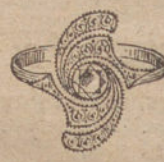
Núm. 3.—1 brillante y diamantes. Ptas. 295.