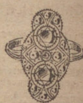
Núm. 15.—5 brillantes y diamantes. Ptas. 700.