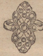
Núm. 4.—7 brillantes y diamantes. Ptas. 350.