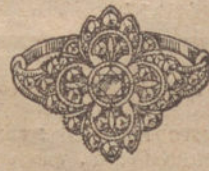
Núm. 9.—9 brillantes y diamantes. Ptas. 500.