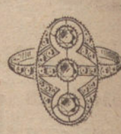
Núm. 5.—3 brillantes y diamantes. Ptas. 375.