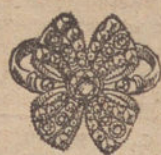
Núm. 7.—9 brillantes y diamantes. Ptas. 450.