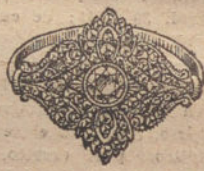
Núm. 11.—5 brillantes y diamantes. Ptas. 550.