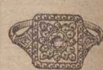
Núm. 10.—5 brillantes y diamantes. Ptas. 525.