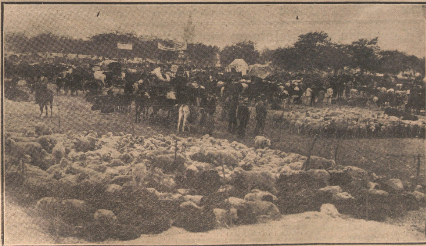
LA FERIA DE SAN MIGUEL, EN SEVILLA.—Vista general del mercado.