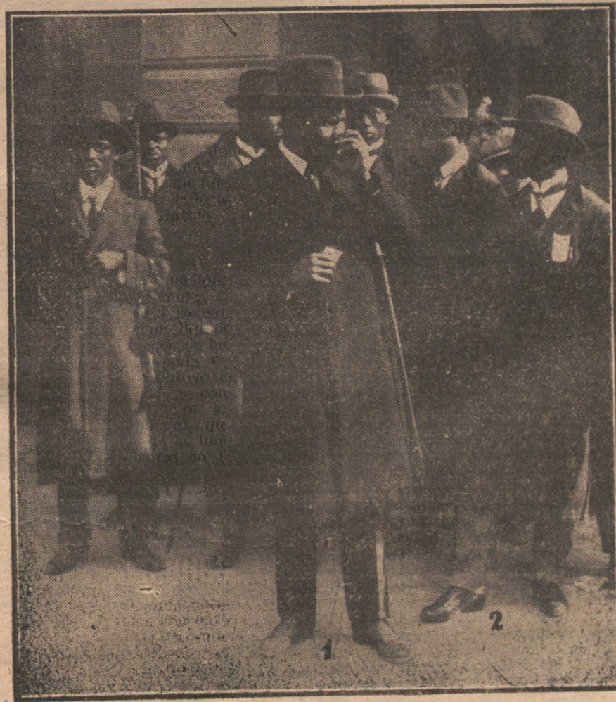
Llegada a Madrid del Rey negro de los pámue, Atangani (1), su hijo, el Príncipe heredero (2), y algunos ministros.

Por unanimidad se aprueba y se levanta la sesión. Son las tres de la tarde.