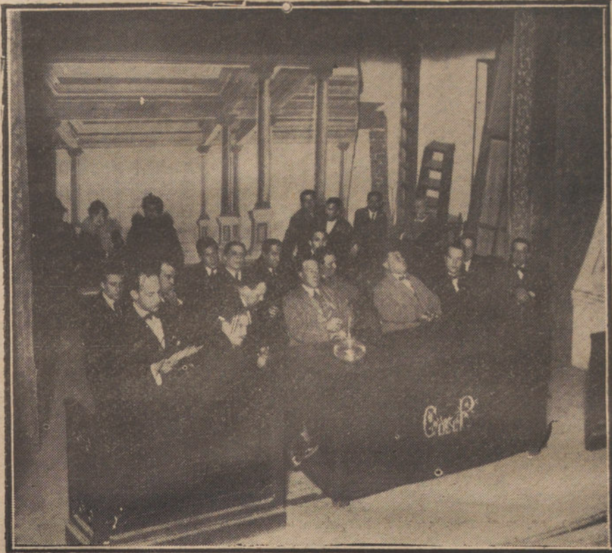
Presidencia del mitin celebrado esta madrugada por los actores, en la Casa del Pueblo, en cuyo acto quedó constituido el Sindicato de Cómicos.

Relata cómo se dejó a dos licenciados de presidio que mataron a un amigo suyo, y luego el juez les puso en libertad, por que pertenecían a la banda de Bravo Puñillo.