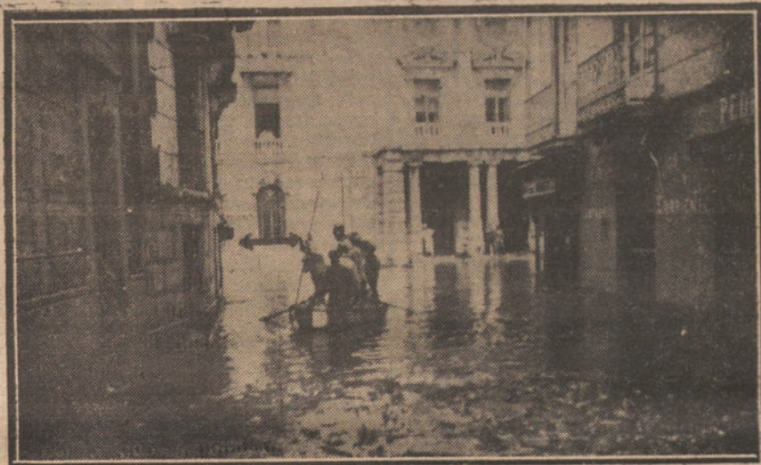
LA TERRIBLE INUNDACION DE CARTAGENA.—Sección de bomberos, practicando trabajos de salvamento. La flecha señala la altura que alcanzaron las aguas.

CARTAGENA. El ministro de Fomento, acompañado de las autoridades de la provincia, recorrió las calles inundadas, en donde pudo apreciar la magnitud de los daños. Visitaron gran número de establecimientos que quedaron destruidos por el temporal.