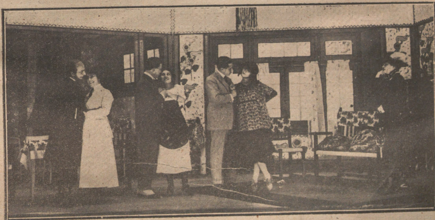
Una escena de la comedia «La importancia de llamarse Ernesto», estrenada anoche en el teatro de la Princesa.

Oficinas militares.—Ingresa un aspirante.