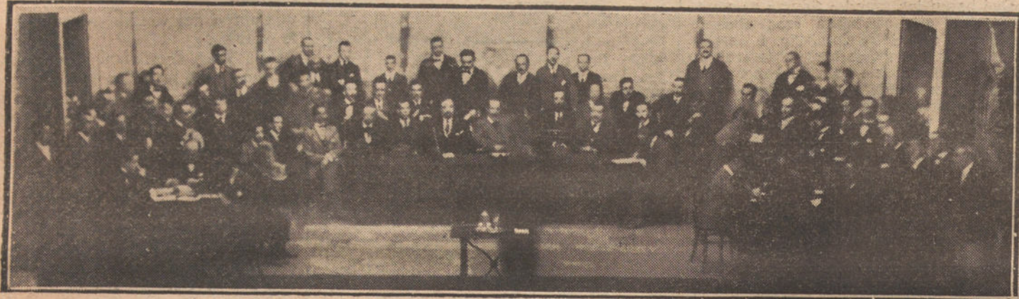
Aspecto del escenario del teatro de la Comedia, durante la conferencia dada anoche por Angel Pestaña.

Desde dos horas antes de la señalada para la conferencia de Pestaña y Seguí en el teatro de la Comedia empezó a concurrir el público a la calle del Príncipe, y a las seis se hacía difícilísima la circulación. A pesar de esto, las puertas del teatro permanecían cerradas, y la gente continuaba engrandando los grupos, llegando a producirse algunos desórdenes, debidos a la aglomeración.