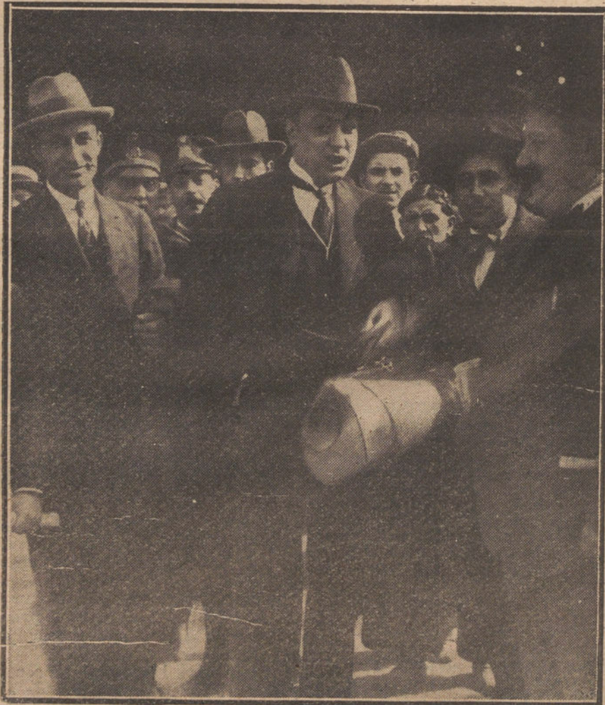
Llegada esta mañana a Madrid del popular sindicalista catalán Salvador Seguí

¿Es que los jueces no tienen otros sitios y elementos donde bucear? ¿Es que la prostitución y el juego no dan criminales? Pues la Policía nunca ha ido a buscarlos allí.