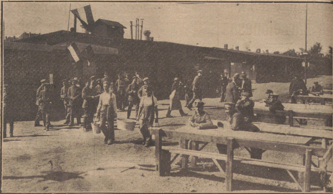
REPATRIACION DE LOS PRISIONEROS ALEMANES.—Vista general de campo de concentración. Un aspecto de la cantina.

Profusamente ilustrado con lo más selecto de la actualidad gráfica; artístico en las composiciones y cuidado literariamente, «El Crimen de Hoy» es cómodo, simpático y «periodístico».