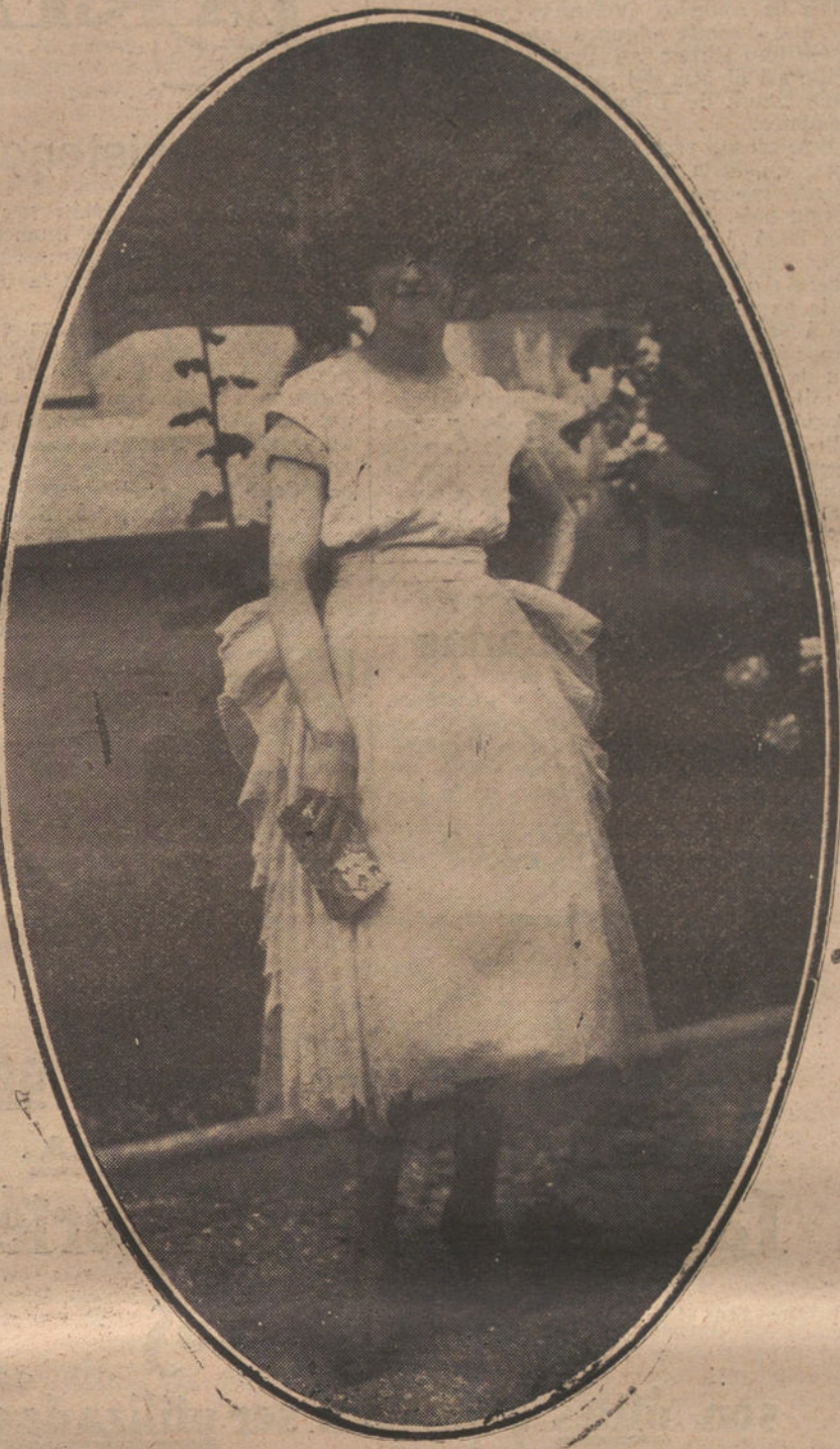
Uno de los últimos modelos de trajes y gorras de terciopelo.

bajo mismo. Esto, que a primera vista puede asustar a las «señoras», no les ofrece tantos perjuicios como pueden creer. En efecto, es cosa probada que el trabajo breve y hecho con gusto cunde mucho más que el trabajo largo y consecutivo, y que los patronos no han salido realmente perjudicados en los acortamientos sucesivos de las jornadas obreras femeninas, aquellas jornadas, aquellas terribles jornadas que fueron de doce y trece horas que eran en nuestras fábricas de diez u once hasta hace poco, y que son ahora de ocho.