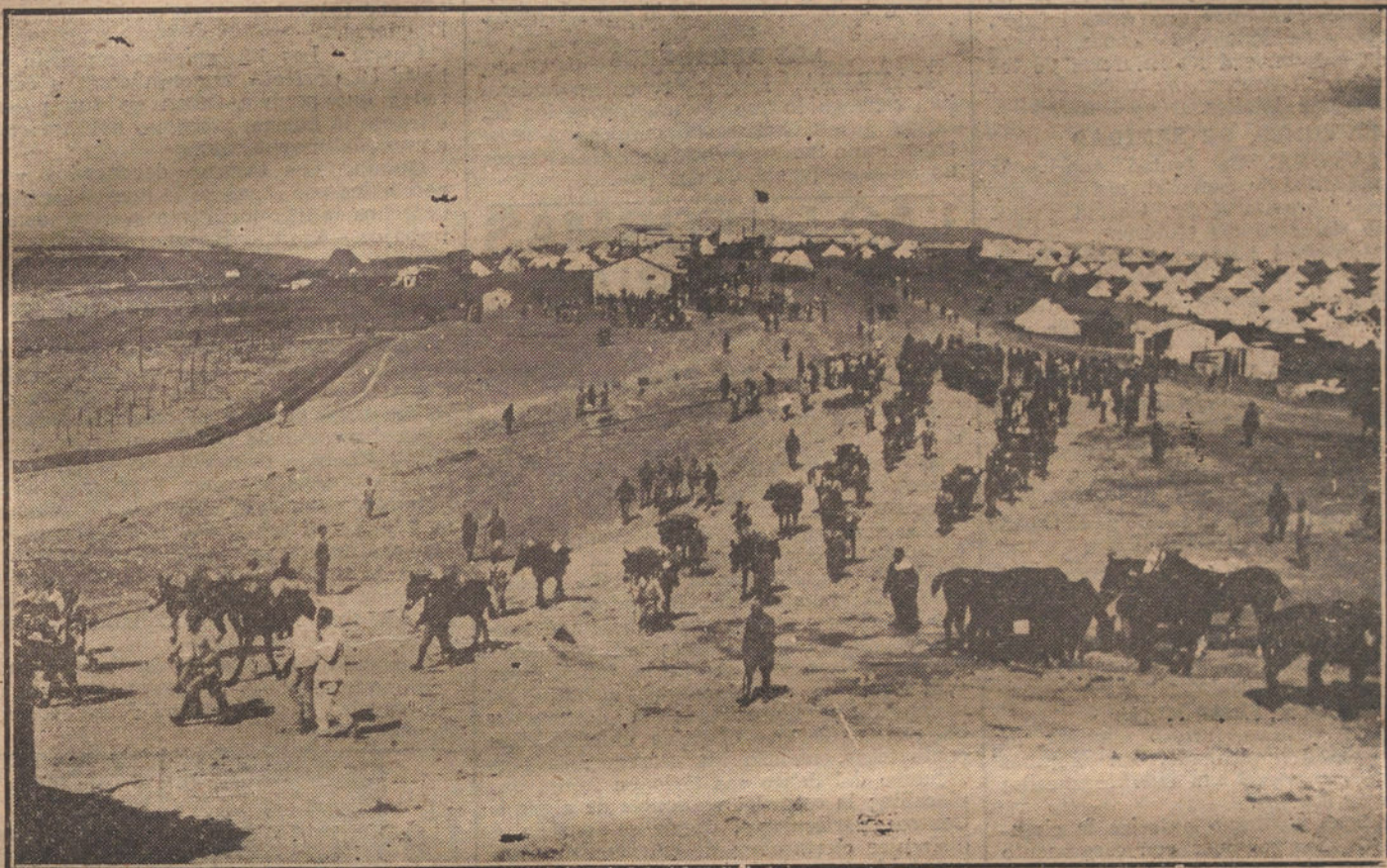
Salida del campamento de Regaia de las columnas que, al mando del general Barrera, han ocupado las distintas posiciones del camino de Tánger a Tetuán, y que, continuando su avance, llegaron el día 5 al famoso Fondak de Ain-Yedida.

Se presentó el Maalaen, jefe de Uadrás, con su gente, para hacer acto de sumisión y entregar las armas.