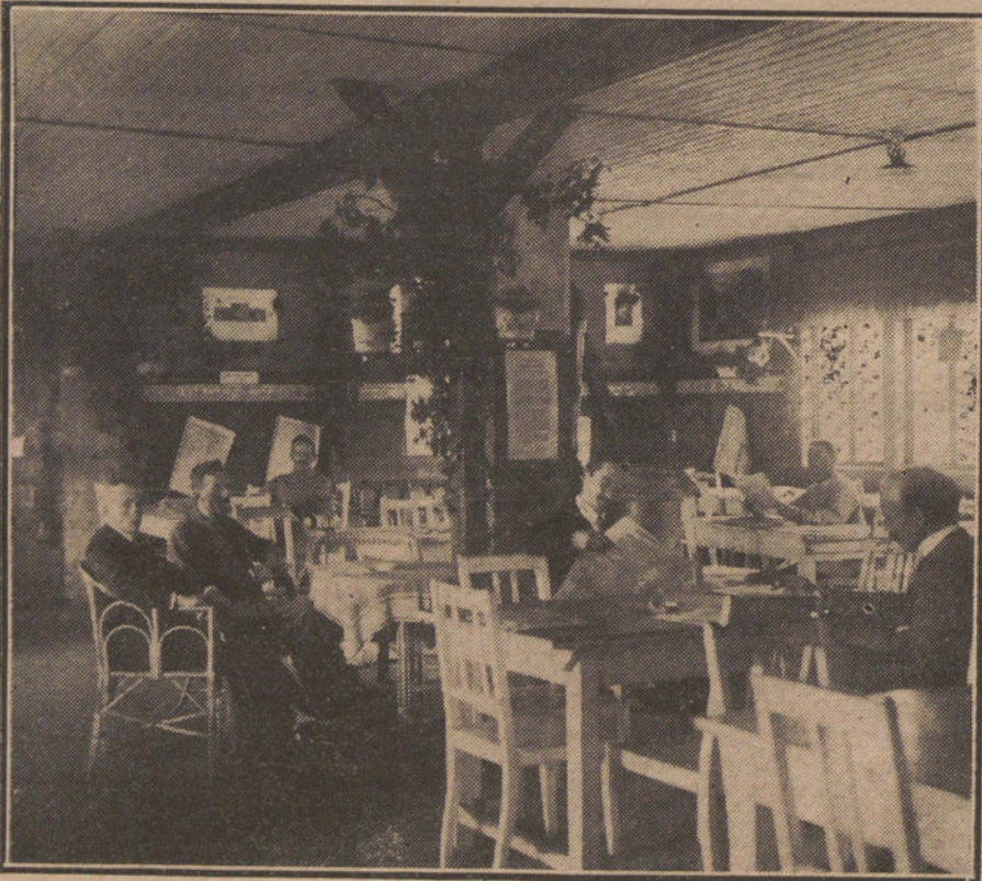
REPATRIACION DE LOS PRISIONEROS ALEMANES.—Los prisioneros, después de equipados, en la sala de lectura del campamento. (Fot. SENNEKE.)

La familia continúa recibiendo testimonios de pésame.—Agencia Americana.