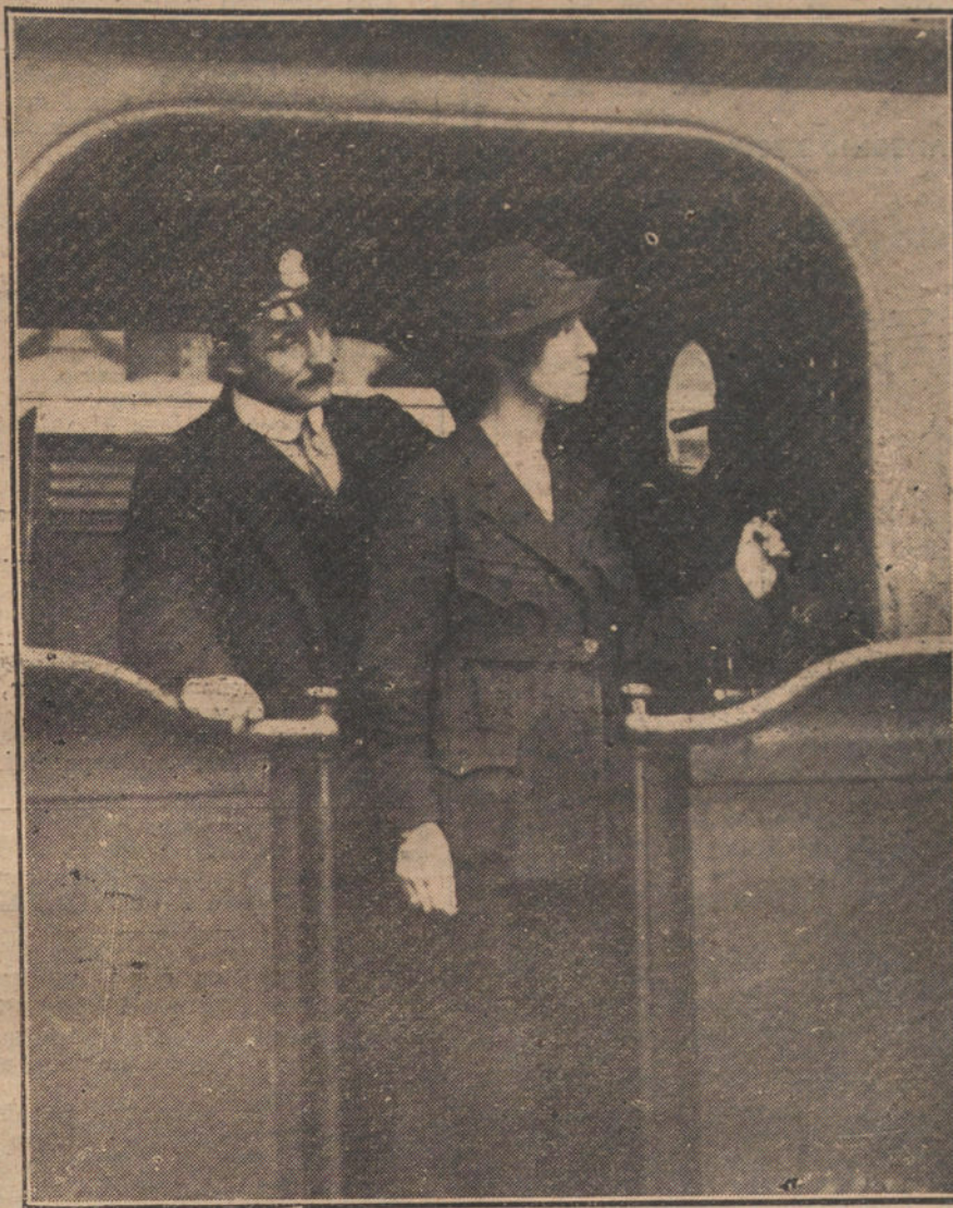
LA HUELGA DE FERROVIARIOS EN INGLATERRA.—Una locomotora, conducida por una señorita.