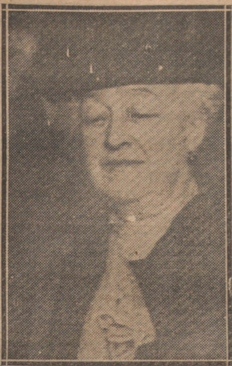
La Princesa de Ribera, esposa del ex embajador alemán en Madrid, fallecida recientemente en Kiefferstaedt (Silesia.)

—Ayer, segundo jueves de moda, se dio el Coliseo Imperial lleno de un dis-