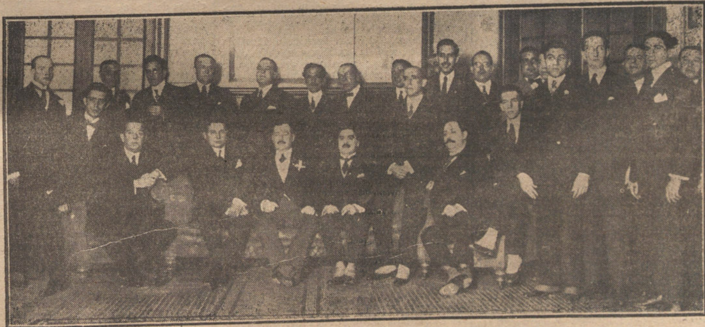
EN LA LEGACION DE CUBA.—El ministro de Cuba en España, Sr. García Khollly (x), rodeado del alto personal de la Legación y de la colonia cubana, que ha concurrido a la recepción, verificada con motivo de la fiesta nacional.

En la «Gaceta» de hoy se publican varios decretos, fijando las plantillas del Cuerpo general de funcionarios administrativos y subalternos del ministerio de Instrucción pública; la de los diversos Cuerpos de la Dirección general del Instituto Geográfico y Estadístico; las del Profesorado numerario de los distintos Centros de enseñanza, cuyos escalafones dependen de la Subsecretaría del ministerio de Instrucción y la del escalafón del Ministerio.