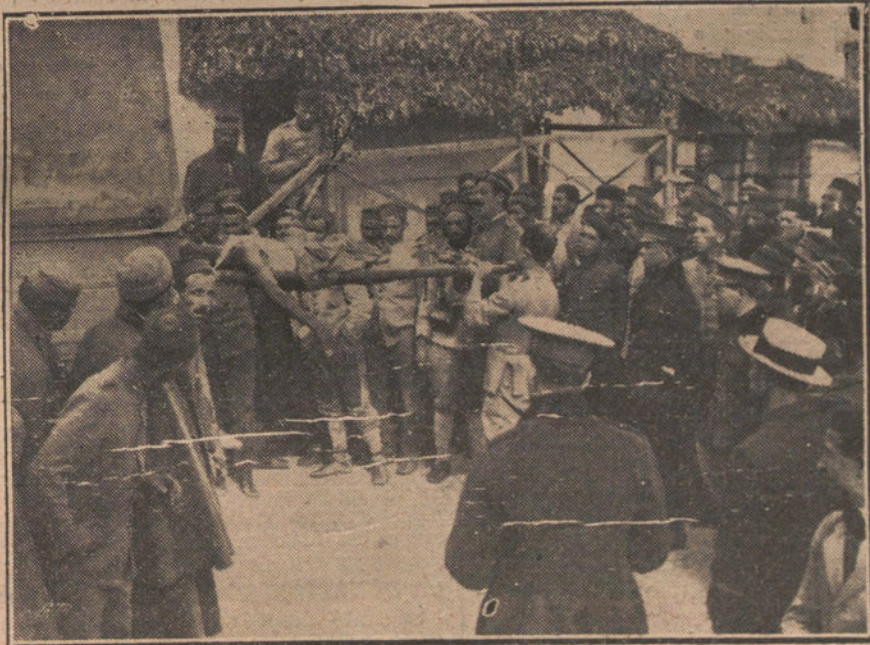
Convoy de muertos y heridos, del combate del Fondak, a su llegada a Laucien.