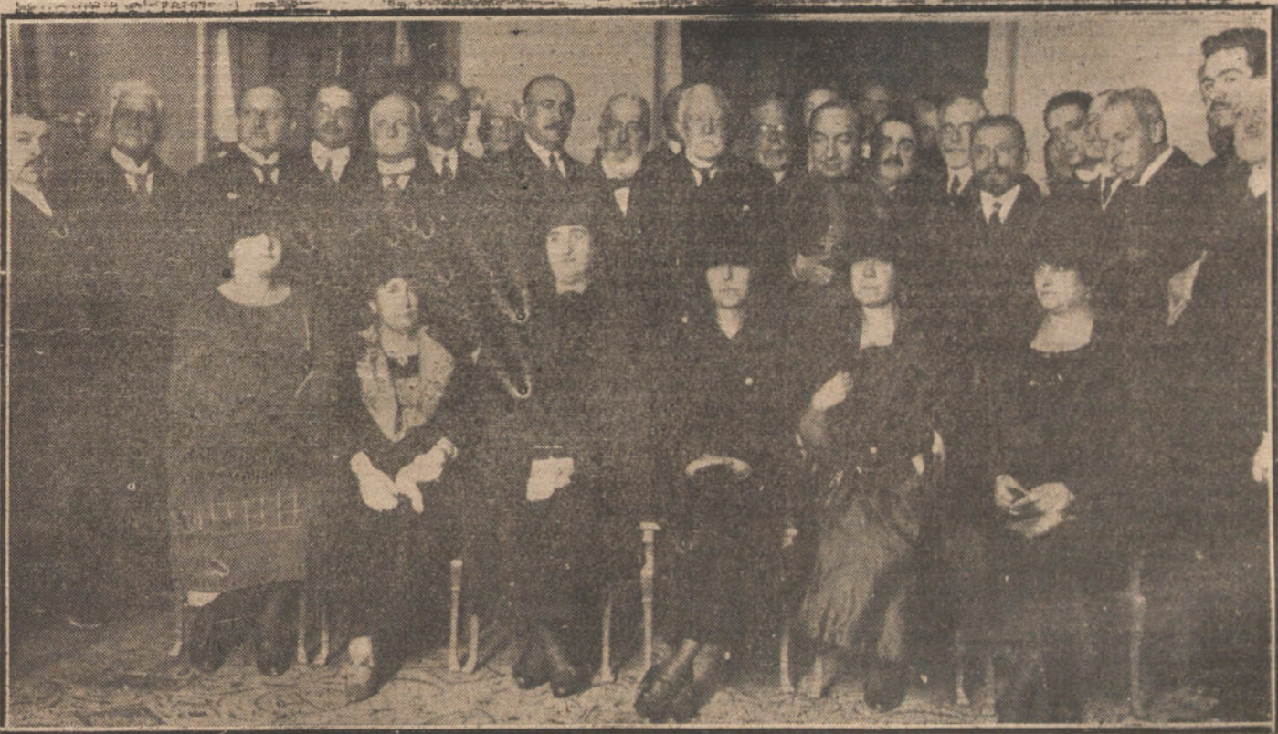
Fé ofrecido ayer tarde por la Unión Iberoamericana, con motivo de la Fiesta de la Raza.

El presidente de la Sociedad de edificios que pertenecieron a la Universidad da las más expresivas gracias a cuantas personalidades han acudido a honrar este acto, y muy especialmente a los donantes de la lápida. Explica el objeto de la Sociedad que preside, que es el de procurar la mejor conservación de los gloriosos edificios.