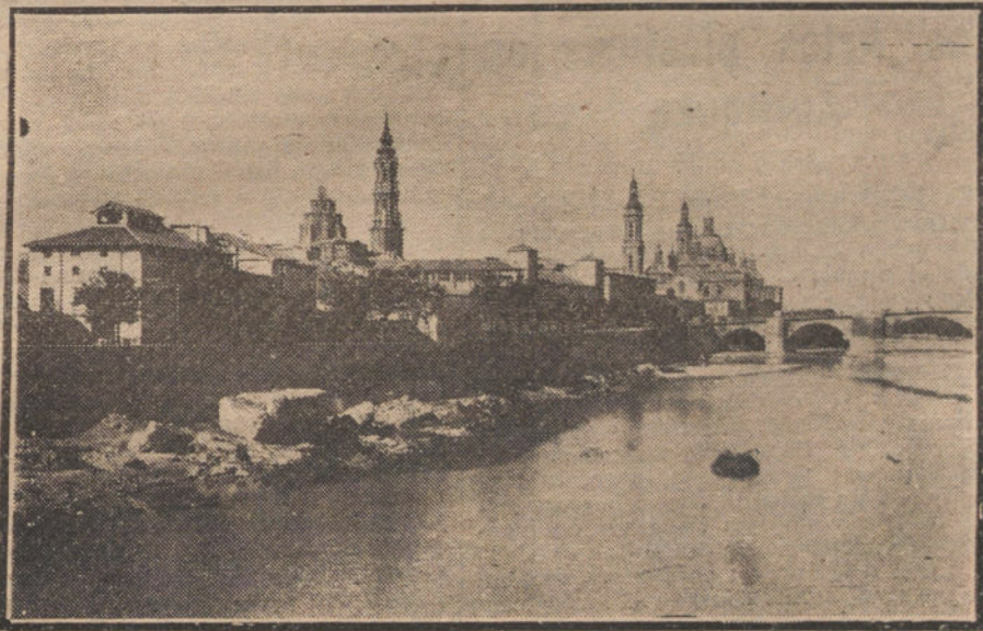
ZARAGOZA.—Vista panorámica de los templos del Pilar y La Seo y del Puente de Piedra.

Representación exclusiva para Aragón, Navarra y Rioja. Marca preferida. Gran oportunidad comprando en marcos.