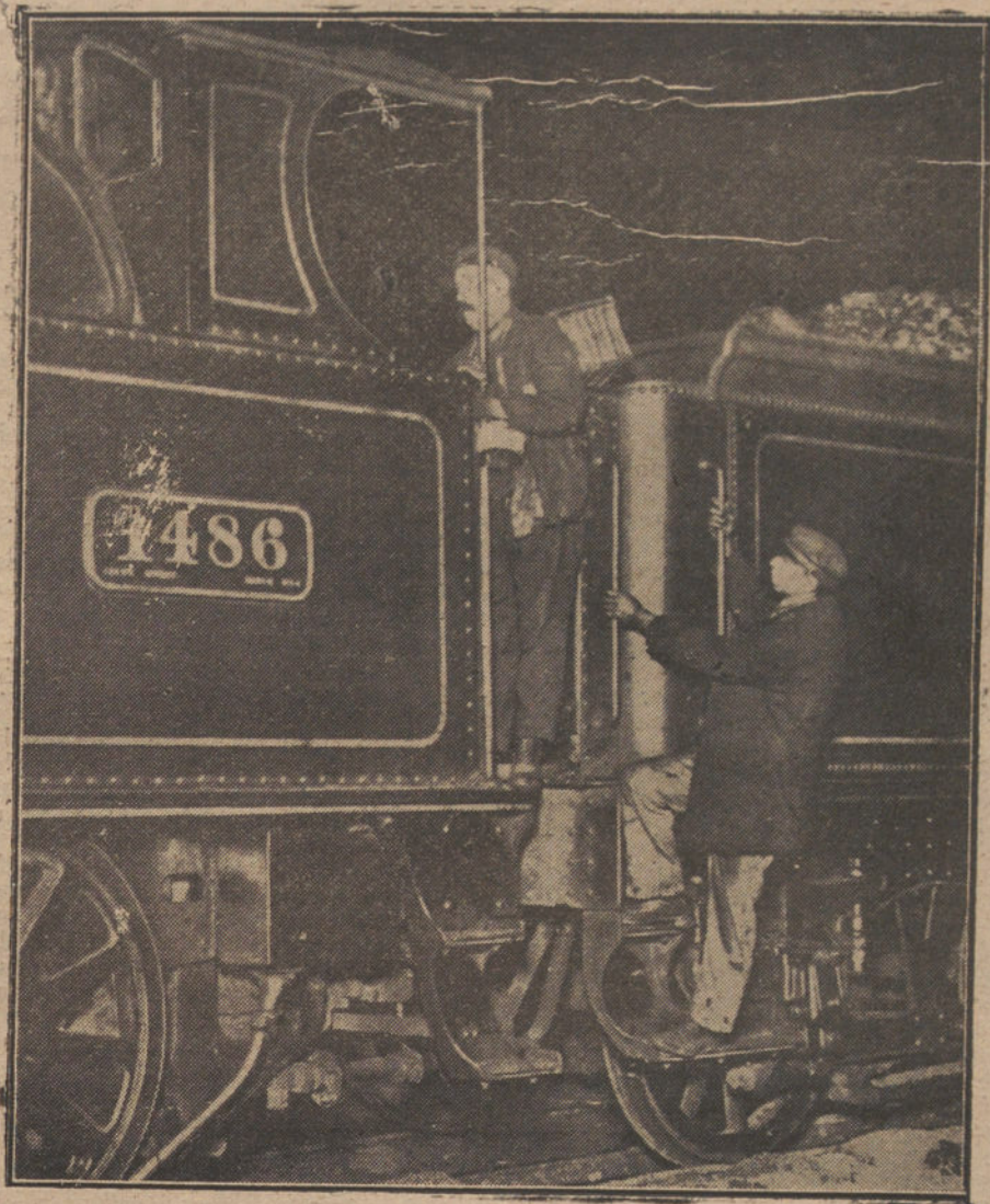
LA HUELGA DE FERROVIARIOS EN INGLATERRA.—Maquinistas al reanudar el trabajo en una de las estaciones de Londres.

Por la barbarie, la facilidad y lo socorrido de las lámparas de tela, cuelgan esas creaciones deznables, delgadas y como de papel de seda, de los florones de las salas, los salones y los comedores.