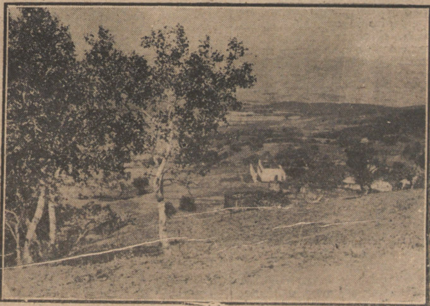
NUESTRA ACCION EN MARRUECOS.—Aspecto del aduar de Lezmá, después del bombardeo de nuestros aviones.

Si los españoles de otras regiones viajasen por los caminos de Cataluña, si viesen de cerca el abandono que aquí