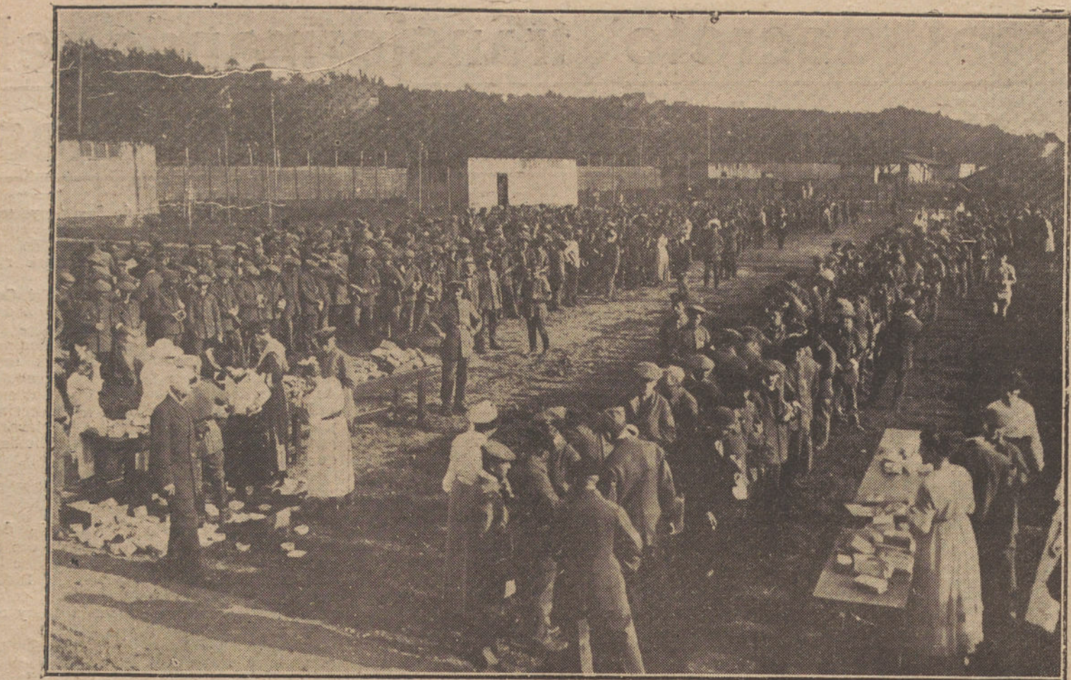
LA REPATRIACION DE PRISIONEROS ALEMANES.—Aspecto de uno de los campamentos de concentración, durante el reparto de donativos á la llegada de los primeros prisioneros.

Art. 46. La Secretaría general es la encargada de la tramitación de los asuntos generales del pleno, Consejo de Dirección y Direcciones y el Centro administrativo del Instituto. El secretario del pleno y