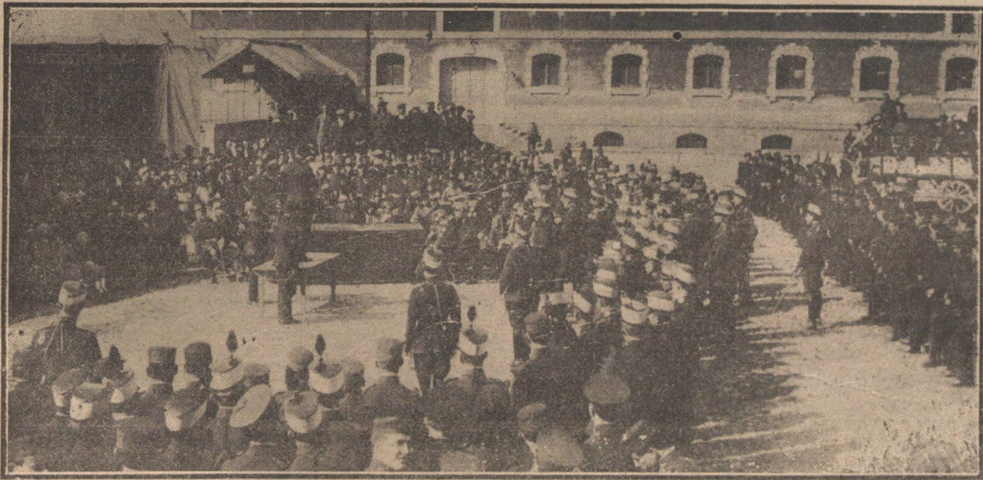
UN DETALLE DE LA FIESTA DE LA PATRONA DE LA INTENDENCIA MILITAR.—El soldado ganador del premio del Ayuntamiento, leyendo su poesía.

De Contumburgo: Vapor sueco «Catalonia», de 1.293 toneladas, con carga general para Barcelona.