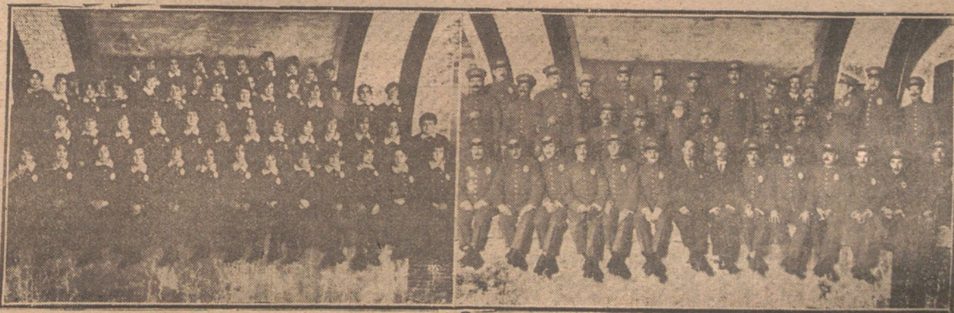
Grupo de empleados de ambos sexos del Metropolitano.

LAS NOTICIAS, AVISOS Y COMUNICACIONES NO ADMINISTRATIVOS DEBEN DIRIGIRSE A NUESTRA REDACCION, JARDINES, 4 AL 8