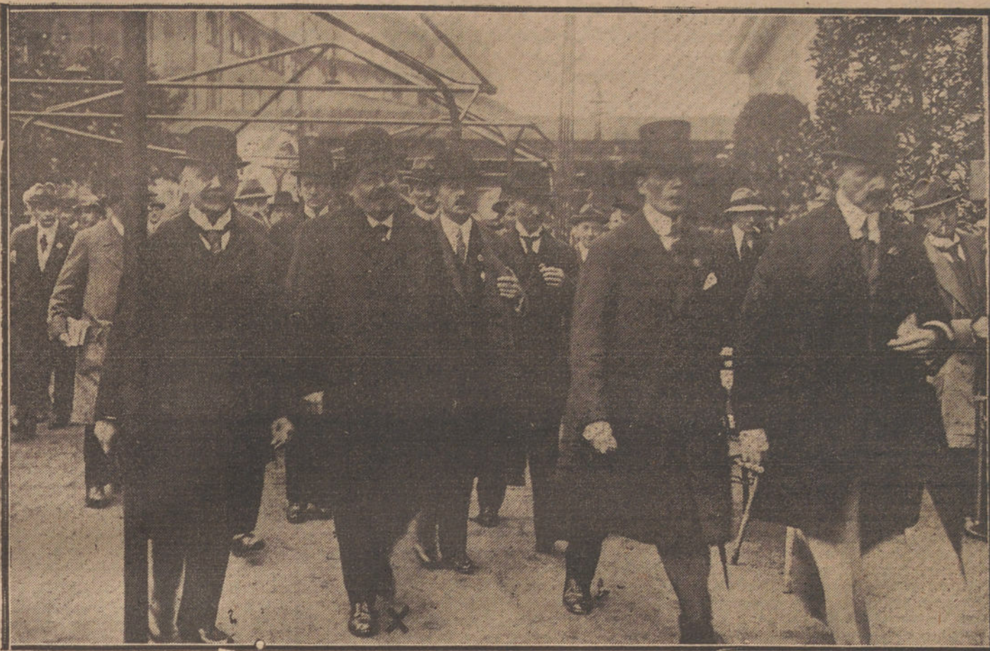
LA EXPOSICION DE FRANKFORT.—El Presidente de la República alemana, Ebert (X), á su llegada á la Exposición.