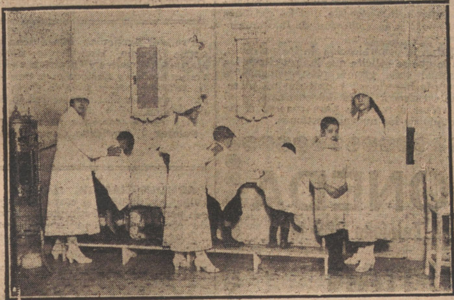
¿Cómo se hacían antes los servicios de higiene en las Tenencias de Alcaldía.

Acaba de promulgarse una Real orden, que prohíbe la entrada a las escuelas del Estado y a las escuelas privadas a los niños parasitarios, y ordena se proceda al despiojamiento del niño que haya sido reconocido como tal.