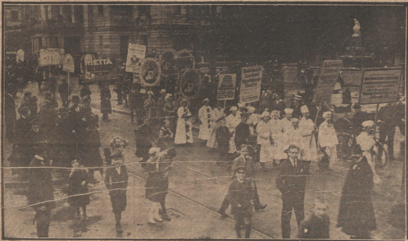
LA FERIA DE FRANKFORT.—Un detalle de la famosa cabalgata industrial.