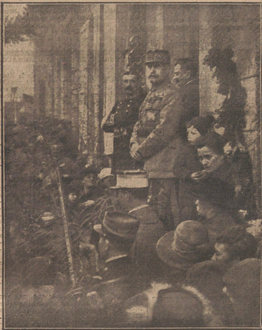
DESPUES DE LA GUERRA.—El generalísimo Foch, en la puerta de la casa, donde nació, en Saint-Gondou, saludando a la población

Habría derecho a pensar que los preceptos constitucionales no se observaban escrupulosamente, si después de una entrevista con el Rey se dieran a