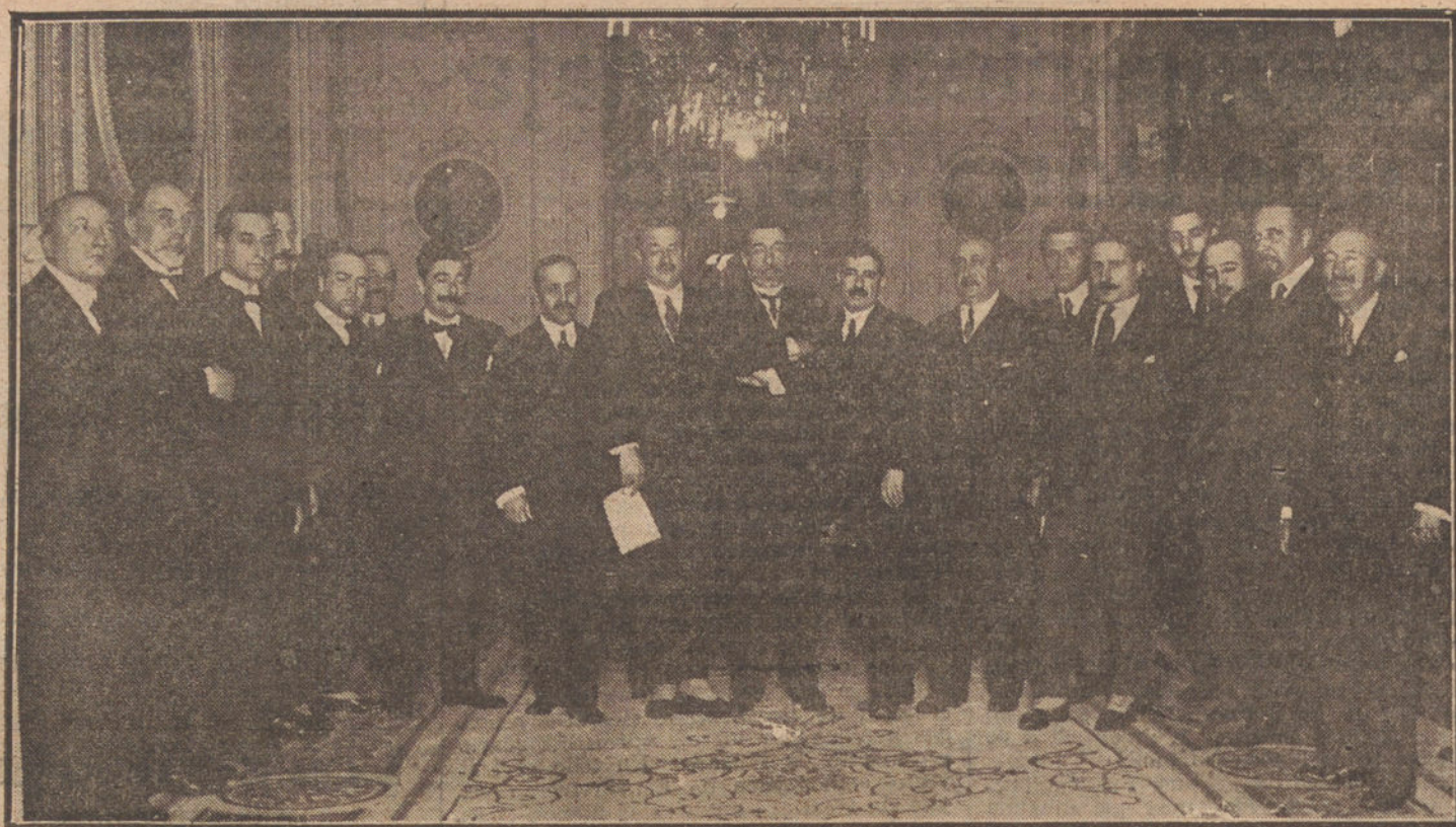
El ministro de la Gobernación, con los alcaldes de los Ayuntamientos de capitales de más de 100.000 habitantes, al terminar la conferencia celebrada anoche, para estudiar el problema de las Haciendas locales.

XV. Responsabilidad de las autoridades municipales y de los miembros de sus diversos organismos.—Autoridades o Tribunales ante los que deban hacerse efectivos y procedimientos para ello.