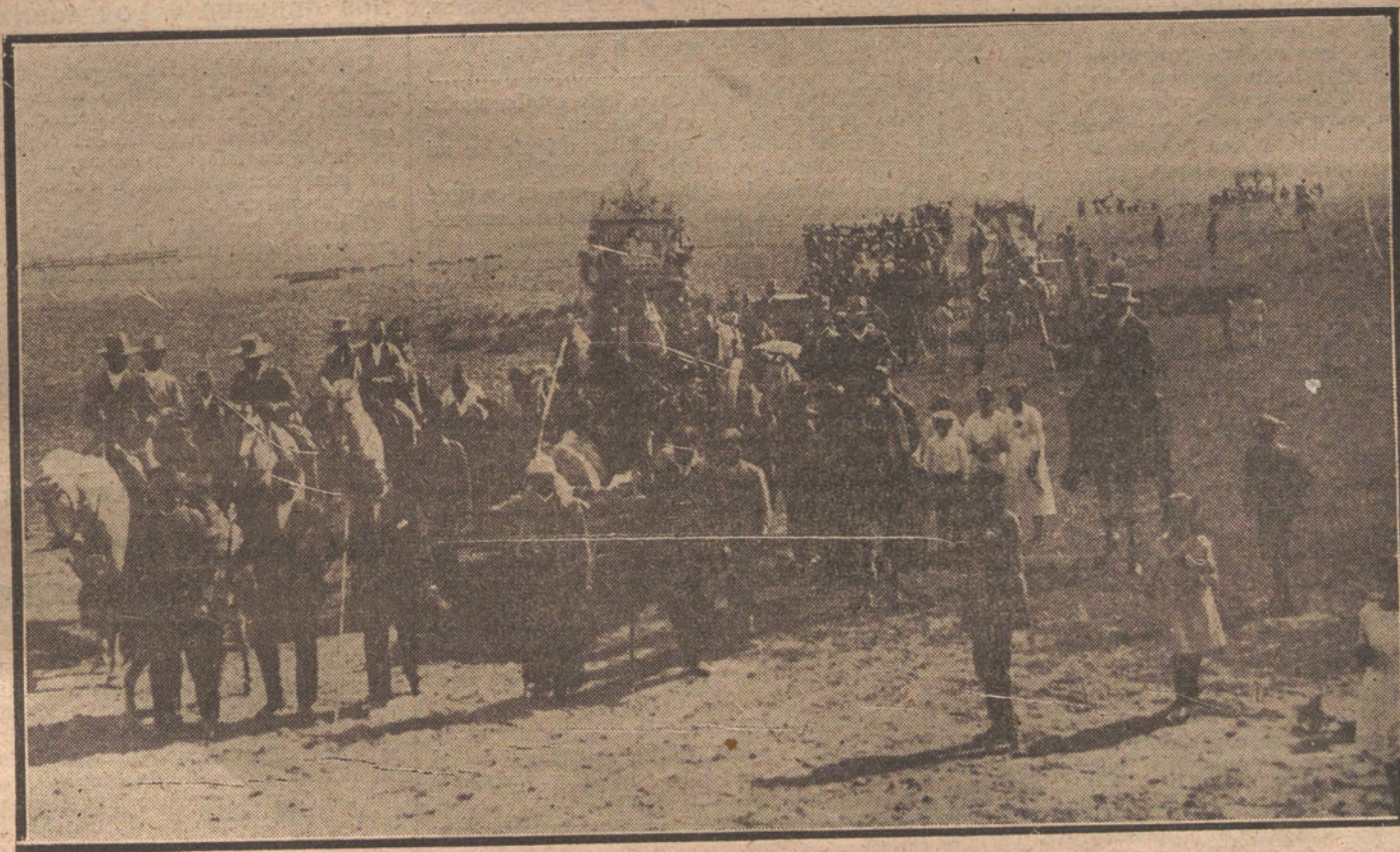
Un detalle de la típica romería de la Virgen de Valmes, que se celebra anualmente en Dos Hermanas (Sevilla).

La referida Comisión siguió trabajando hasta conseguir que fuese un hecho la realización de dicha plaza de España, y creen los iniciadores que para completar la obra sería preciso colocar la estatua del señor Aguilera en el centro de la misma.»