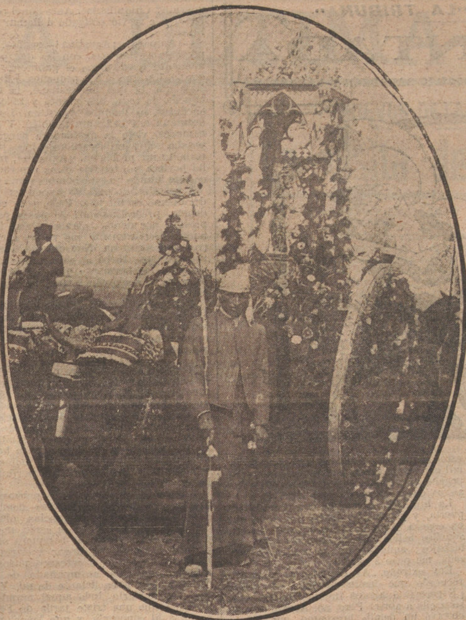
LA ROMERIA DE VALMES. — Carreta en que es conducida la famosa Virgen á su hermita de Dos Hermanas.

El próximo mes de Noviembre se verificará un curso de información para oficiales en lo referente al automovilismo y su aplicación en la guerra.