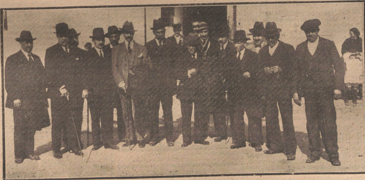
El presidente de la Diputación provincial, alcalde de Aranjuez y diputados provinciales, visitando los edificios.

NUMERO DEL TELEFONO DE LA REDACCION Y TALLERES DE «LA TRIBUNA», JARDINES, 4, 6 Y 8: 4.444.