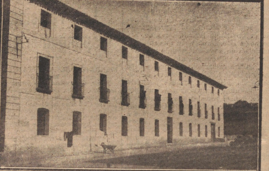
Las llamadas Casa de Pontejos y del Cuarterón y la Casa Negra, donde se instalará el Hospicio, en Aranjuez.