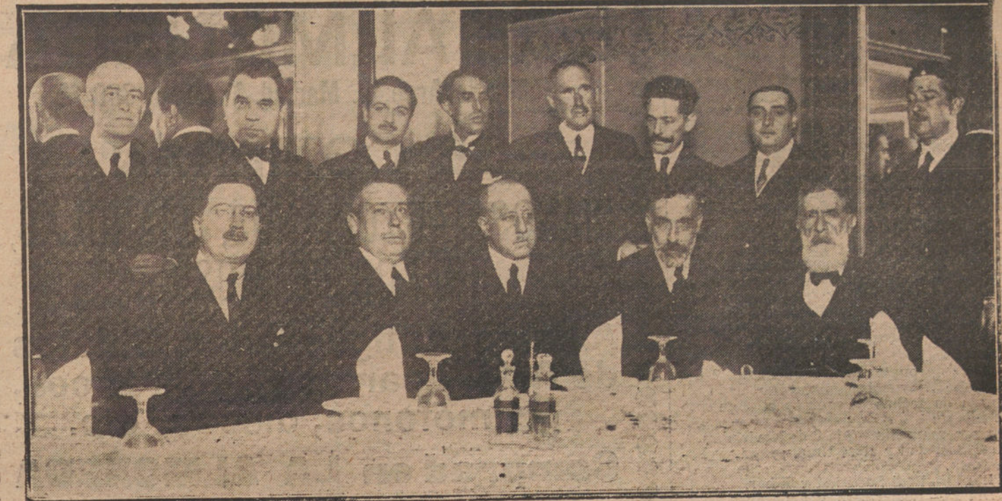
Banquete celebrado anoche en honor del ilustre dramaturgo catalán Ignacio Iglesias.

—Yo soy partidario—nos responde—de que se disuelva provisionalmente o que quede reducida a su menor número, por-