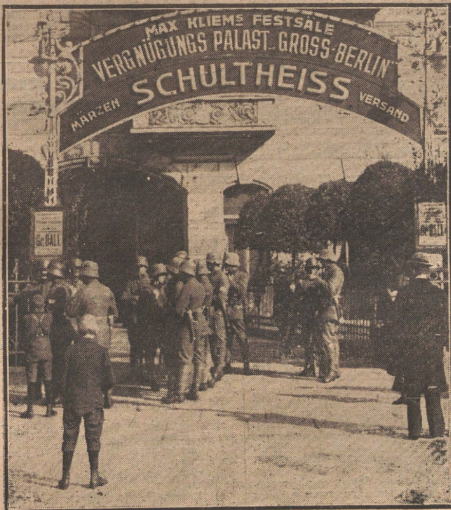
LA HUELGA DE METALURGICOS DE BERLIN. — Fuerzas del Ejército custodiando una de las grandes fábricas.

Si el Sr. Maura no tuvo mayoría en el país en las últimas elecciones, no