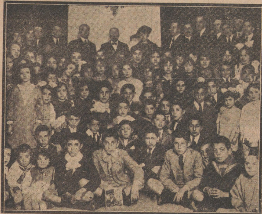
Alumnos de las escuelas del Centro Asturiano, a los cuales se repartieron ayer los premios del último curso.