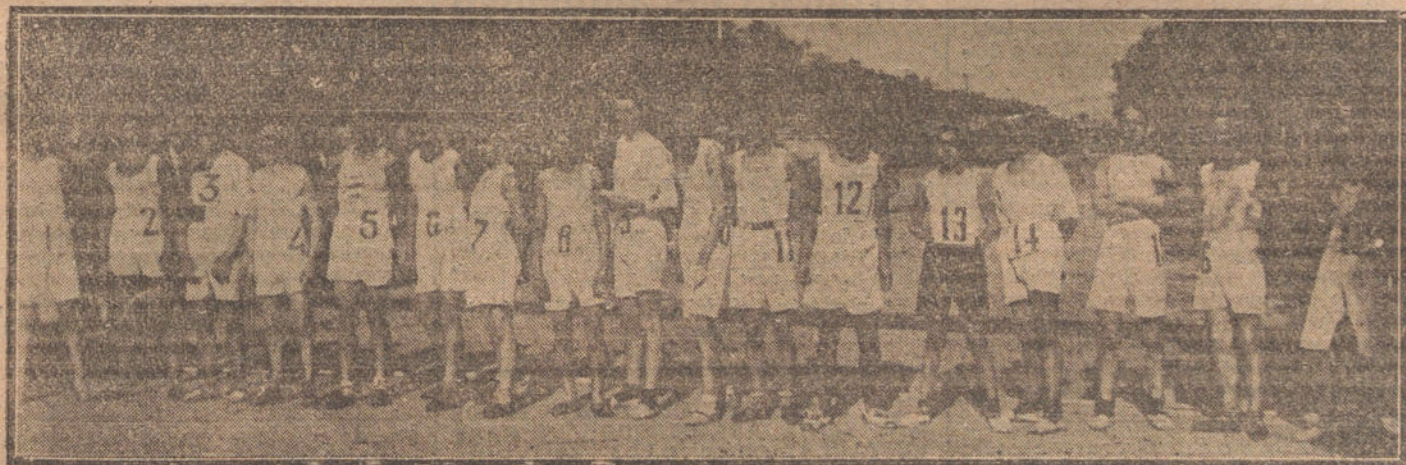
Grupo de corredores que han tomado parte en el festival organizado esta mañana por la Sociedad Cultural Deportiva.

Detalles y presupuestos a quien los solicite.