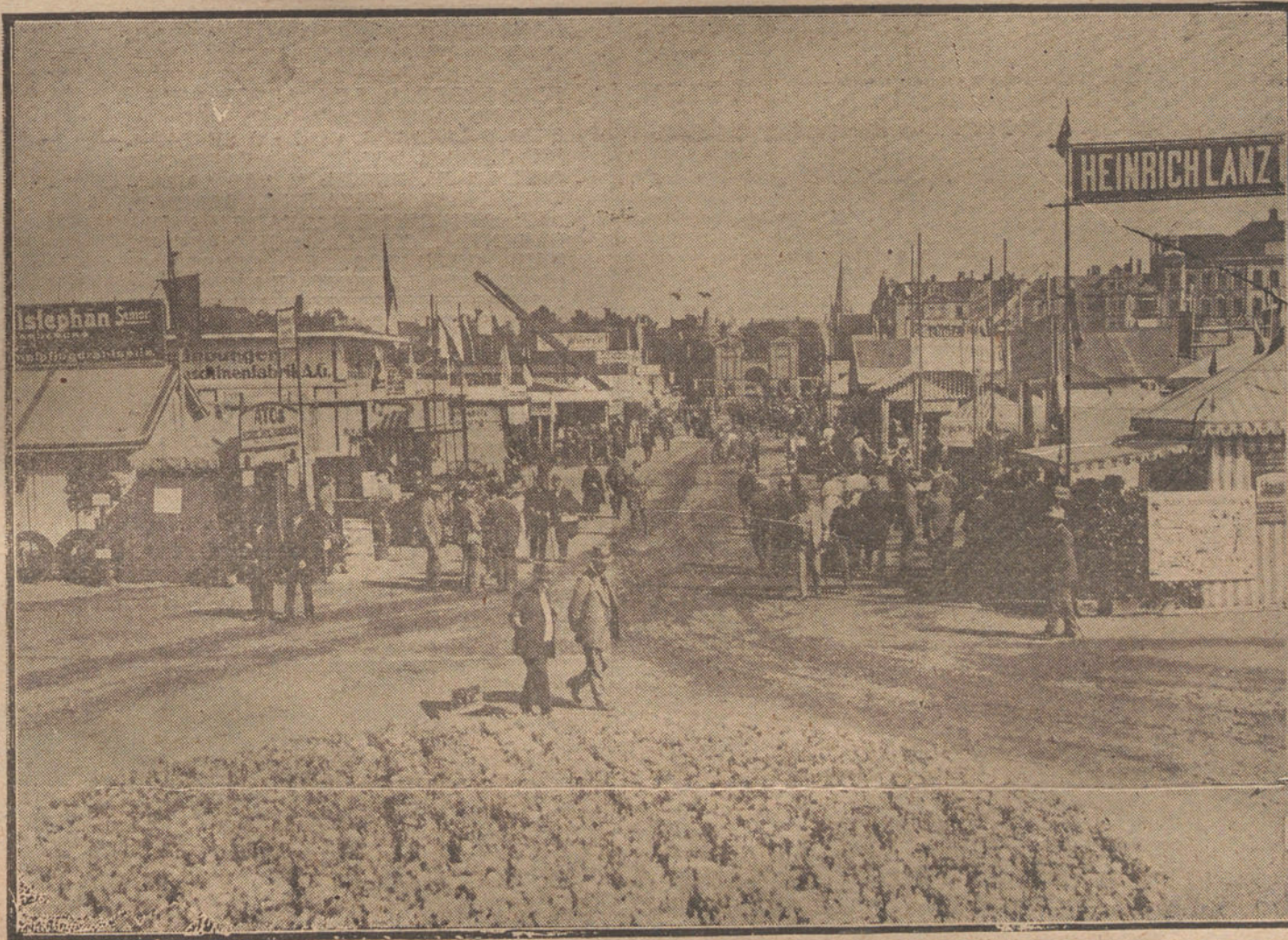
LA FERIA COMERCIAL DE FRANGFORT.—Vista del paseo principal de la Exposición.

Las negociaciones van por muy buen camino, y eso hace que las noticias de esta madrugada fueran más optimistas que en días anteriores.