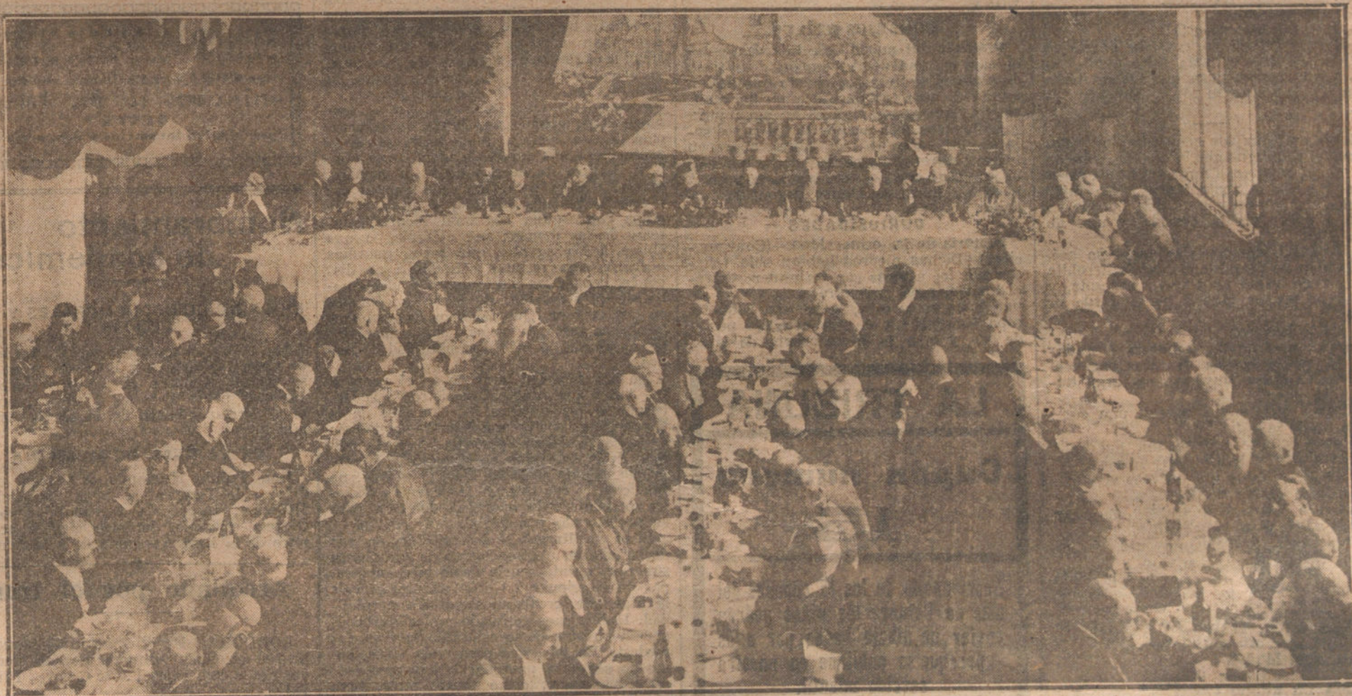
LA CONSAGRACION DE LA BASILICA DEL SACRADO JORAZON, EN PARIS.—Banquete ofrecido en Montmartre por el cardenal Amette, arzobispo de París, a los prelados asistentes a la ceremonia.

Se acordó dirigirse a los Poderes públicos para solicitar medidas que pongan término al estado actual de atraso de haberes.