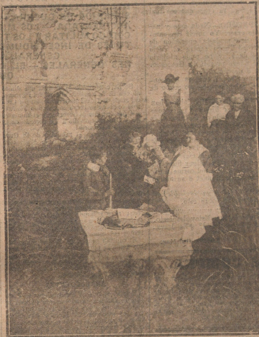
Un bautizo original, al aire libre, en una de las localidades francesas, devastadas por la guerra, y cuya iglesia está en ruinas.

Todo esto lo sabe bien el Sr. Sánchez de Toca, actual presidente del Consejo de ministros. Lo sabe, porque su cultura es muy extensa, y, aún más que por esto, porque no mira a su país con rosados cristales de aumento, viéndolo todo grande y bueno, como ocurre a la generalidad. El señor Sánchez de Toca es lo que muchos llaman «un hombre pesimista»;