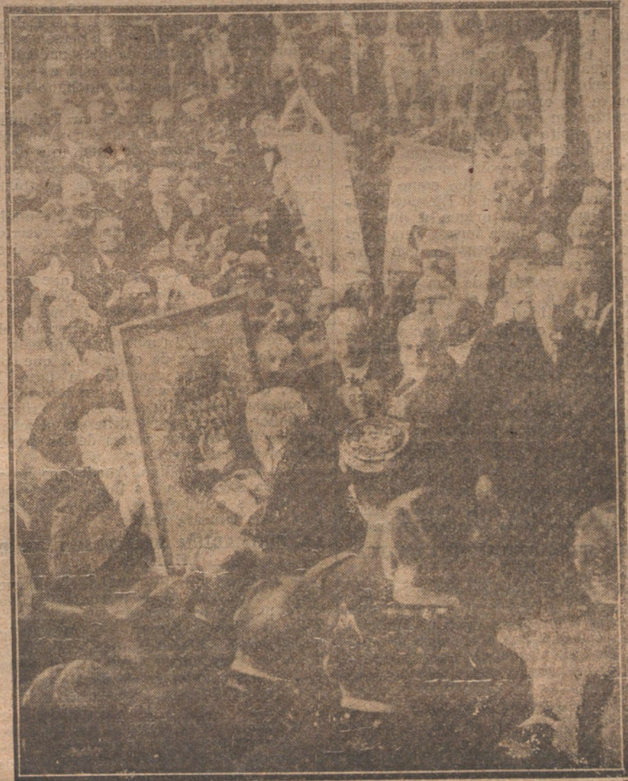
LA CONDECORACION DE PARÍS.—El Presidente de la República francesa, colocando sobre el escudo de París las insignias de la Cruz de Guerra.

lo que yo llamo, con más propiedad, «un hombre sincero». Podría entresacar algunos párrafos de sus libros, que dejan tananitos los apóstrofes y analémas que dictara a Joaquín Costa su más arrebatada cólera. Y esta valiente sinceridad, tan insólita en la España política de hoy, donde sólo medran la ficción y el desmayo, es lo que me lleva con irresistible simpatía hacia el Sr. Sánchez de Toca, a pesar de no haber militado jamás en su partido. Simpatía espiritual que no me impide reconocer y condenar el funesto error que ahora comete al hablar de nuestra curación sin extirpar primero el cáncer que actualmente nos corroe las entrañas.